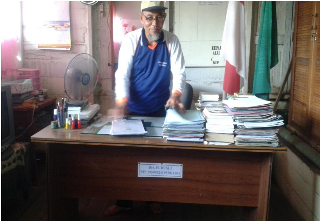
Ruang kepala madrasah