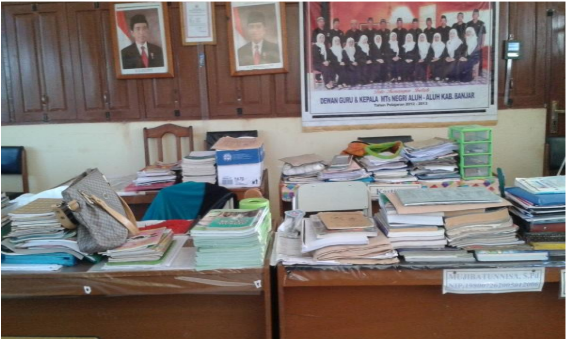
Ruang guru dan tata usaha