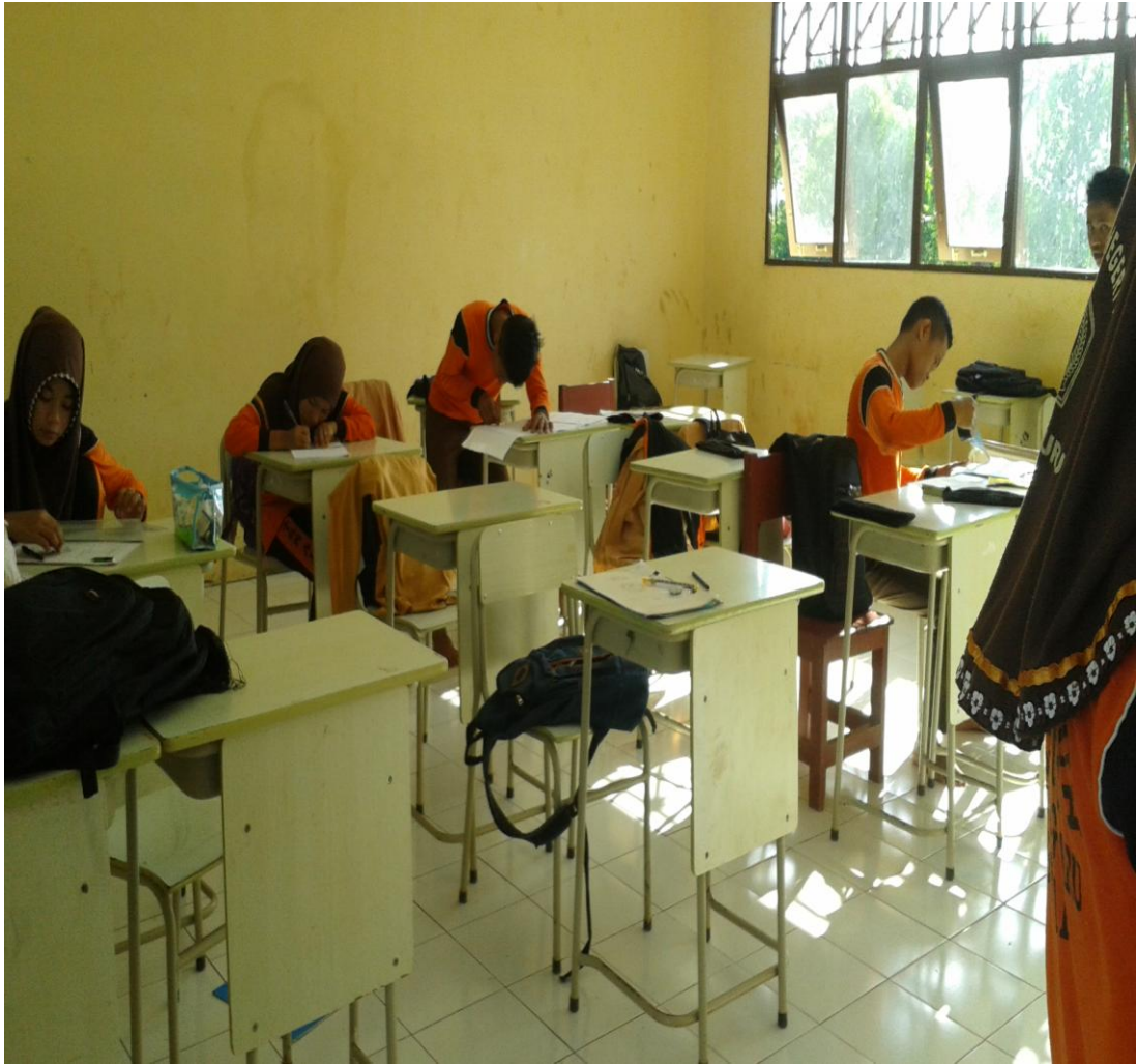
Ruang kelas IX B