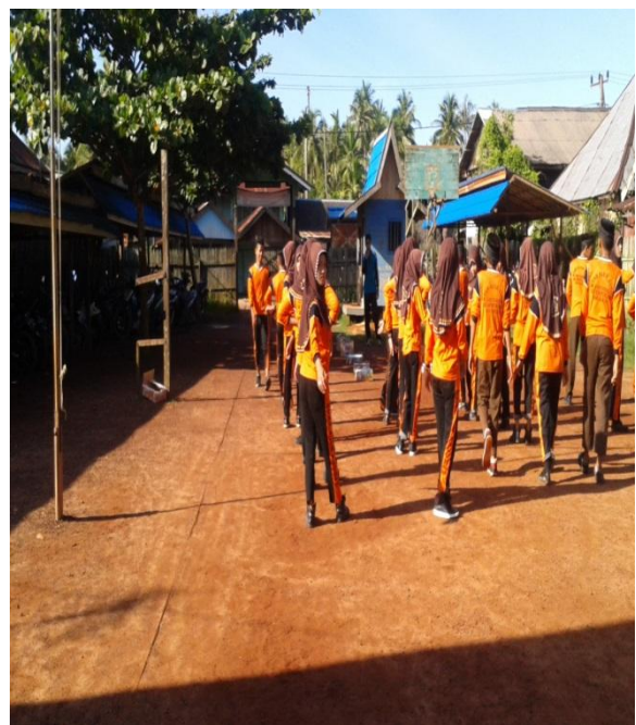
Lapangan olah raga