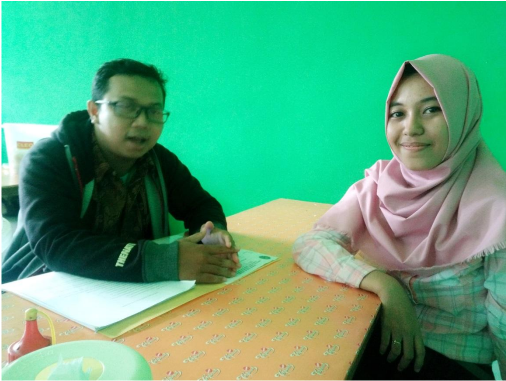
Bersama Narasumber “R”