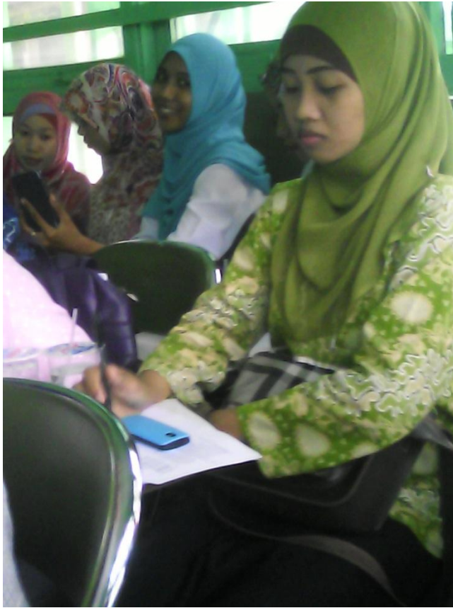
Seorang mahasiswi terlihat sedang berfoto selfie pada saat presentasi seminar proposal skripsi