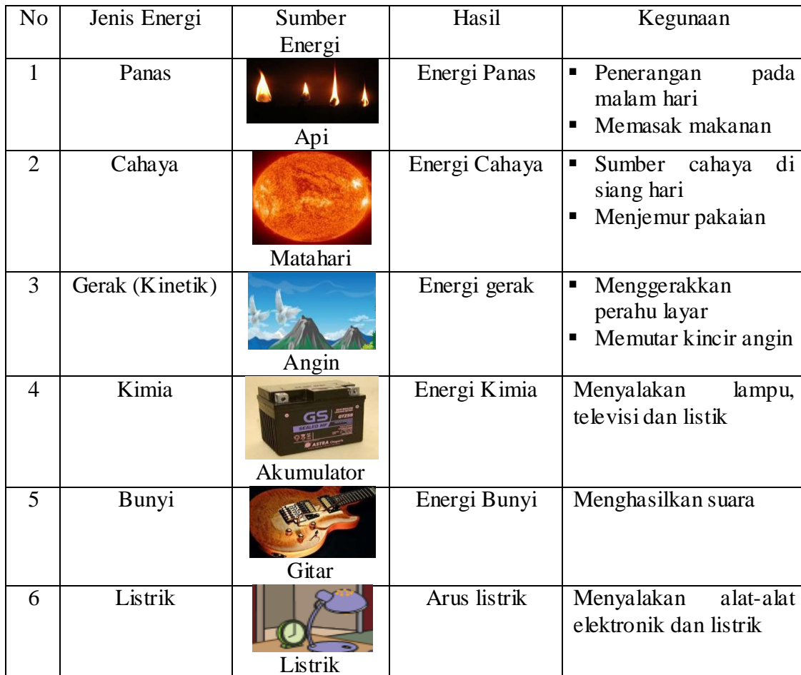
Tabel 2.2 Gambar Sumber-Sumber Energi dan Kegunaannya

Beberapa macam sumber energi dan kegunaannya dalam proses pembelajaran akan mudah dipahami siswa ketika ditunjukkan sumber-sumber energi disertai penjelasan kegunaannya. Hal ini tentunya memerlukan cara membelajarkan yang menuntun siswa menyimak, visualisasi bahkan mempraktekannya. Karenanya penting bagi guru menghadirkan fenomena-fenomena alam – betapa pun melalui alat peraga sederhana – ke dalam pembelajaran IPA.