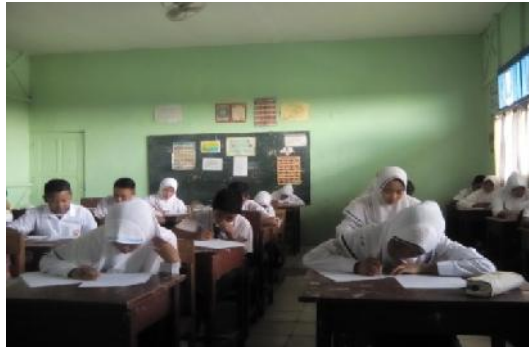
Gambar 4.4 Tes Akhir

Pada pertemuan ketiga dilakukan tes akhir, tes akhir dilakukan untuk mengukur tingkat penguasaan materi terkait dengan materi yang diajarkan yaitu tentang keliling dan luas lingkaran. Sedangkan jumlah butir soal yang diberikan sebanyak 9 soal.