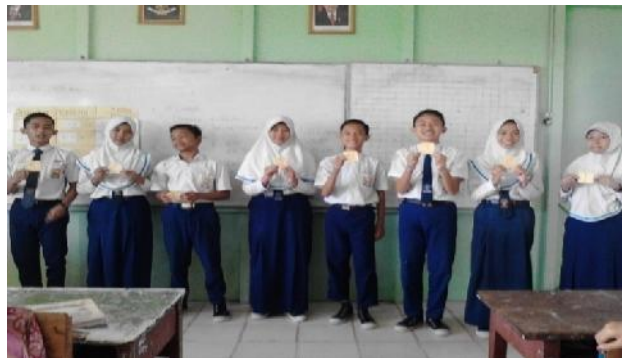
Gambar 4.2 Ketua Kelompok Mendapatkan Nomor

Guru memanggil ketua kelompok dan setiap kelompok mendapat tugas satu materi/tugas yang berbeda dari kelompok lain. Untuk memudahkan dalam tugas tersebut ketua kelompok diberi nomor 1, 2, 3, dan 4 guna memilih tugas yang berbeda dari kelompok lain. Masing-masing kelompok membahas materi yang sudah ada secara kooperatif yang bersifat penemuan. Guru membimbing siswa dalam penugasan.