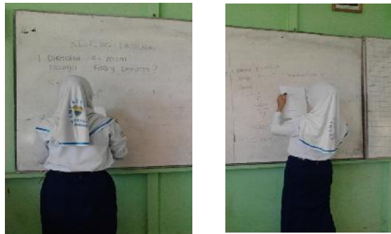
Gambar 4.12 Presentasi Hasil Diskusi

Tiap tim ahli mempresentasikan hasil diskusi. Bentuk presentasi tersebut dalam tulisan dan juga lisan agar siswa memperhatikan penjelasan secara jelas dan terang. Dalam hal ini semua siswa memperhatikan penjelasan dari tim ahli.