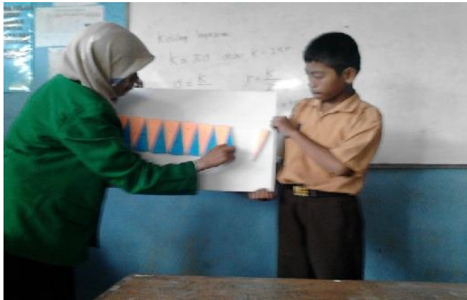
Gambar 4.5 Guru dan Siswa Mempraktekkan Alat Peraga

Peneliti menyiapkan rencana pembelajaran, caption , dan lembar kegiatan siswa yang akan digunakan pada saat proses pembelajaran. Rencana pembelajaran dibuat agar peneliti memiliki gambaran pembelajaran di kelas sedangkan caption dan lembar kegiatan siswa berguna untuk mempermudah para siswa belajar pada saat proses pembelajaran berlangsung.