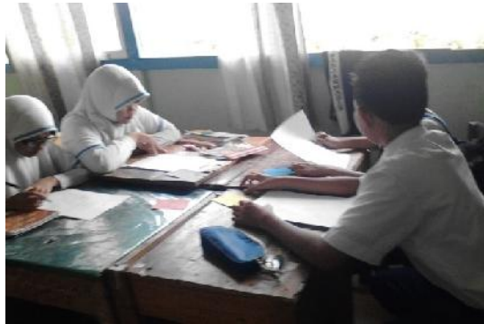
Gambar 4.11 Siswa Mengajarkan Temannya