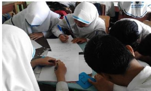
Gambar 4.10 Diskusi Kelompok

Anggota dari tim yang berbeda yang telah mempelajari bagian/sub bab yang sama bertemu dalam kelompok baru (kelompok ahli) untuk mendiskusikan sub bab mereka. Untuk mengetahui sub bab yang sama dari tiap kelompok itu dapat dilihat dari nomor yang telah didapatkan sebelumnya. Guru membimbing siswa dalam diskusi.