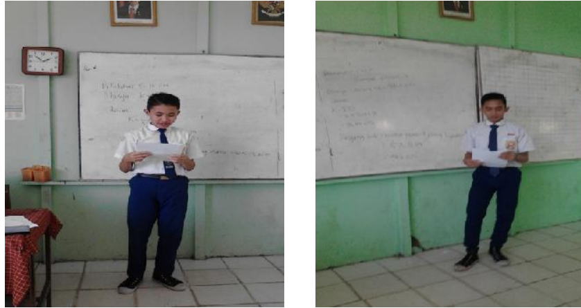
Gambar 4.3 Juru Bicara Kelompok Menyampaikan Hasil Pembahasan