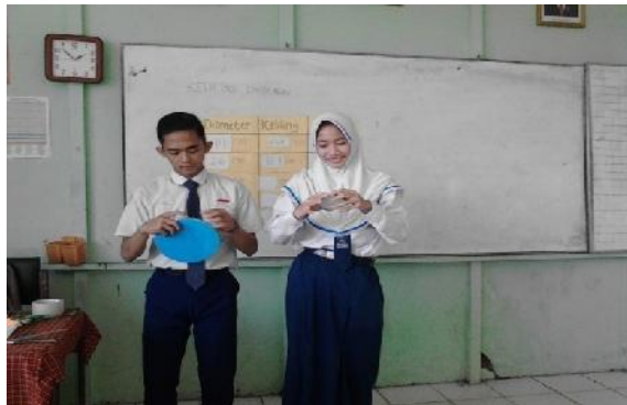
Gambar 4.1 Siswa Mempraktekkan Alat Peraga

Peneliti menyiapkan rencana pembelajaran, caption , dan lembar kegiatan siswa yang akan digunakan pada saat proses pembelajaran. Rencana pembelajaran dibuat agar peneliti memiliki gambaran pembelajaran di kelas sedangkan caption dan lembar kegiatan siswa berguna untuk mempermudah para siswa belajar pada saat proses pembelajaran berlangsung.