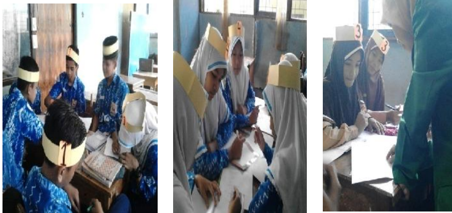
Gambar 4.6 Kerja Sama Kelompok dan Guru Membimbing Siswa

Guru menyuruh kerja sama antarkelompok. Siswa disuruh ke luar dari kelompoknya dan bergabung bersama beberapa siswa bernomor sama dari kelompok lain. Dalam kesempatan ini siswa dengan tugas yang sama bisa saling membantu atau mencocokkan hasil kerja sama mereka. Guru membimbing siswa dalam kerja sama kelompok.