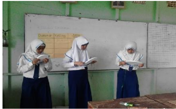
Gambar 4.9 Siswa Mempraktekkan Alat Peraga

Peneliti menyiapkan rencana pembelajaran, caption , dan lembar kegiatan siswa yang akan digunakan pada saat proses pembelajaran. Rencana pembelajaran dibuat agar peneliti memiliki gambaran pembelajaran di kelas sedangkan caption dan lembar kegiatan siswa berguna untuk mempermudah para siswa belajar pada saat proses pembelajaran berlangsung.