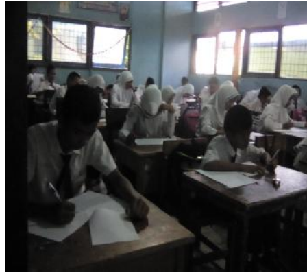
Gambar 4.8 Tes Akhir

tentang keliling dan luas lingkaran. Sedangkan jumlah butir soal yang diberikan sebanyak 9 soal.