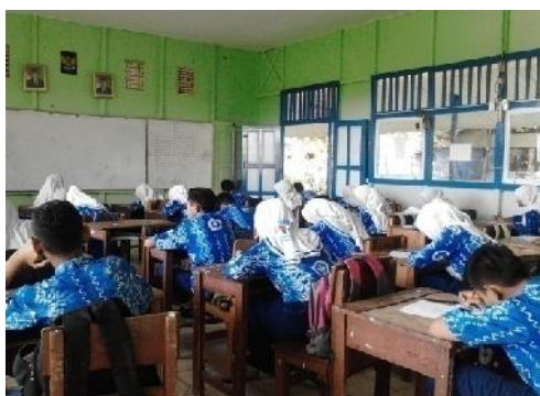
Gambar 4.13 Tes Akhir

Pada pertemuan ketiga dilakukan tes akhir, tes akhir dilakukan untuk mengukur tingkat penguasaan materi terkait dengan materi yang diajarkan yaitu tentang keliling dan luas lingkaran. Sedangkan jumlah butir soal yang diberikan sebanyak 9 soal.