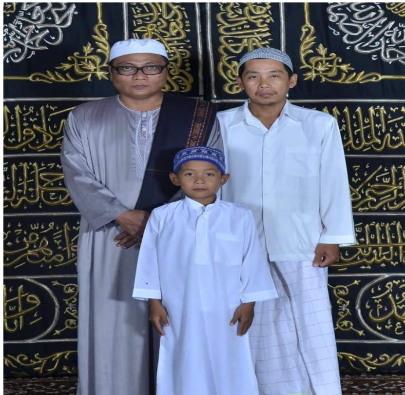
Foto Dengan Jama'ah Saat Pameran Kiswah