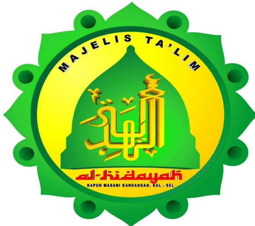
Logo Majelis Taklim Al-Hidayah