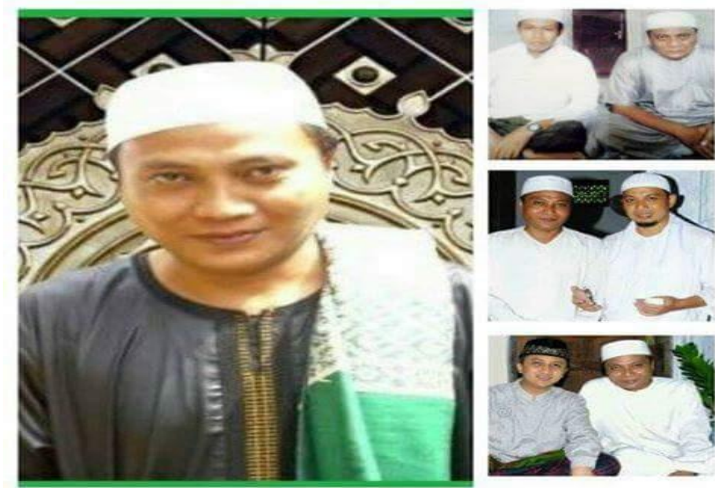
Bersama Ust. Arifin Ilham dan Ust. Yusuf Mansur