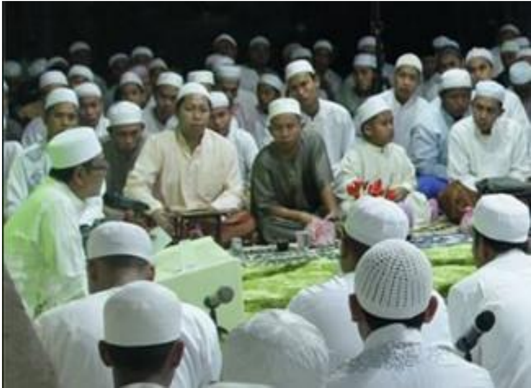
Suasana Pengajian (Jama'ah Pria)