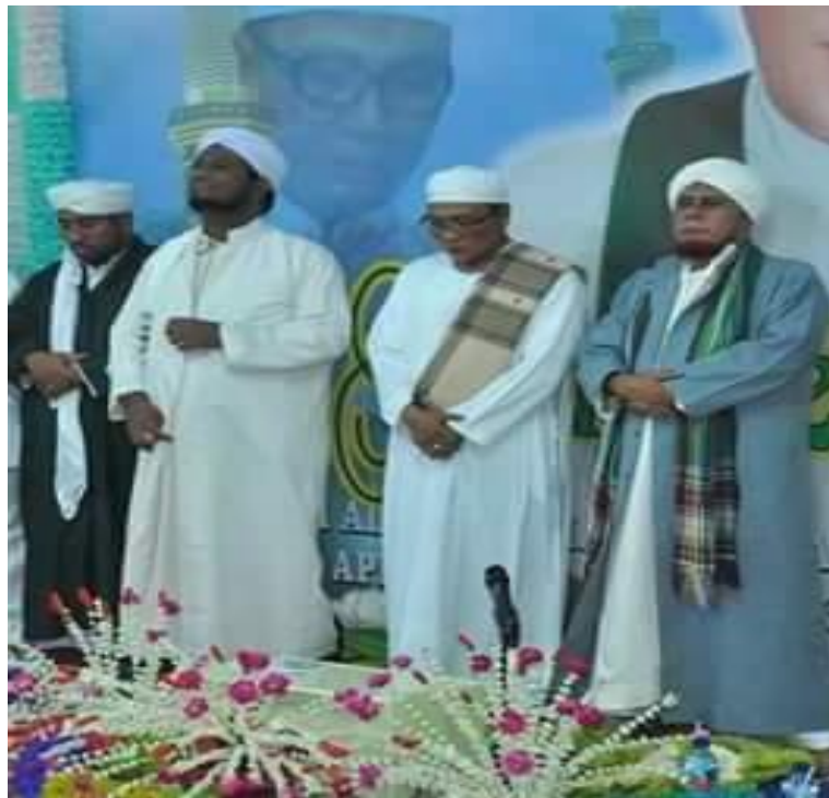
Bersama Para Habaib Pada Acara Haul Ke 11 Guru Sekumpul