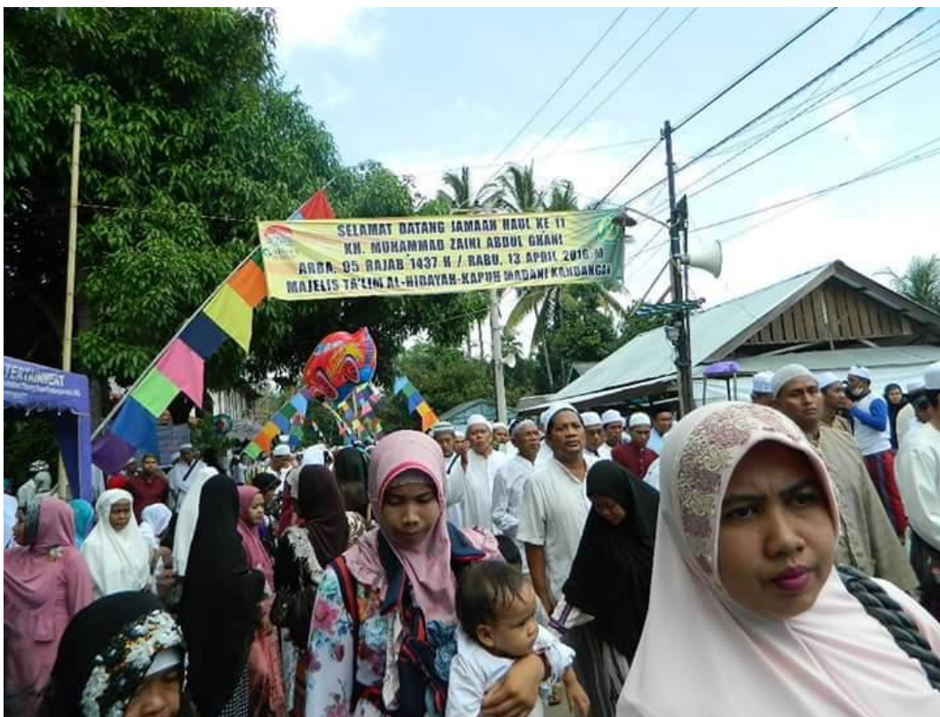
Acara Haul Ke 11 Guru Sekumpul Di Majelis Taklim Al-Hidayah