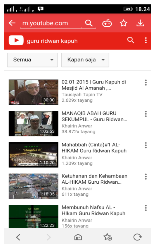
Media sosial Facebook dan Media online Youtube