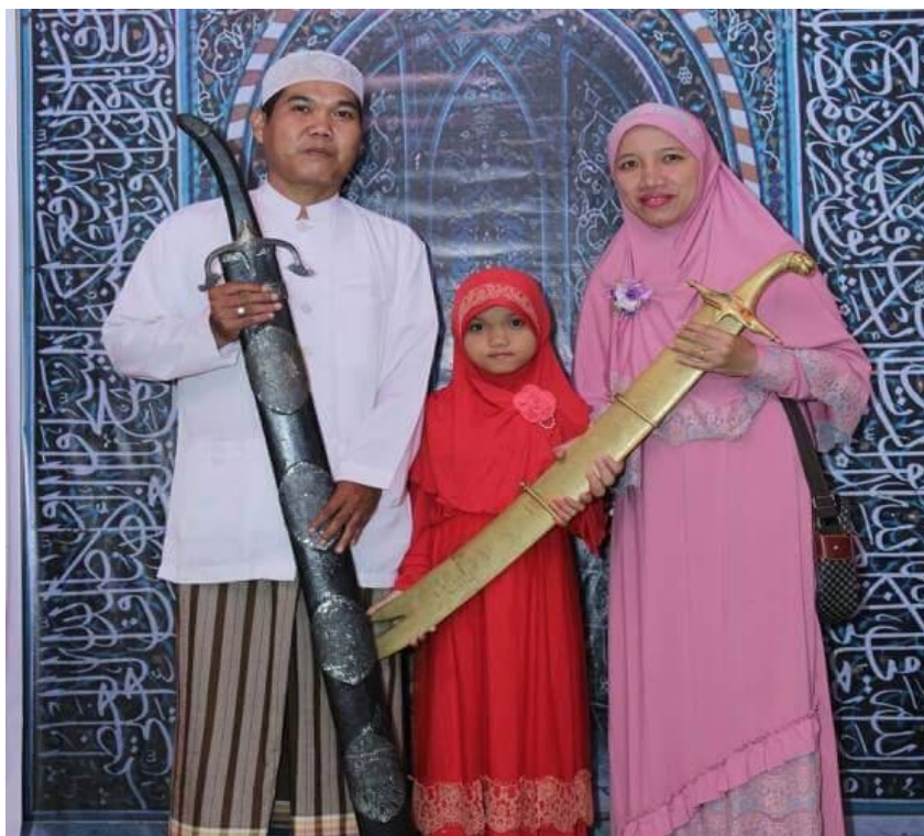
Foto Jama'ah Saat Pameran Pedang Nabi SAW dan Sahabat