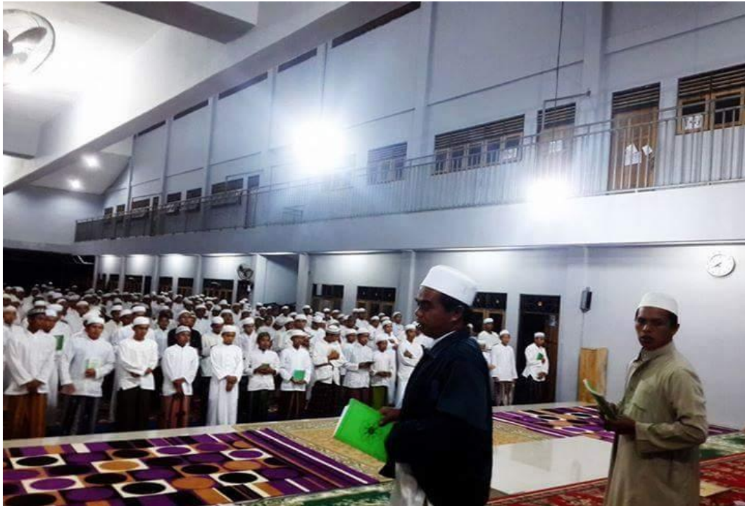
Pondok Pesantren Minhajul Abidin, Sungai Raya