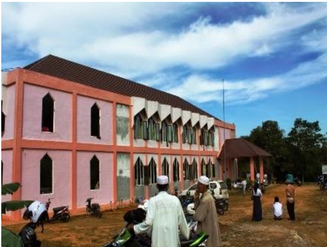
Pondok Pesantren Al-Baladul Amin, Telaga Langsat