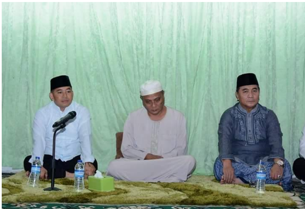
Bersama Bupati HSS (2013-2018) dan Ketua DPRD HSS