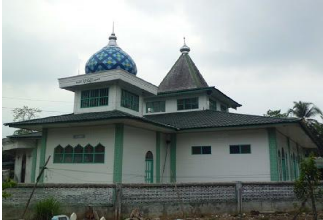
Masjid dan Majelis Taklim Al-Hidayah