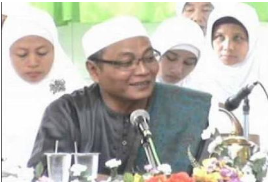
Suasana Pengajian (Jama'ah Wanita)