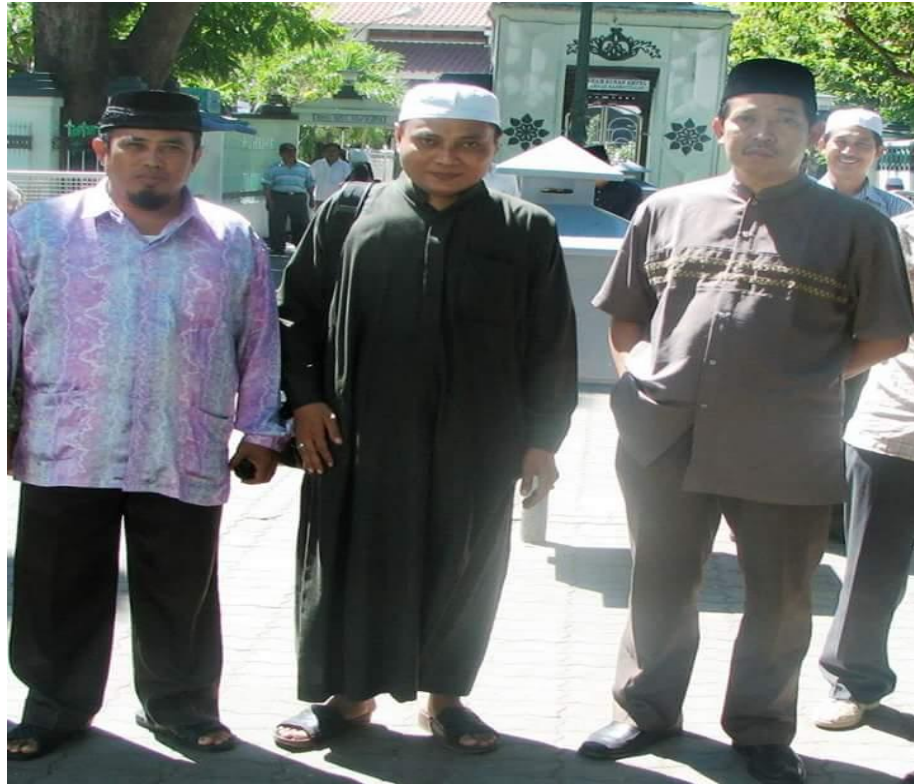
Bersama Bupati HSS (2003-2013) dan Ketua MUI HSS