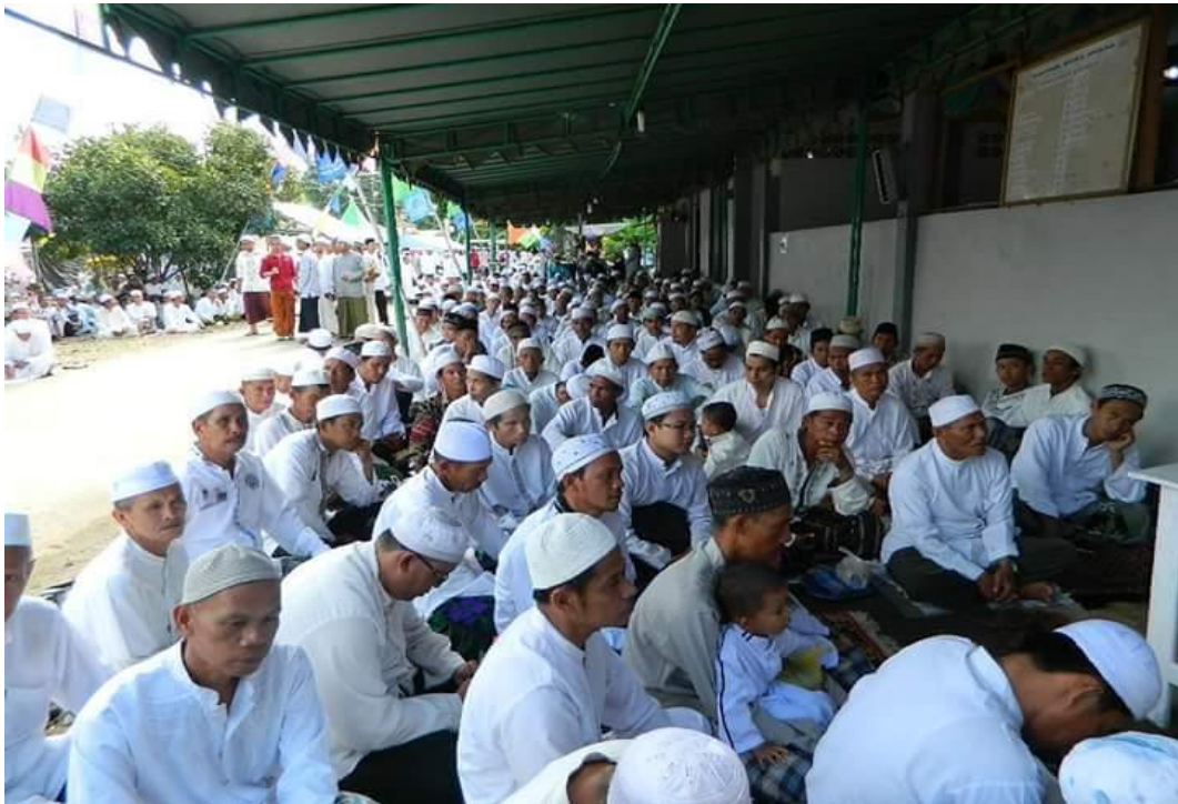
Jama'ah di Luar Masjid