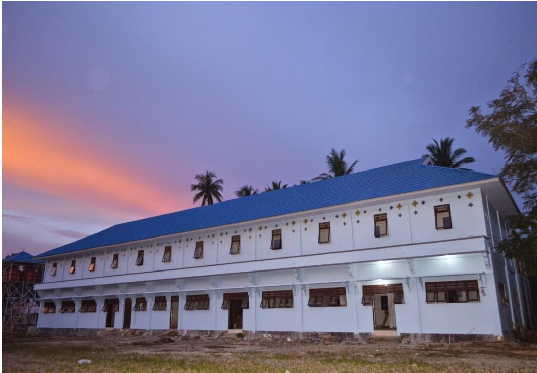
Madrasah Ibtidaiyah Ibnu Athaillah, Kapuh