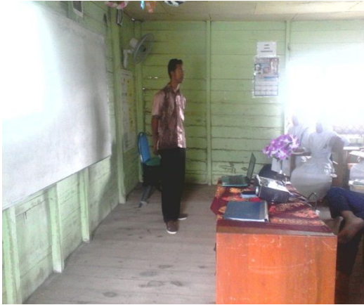
Gambar 8. Aktivitas siswa dan guru pada langkah question