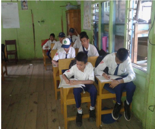
Gambar 13. Aktivitas siswa pada tes akhir