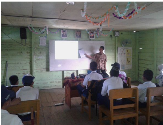
Gambar 2. Aktivitas siswa dan guru pada langkah question

Dalam tahap ini guru memberikan tugas untuk membuat pertanyaan tentang materi yang telah dilihatnya pada powerpoint dan guru memerintahkan siswa untuk mengutarakan pertanyaannya.