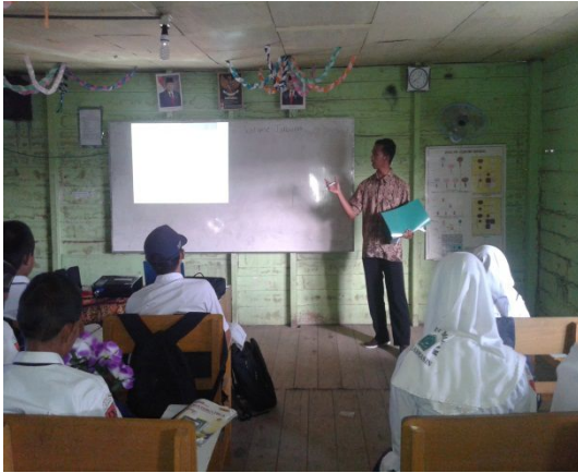
Gambar 3. Aktivitas siswa dan guru pada langkah read