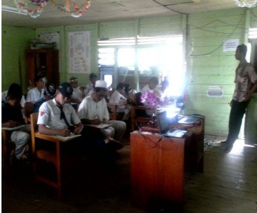
Gambar 12. Aktivitas siswa dan guru pada langkah read

Setelah itu, guru memberikan beberapa soal latihan kepada siswa dengan segala catatan dan buku tertutup dan meminta siswa mengumpulkannya.