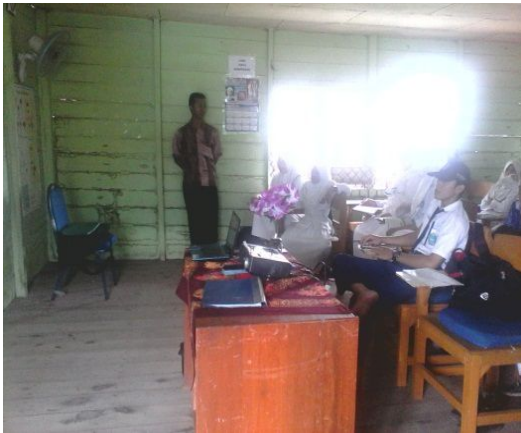
Gambar 9. Aktivitas siswa dan guru pada langkah read

Dalam tahap ini guru menampilkan keseluruhan materi tentang volume kerucut dalam bentuk powerpoint dan memerintahkan siswa untuk membaca dan menanggapi pertanyaan yang telah dibuat.