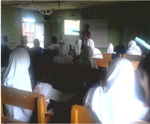
Gambar 10. Aktivitas siswa dan guru pada langkah reflect