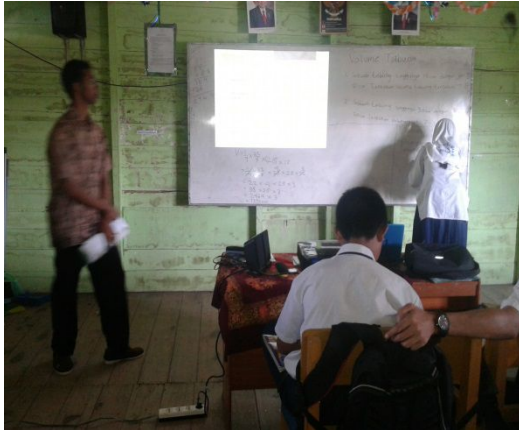
Gambar 5. Aktivitas siswa dan guru pada langkah recite