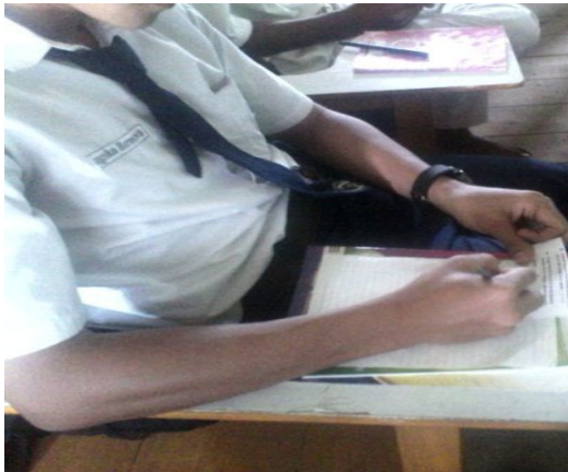
Gambar 6. Aktivitas siswa pada langkah review saat mengerjakan latihan

Pertama dalam tahap ini siswa diminta membaca hasil catatan intisari yang mereka buat dan membaca serta mengingat seluruh materi yang telah dipelajari. Setelah itu, guru memberikan beberapa soal latihan kepada siswa dengan segala catatan dan buku tertutup dan meminta siswa mengumpulkannya.