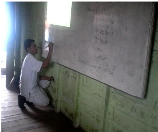
Gambar 11. Aktivitas siswa pada langkah recite

Dalam tahap ini siswa diminta mengerjakan soal dan guru membimbing siswa dalam mengerjakan soal. Dalam tahap ini pula siswa diminta membuat intisari dari seluruh pembelajaran.