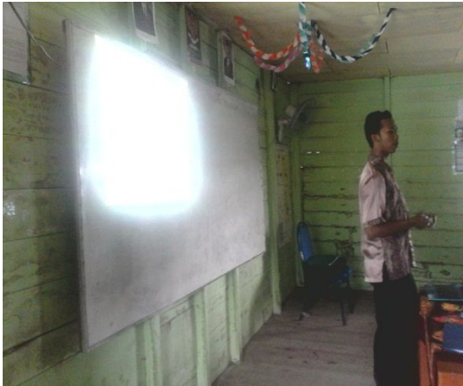
Gambar 7. Aktivitas guru pada langkah preview

Dalam tahap ini guru menampilkan powerpoint materi berupa gambaran bentuk tabung dan guru memberikan perintah kepada siswa untuk melihat selintas materi tersebut.