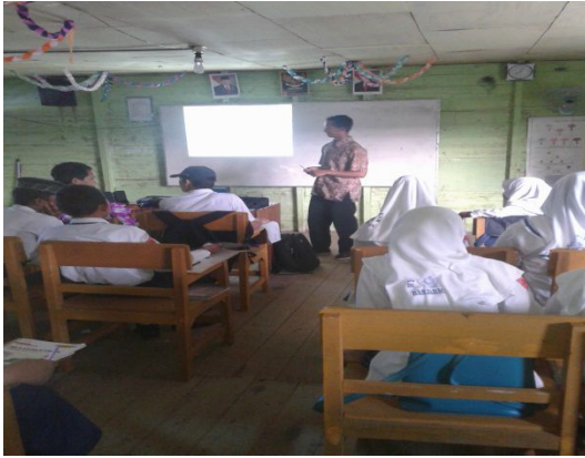
Gambar 1. Aktivitas siswa dan guru pada langkah preview