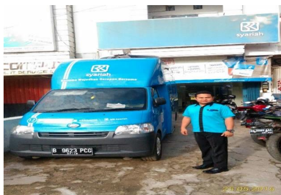
Peneliti sedang berada di depan kantor KCP Kayu Tangi.