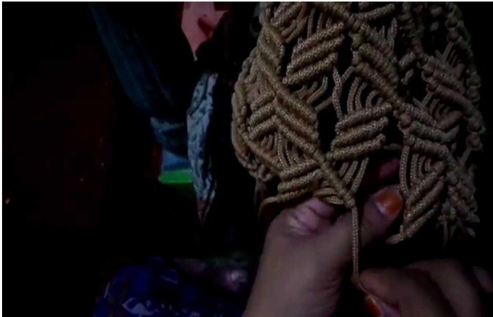
Cara membuat motif atau pola tas