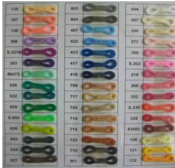
Kumpulan warna tali