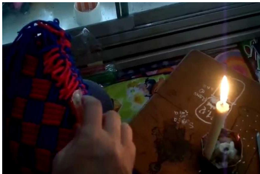
Kegiatan mengolah rajutan tali kur dengan alat yang sederhana seperti lilin atau korek api