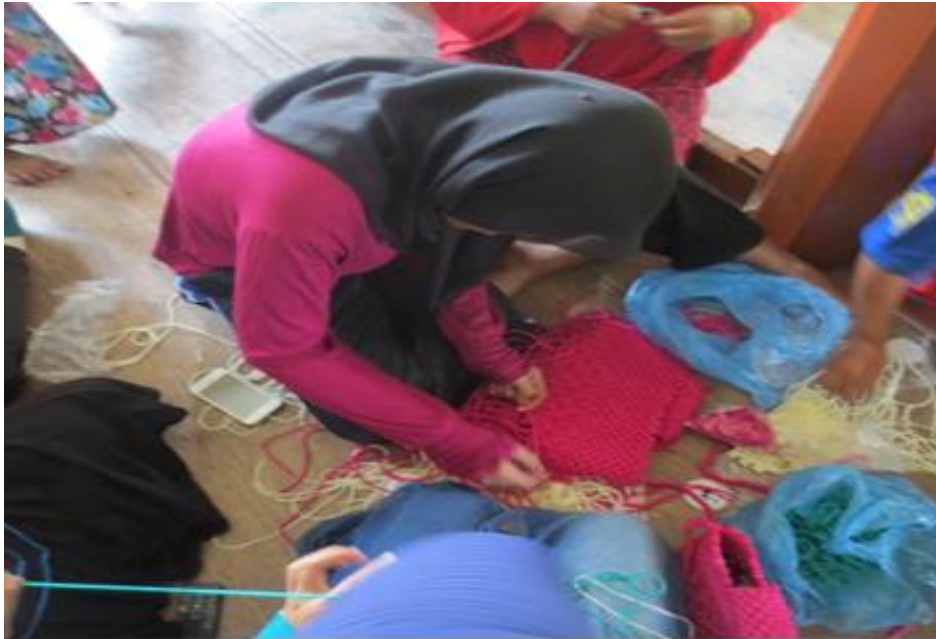
Kegiatan para pengrajin dalam memproduksi tas rajutan tali kur