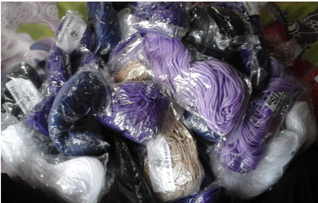
Tali kur sebagai bahan baku untuk membuat tas dan dompet