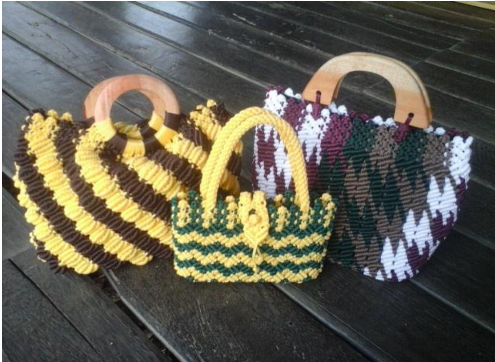
Tas dan dompet hasil dari rajutan tali kur