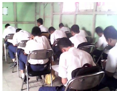
Gambar 4.6 Aktivitas siswa ketika mengerjakan kuis individu