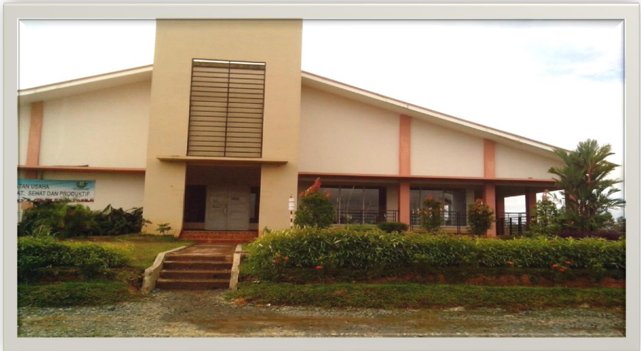
Photo Kantor PT. Darma Henwa