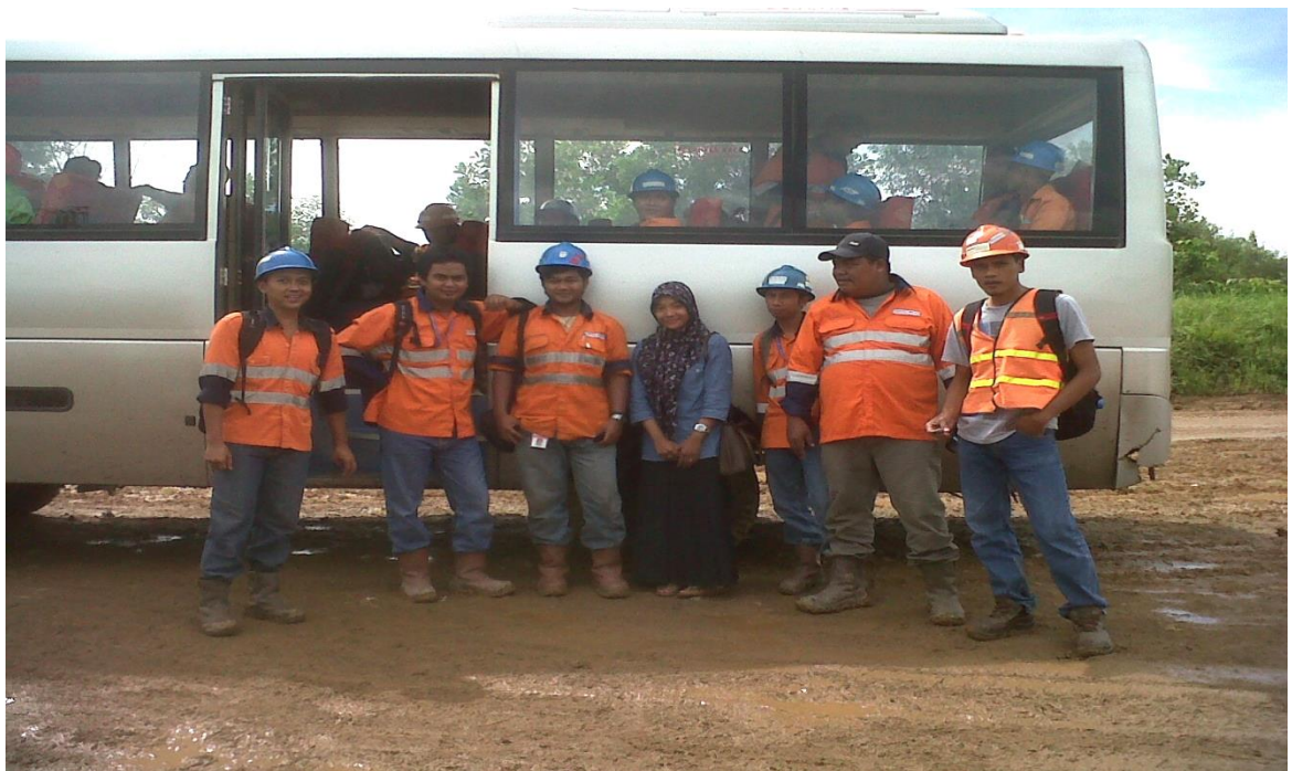
Photo Bersama Responden Di Halte Bus Karyawan PT. Darma Henwa