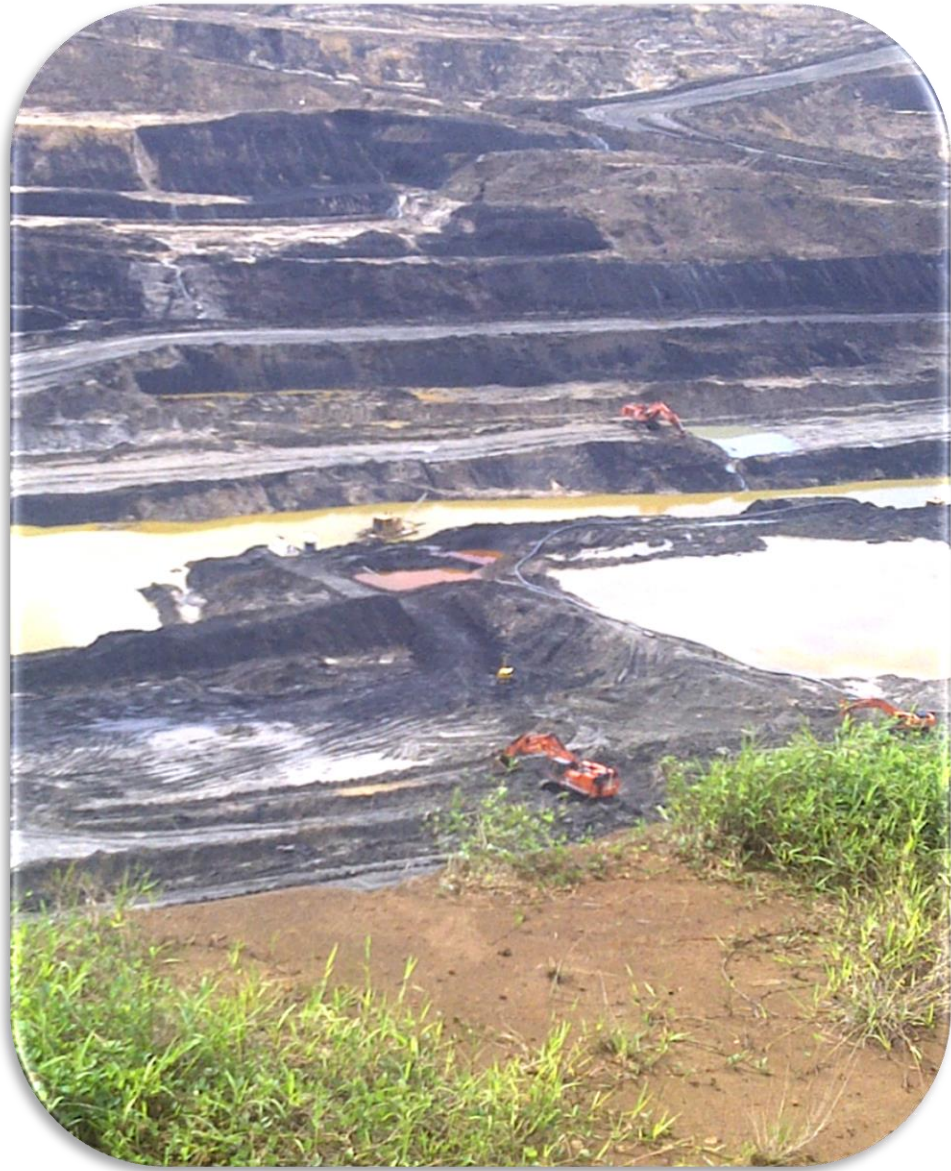
Photo Lokasi Tambang Yang Sudah Digali