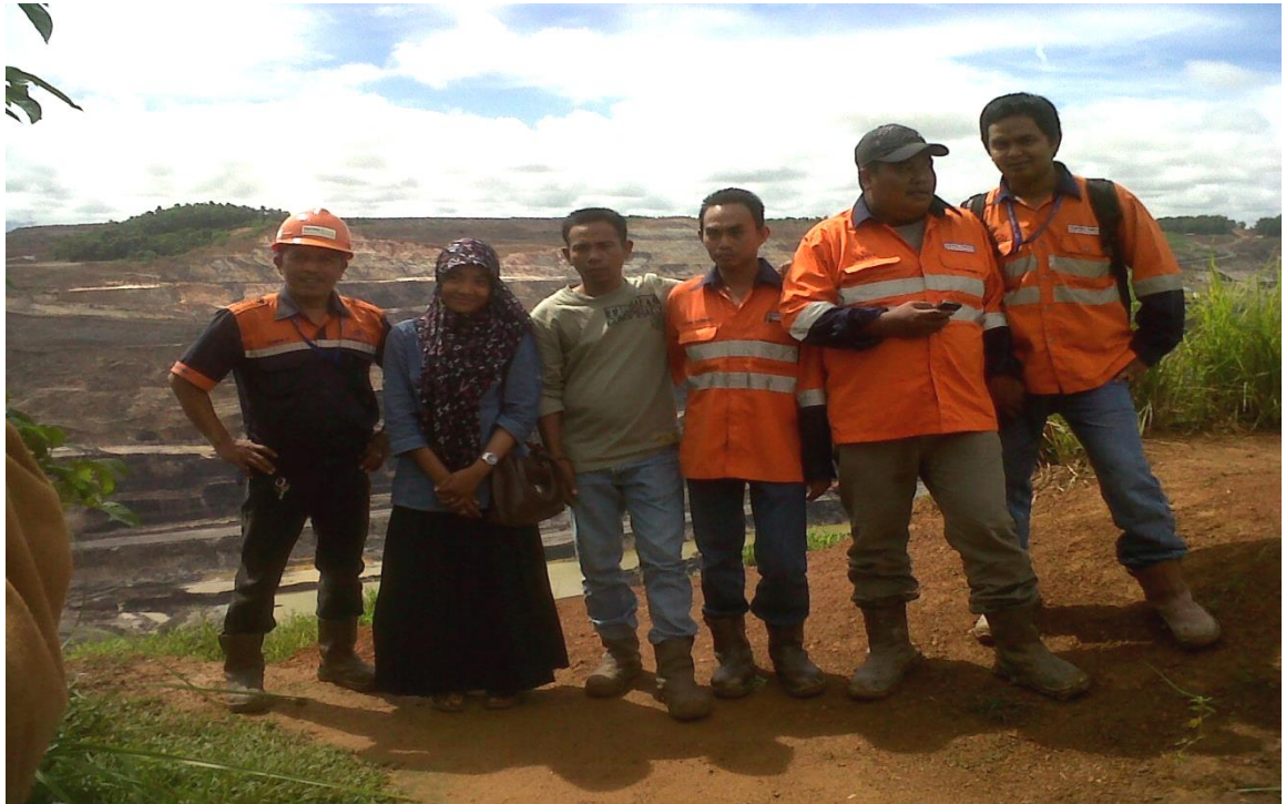
Photo Bersama Responden Di Lokasi Tambang PT. Darma Henwa