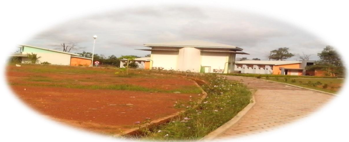
Photo Masjid Di Lokasi PT. Darma Henwa