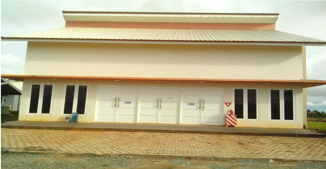
Lokasi PT. Darma Henwa