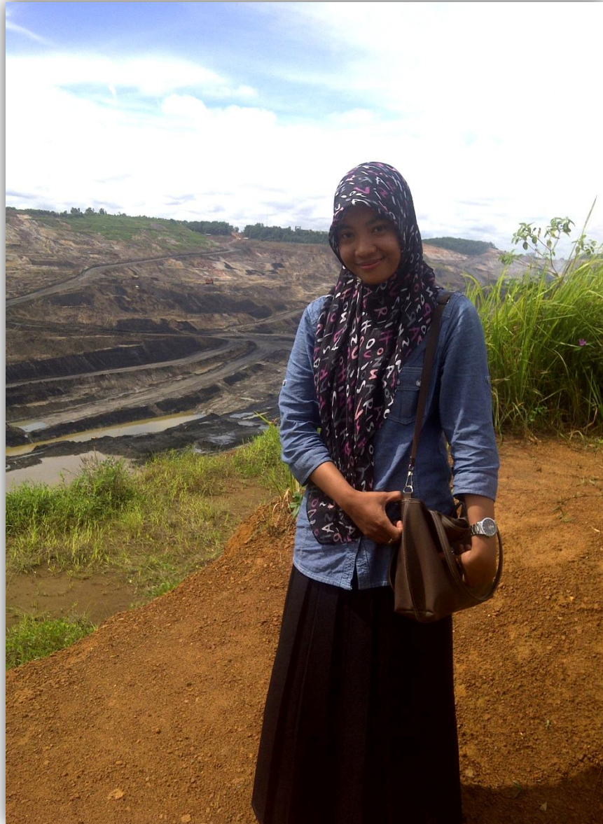
Photo Penulis Di Lokasi Tambang PT. Darma Henwa