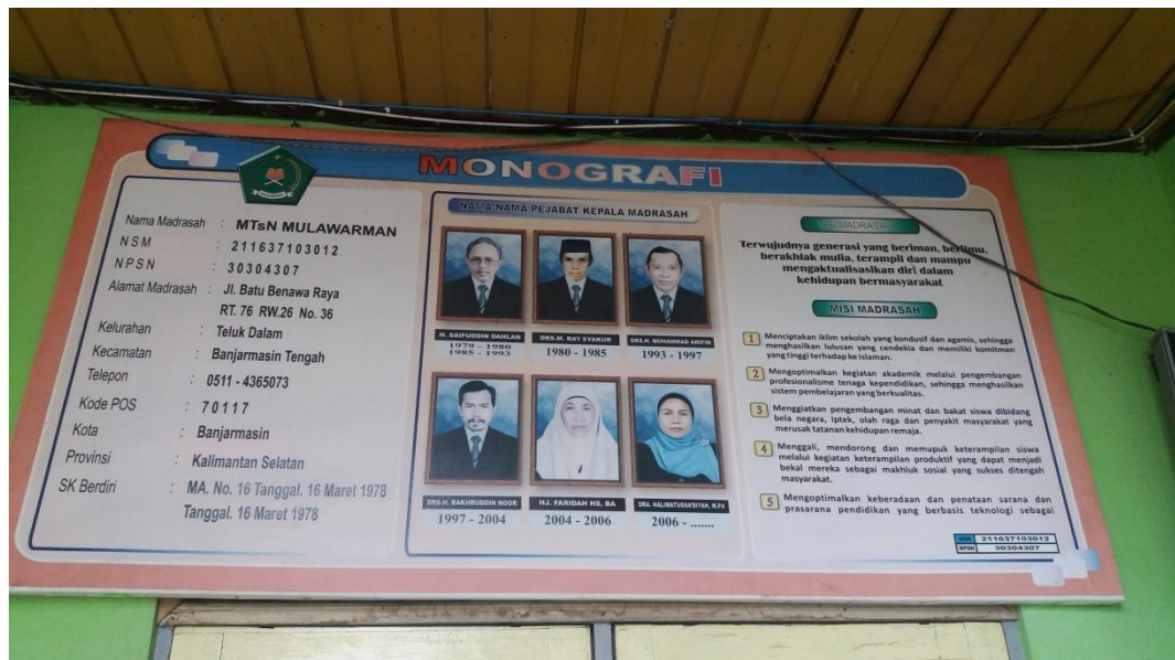
Monografi MTsN Mulawarman Banjarmasin