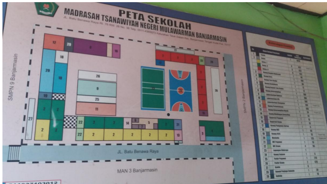
Peta Sekolah MTsN Mulawarman Banjarmasin