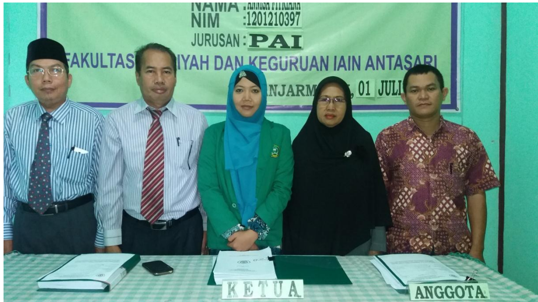
Foto Sidang Munaqasah pada Hari Jumat Tanggal 01 juli 2016