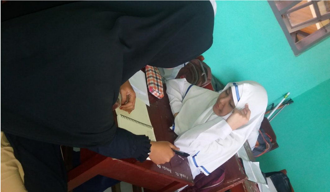
Wawancara dengan salah satu peserta didik