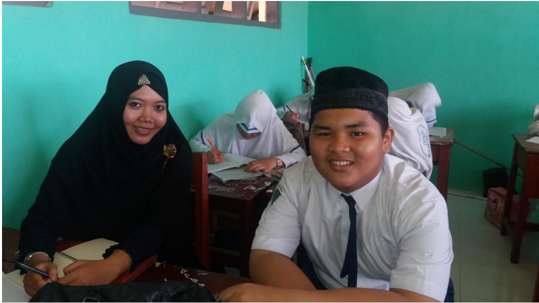
Wawancara dengan peserta didik