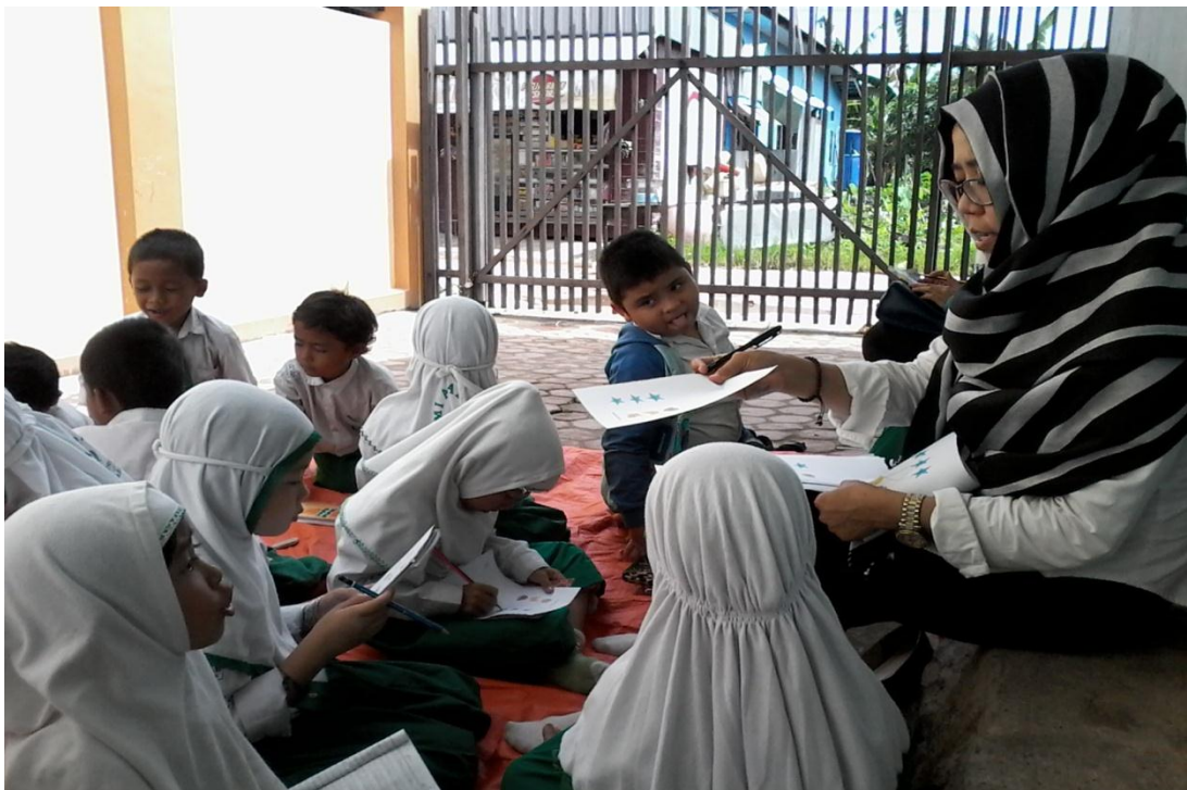
proses evaluasi diakhir pelajaran