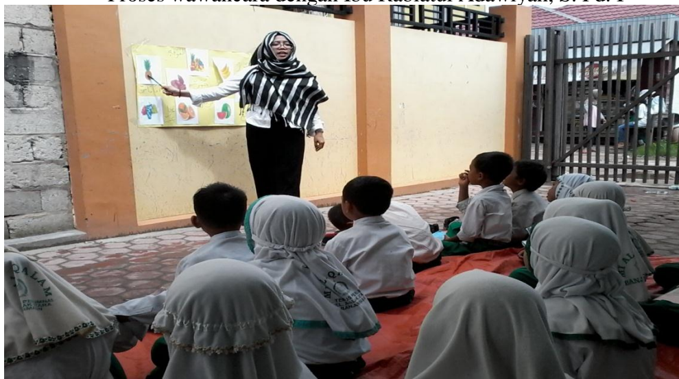
Ibu sedang menjelaskan materi menggunakan media gambar