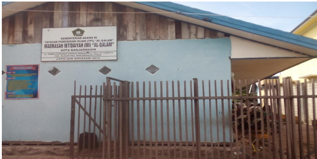
Bangunan MI Al-Qalam