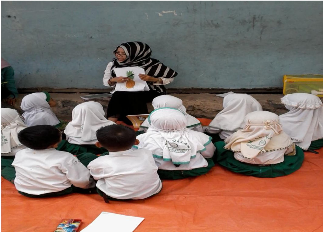
Ibu membacakan kosa kata menggunakan bahasa arab siswa mengikuti