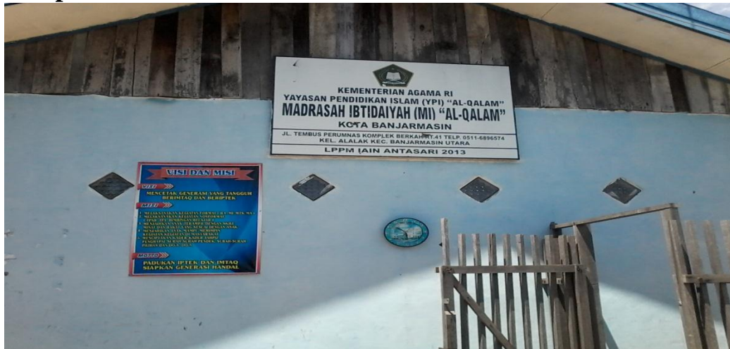
Papan Nama Sekolah dan Visi dan Misi MI Al-Qalam