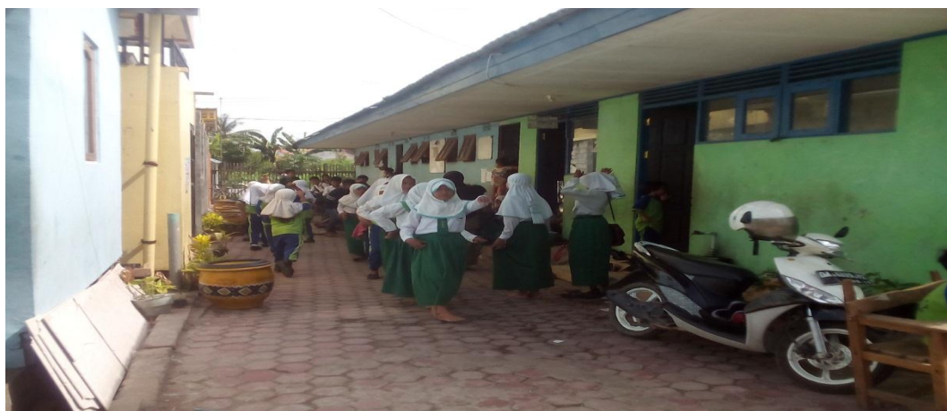
Bagunan Kelas dan Kantor MI Al-Qalam