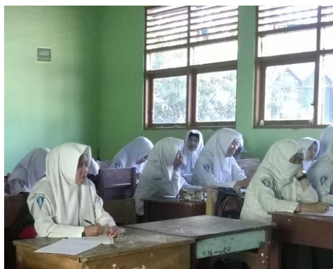
Gambar 4. 6. Suasana berlangsungnya tes awal ( pretest )

Sebelum memasuki materi terlebih dahulu peneliti memberi salam kepada siswa, kemudian mengecek kehadiran siswa dan menyampaikan judul materi yang akan disampaikan kepada siswa. Pada pertemuan pertama ini siswa diminta untuk mengerjakan soal pretest untuk mengetahui kemampuan awal siswa. Suasana berlangsungnya tes awal dapat dilihat pada gambar berikut.