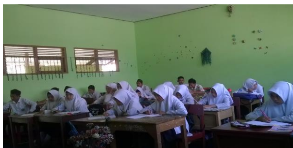
Gambar 4. 2. Suasana berlangsungnya tes kemampuan awal siswa

Sebelum memasuki materi terlebih dahulu peneliti memberi salam kepada siswa, kemudian mengecek kehadiran siswa dan menyampaikan judul materi yang akan disampaikan kepada siswa. Pada pertemuan pertama ini siswa diminta untuk mengerjakan soal pretest untuk mengetahui kemampuan awal siswa. Suasana berlangsungnya tes awal dapat dilihat pada gambar berikut.