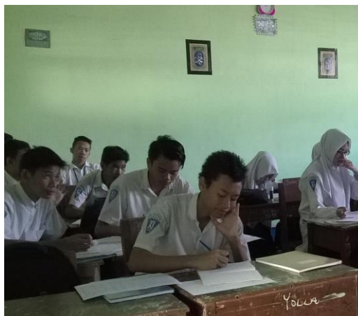
Gambar 4. 9. Kegiatan siswa saat tes akhir