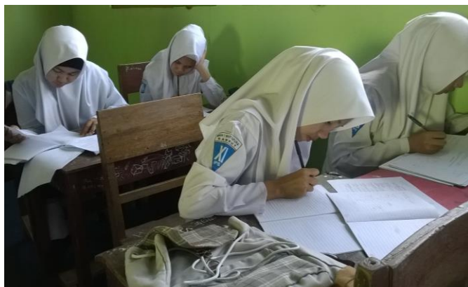
Gambar 4. 8. Keadaan siswa mengerjakan soal latihan