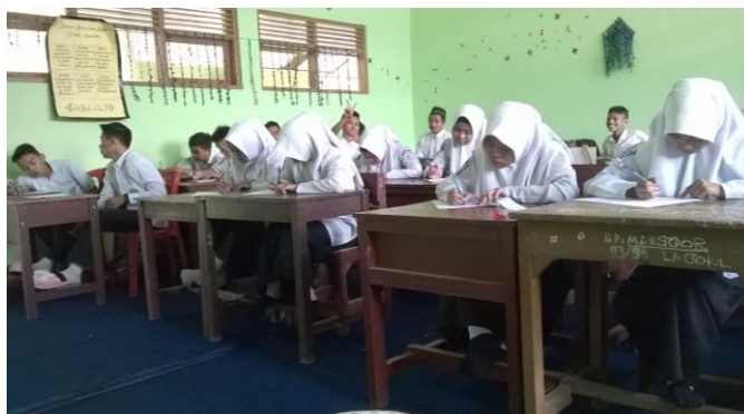
Gambar 4. 5. Kegiatan siswa saat tes akhir