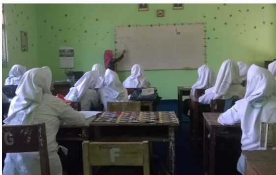
Gambar 4. 3. Penyampaian materi

Guru menyajikan materi tentang komposisi fungsi menggunakan rencana pelaksanaan pembelajaran yang telah dibuat disertai dengan contoh-contoh soal dan cara menyelesaikannya. Sebelumnya guru menjelaskan materi terlebih dahulu. Setelah itu guru mengadakan tanya jawab dengan siswa untuk mengetahui pemahaman terhadap materi yang diberikan, dan memberikan kesempatan yang sama kepada setiap siswa untuk bertanya.