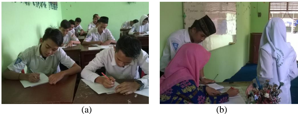
Gambar 4. 4. (a) Latihan Individu dan (b) Pemeriksaan Jawaban Individu

membimbing siswa sampai siswa benar-benar dapat mengerjakannya dengan benar.