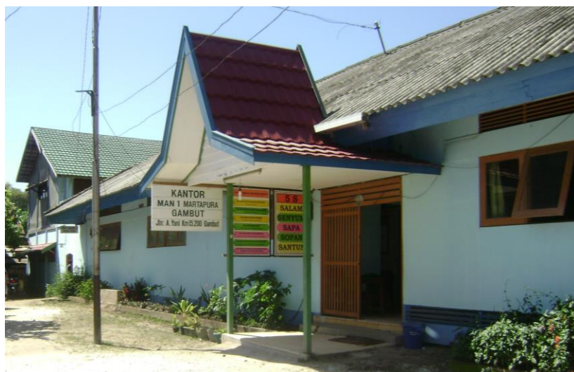
Gambar 4. 1. Bagian depan kantor MAN 1 Martapura

Sejak tahun 1958 - 1969 bernama Yayasan Pendidikan Sinar Harapan berubah menjadi PGAN 6 TH 1970 - 1977 dan alih fungsi menjadi MAN Gambut tahun 1978. Berdasarkan Surat Direktur Jendral Binbaga Islam Departemen Agama RI no.: E.IV/PP.00.6/KEP/17.A/1978 tanggal 16 Maret 1978 Surat Keputusan Kepala Kantor Wilayah Departemen Agama Propinsi Kalimantan Selatan mulai 1996 MAN Gambut berubah nama menjadi MAN 1 Martapura. MAN 1 Martapura terletak di jalan A. Yani Km 15.200 RT. 23 Gambut Kabupaten Banjar.