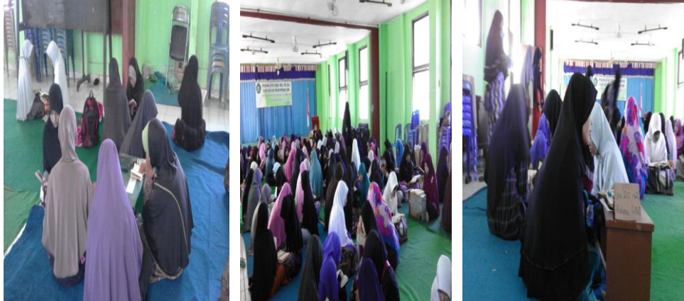
Gambar 4.7 Kegiatan Sima'an

Sima'an yakni memperdengarkan bacaan Alquran yang pernah dihafalkan sebelumnya kepada instruktur. Kegiatan ini dilakukan dalam 1 (satu) bulan sekali. Program ini dilaksanakan secara bersamaan dalam satu ruangan untuk seluruh mahasiswi Sekolah Tinggi Ilmu Alquran (STIQ) Amuntai, seperti di Auditorium atau Masjid Raya At-Taqwa Amuntai. Sebelum pelaksanaan sima'an dilakukan, biasanya satu bulan sebelumnya mahasiswi dibagi menjadi beberapa kelompok berdasarkan jumlah hafalan yang dimiliki. Misalnya mahasiswi yang telah hafal 3 juz juga akan dikelompokkan dengan mahasiswi yang hafal 3 juz, yang hafal 10 juz juga akan dikelompokkan dengan mahasiswi yang hafal 10 juz, dan seterusnya hingga mahasiswi yang telah hafal seluruh Alquran yakni 30 juz juga akan dikelompokkan dengan mahasiswi yang hafal 30 juz. Setiap kelompok terdapat satu orang instruktur yang bertanggung jawab untuk memperdengarkan hafalan mahasiswi dalam kegiatan tersebut. Bahkan instruktur pun juga mendapat bagian untuk memperdengarkan hafalan Alqurannya kepada instruktur atau mahasiswi yang lain. Jumlah hafalan yang wajib diperdengarkan kepada instruktur mulai dari dua setengah lembar hingga satu