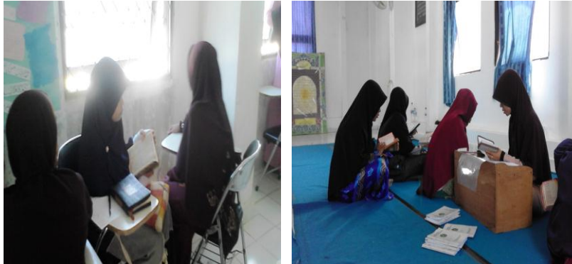
Gambar 4.4 Setoran Tahsin

Pada setoran tahsin , mahasiswa pada semester I (satu) wajib menyetor bacaan Alquran kepada instruktur untuk diperbaiki agar sesuai dengan kaidah ilmu tajwid. Sehingga mendapat rekomendasi dari instruktur tahsin tersebut untuk melanjutkan ke program tahfizh . Setoran tahsin juga dapat berlanjut ke semester berikutnya, jika masih ada mahasiswi yang belum fasih bacaannya, sehingga hal tersebut wajib dilakukan sebelum mahasiswi melakukan kegiatan setoran tahfizh .