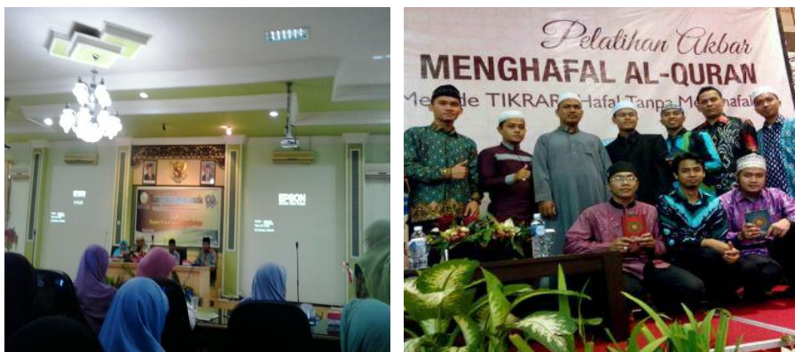
Gambar 4.9 Pelatihan Metode Menghafal Jarimatika (kiri) dan Tikrar (Kanan)