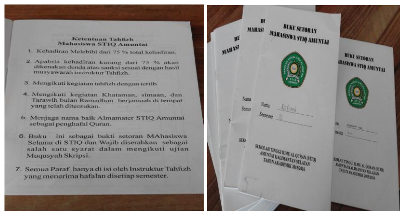
Gambar 4.3 Buku Setoran

Program tahfizhul Qur'an dilaksanakan oleh Sekolah Tinggi Ilmu Al-Quran (STIQ) yang dikelola oleh Pusat Pengembangan Tahfiz (PPT). Program ini diwajibkan kepada seluruh mahasiswa atau mahasiswi di sana, bahkan yang bukan mahasiswa atau mahasiswi di sana pun boleh mengikutinya.