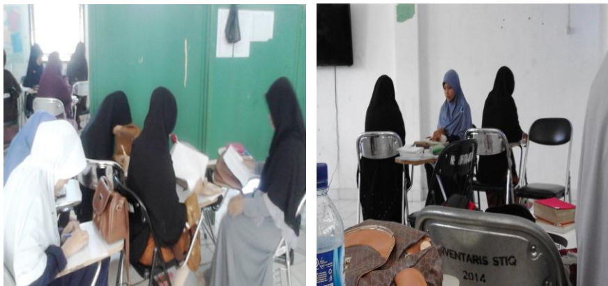
Gambar 4.6 Setoran Takrir

Pelaksanaan takrir di STIQ Amuntai dilakukan dengan mengulang atau memperdengarkan kembali hafalan yang pernah dihafal di hadapan instruktur. Takrir ini dilakukan mahasiswa ketika sudah selesai tahfizh sebanyak satu juz, sebelum meneruskan kepada materi/juz berikutnya, mahasiswa harus mentakrir hafalannya di depan instruktur, dan ini bisa dilakukan sekaligus satu juz, dibagi dua, atau dibagi empat.