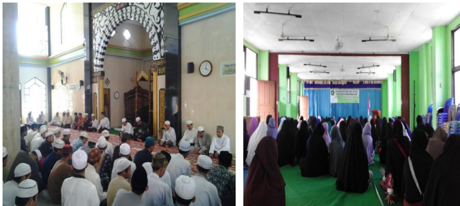
Gambar 4.10 Khataman Alquran

Khataman Alquran diadakan setelah kegiatan sima'an . Program ini dilakukan satu kali dalam satu bulan yang dilaksanakan di dalam kampus (Auditorium STIQ) Sedangkan kegiatan khataman di luar kampus STIQ Amuntai dilaksanakan dua kali setahun, seperti di Mesjid Raya At-Taqwa Amuntai (untuk mahasiswi) dan di tempat-tempat ibadah seperti mesjid, langgar dan mushalla luar kabupaten Hulu Sungai Utara (untuk mahasiswa).