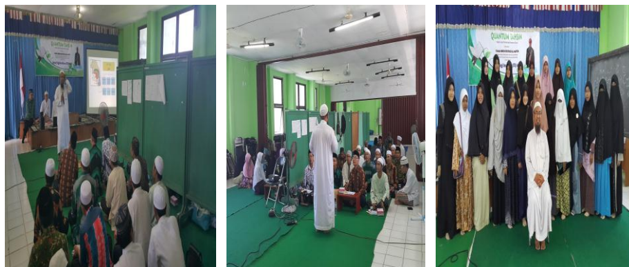
Gambar 4.8 Training atau Pelatihan Quantum Tahsin