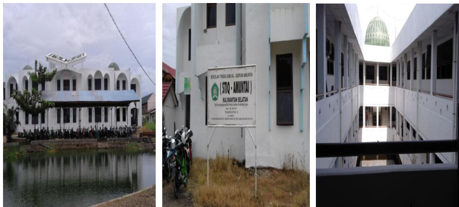
Gambar 4.1 Sekolah Tinggi Ilmu Alquran (STIQ) Amuntai

Pendirian Sekolah Tinggi Ilmu Alquran (STIQ) Amuntai adalah satu karya monumental hasil Musabaqah Tilawatil Quran (MTQ) XXI Tingkat Provinsi Kalimantan Selatan di Amuntai Tahun 2000. Di tengah meriahnya acara ini, muncullah inspirasi dan ide untuk melanggengkan dan mengembangkan kegiatan-kegiatan MTQ tersebut seperti tahfizh dan tilawah dan menjadikan syi'ar Alquran sebagai lambang kota Amuntai, dan berangkat dari gagasan itulah muncul ide untuk mendirikan sebuah lembaga khusus yang berdedikasi untuk mengembangkan dan mensosialisasikan ilmu-ilmu Alquran yang kemudian disebut “Sekolah Tinggi Ilmu Alquran”.