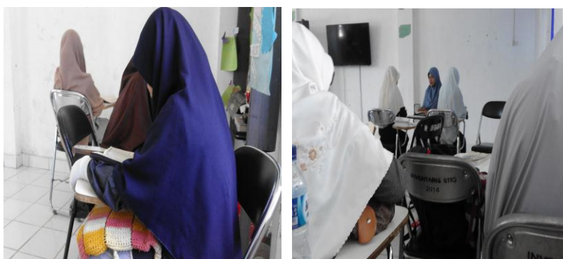
Gambar 4.5 Setoran Tahfizh

Mahasiswi memulai setoran tahfizh setelah mendapat rekomendasi dari instruktur tahsin . Yakni menyetor hafalan surah dan ayat yang belum pernah dihafal