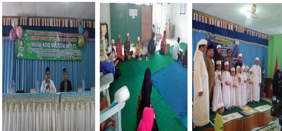
Gambar 4.12 Milad STIQ Amuntai

Milad STIQ biasanya dilaksanakan satu tahun sekali dalam rangka memperingati berdirinya Sekolah Tinggi Ilmu Al-Quran (STIQ) Amuntai. Kegiatan ini diikuti oleh mahasiswa/i dan pelajar-pelajar wilayah Kabupaten Hulu Sungai Utara mulai tingkat Sekolah Dasar (SD)/Madrasah Ibtidaiyah (MI)/sederajat hingga Sekolah Menengah Atas (SMA)/Madrasah Aliyah (MA)/sederajat. Tujuannya yakni