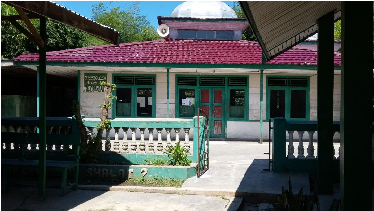
Gambar 7. Mushola MTsS NU Haruyan