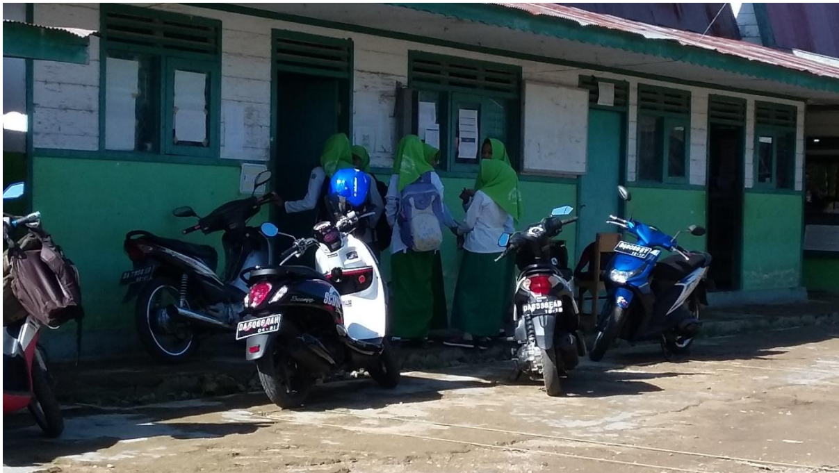
Gambar 3. Ruang Tata usaha, Ruang UKS, dan Tempat Fotocopy