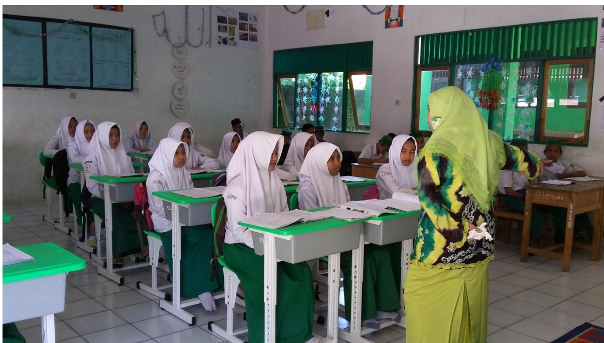
Gambar 10. Kegiatan pembelajaran