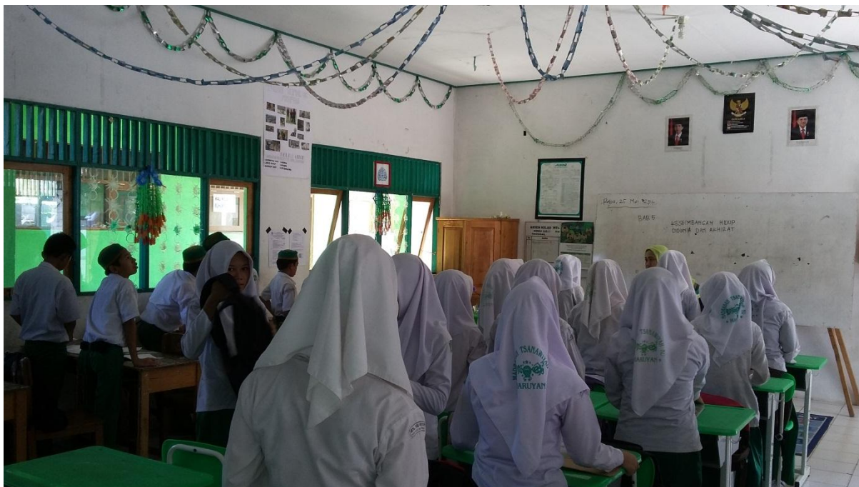
Gambar 9. Kegiatan awal pembelajaran (guru memberi salam)