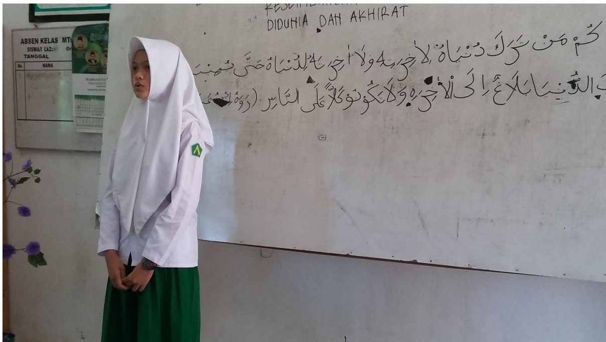
Gambar 13. Siswa ditugaskan menghafal hadis di depan kelas