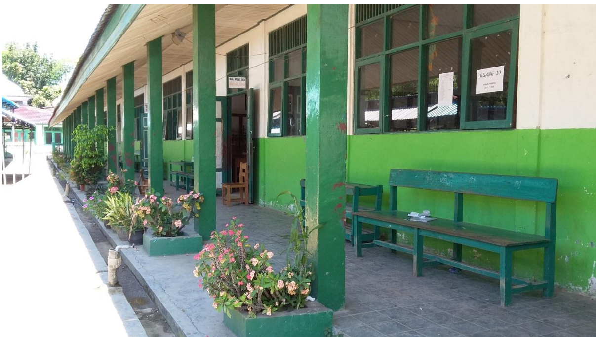
Gambar 8. Suasana depan kelas