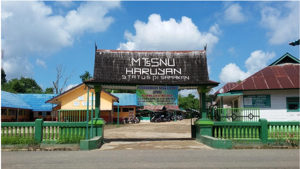
Gambar 1. Gerbang MTsS NU Haruyan