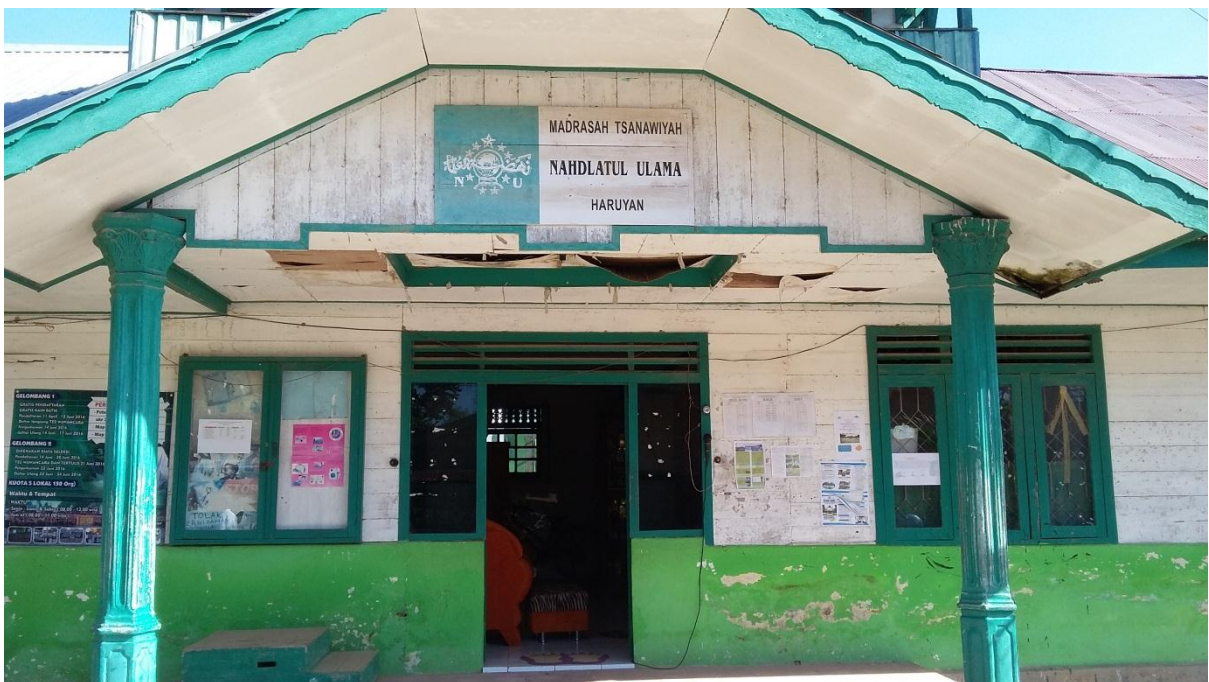
Gambar 2. Kantor Kepala Sekolah