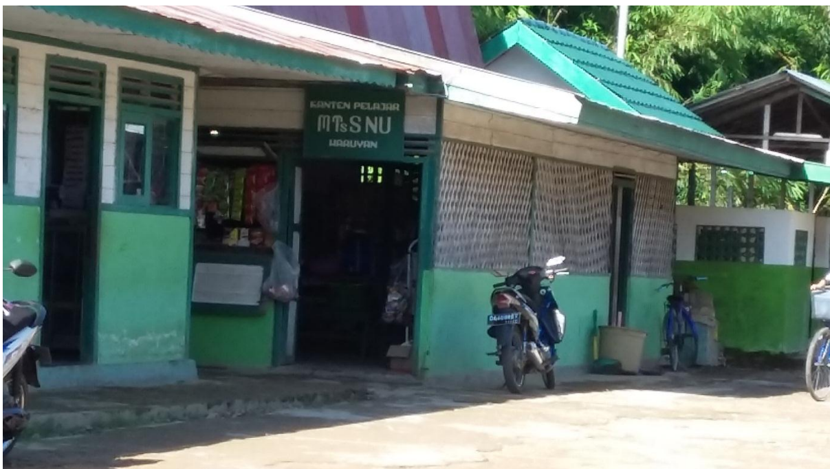
Gambar 4. Kantin MTs NU Haruyan