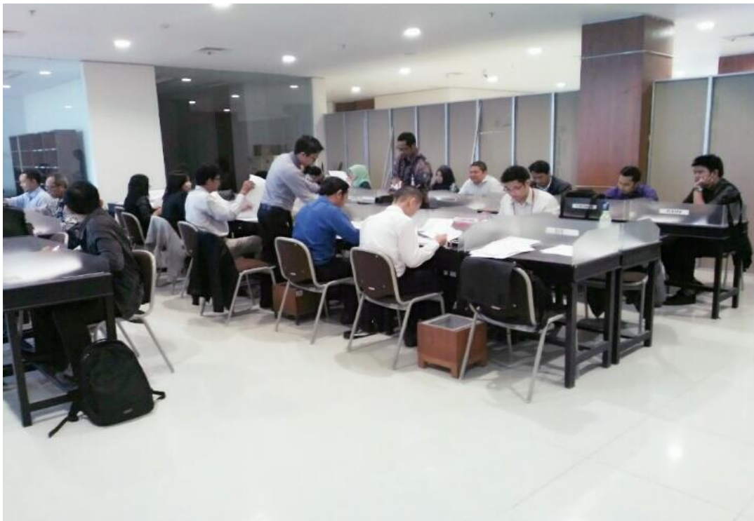
Kegiatan pertukaran warkat debit pada kliring debit oleh peserta kliring Kalimantan Selatan (36 Bank Umum)