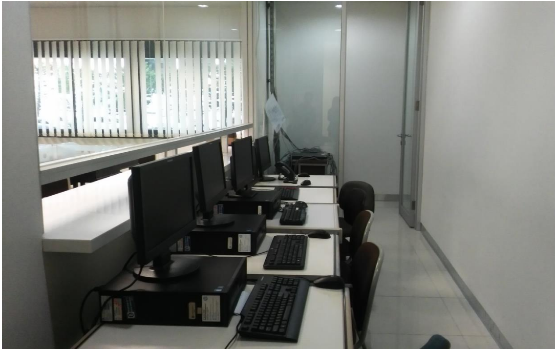
Fasilitas Guest Bank di Kantor Perwakilan Bank Indonesia Provinsi Kalimantan Selatan (2 Komputer dari depan)