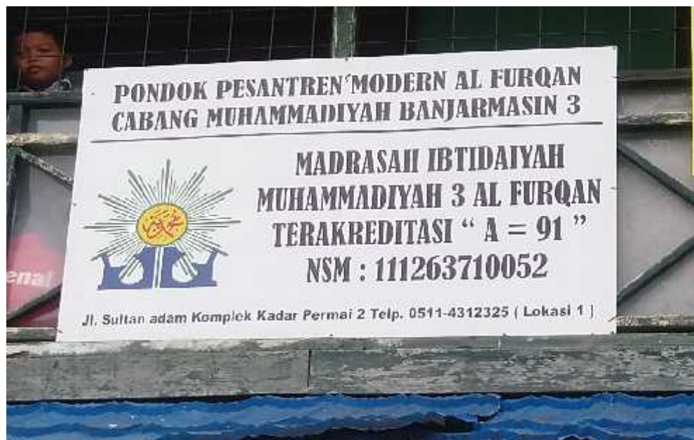
Gambar 4.1 Papan Nama MIM 3 Al Furqan Banjarmasin

Madrasah Ibtidaiyah Muhammadiyah 3 Al Furqan berlokasi di Jl. Sultan Adam Komplek Kadar Permai II Ujung Kecamatan Banjarmasin Utara Kota Banjarmasin.