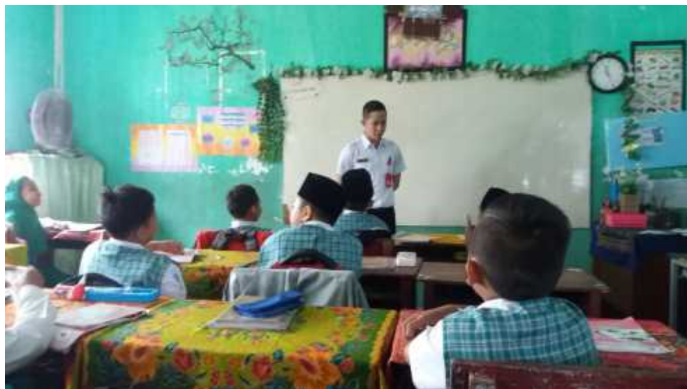
Gambar 4.4 Guru menjelaskan tentang cakupan materi yang akan dipelajari