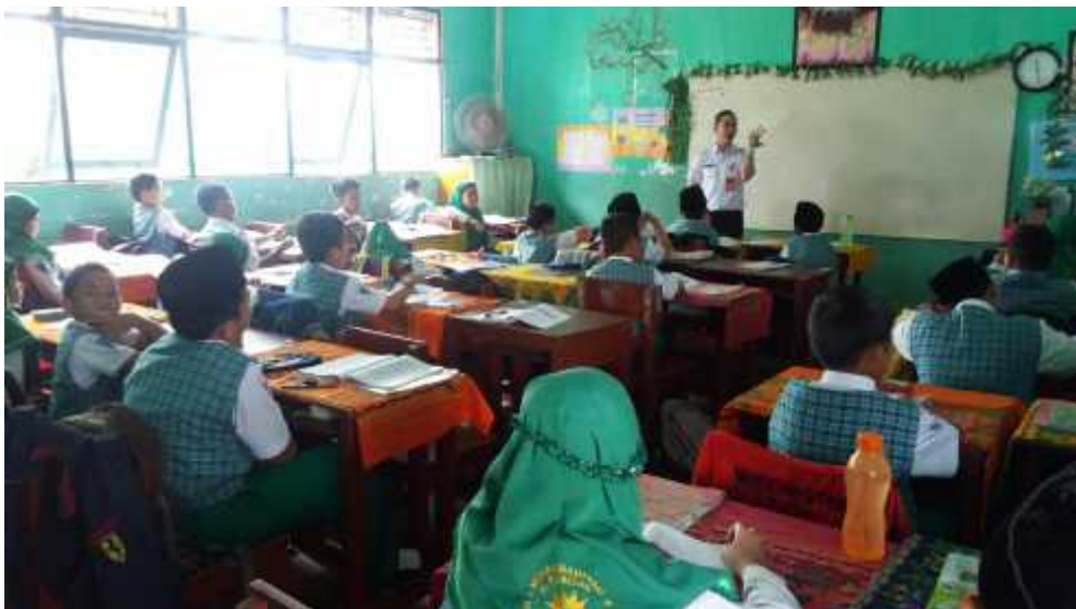
Gambar 4.5 Guru menjelaskan materi pokok yang dipelajari

sampai jawaban yang diberikan siswa dianggap benar. Dan guru meminta agar siswa untuk mendengarkan pendapat temannya. Dari kegiatan ini, guru membiasakan siswa untuk memiliki karakter mandiri, percaya diri, kerjasama dan saling menghargai. Setelah beberapa siswa menjawab dan menyampaikan pendapatnya, barulah guru memberi kesimpulan atas seluruh jawaban siswa. Dan guru memberikan pemahaman bahwa kegiatan yang telah dilakukan tadi menunjukkan pentingnya bekerjasama, yang awalnya hanya mengetahui sedikit pengertian mengenai izhar, lama-kelamaan mengetahui arti izhar secara keseluruhan.