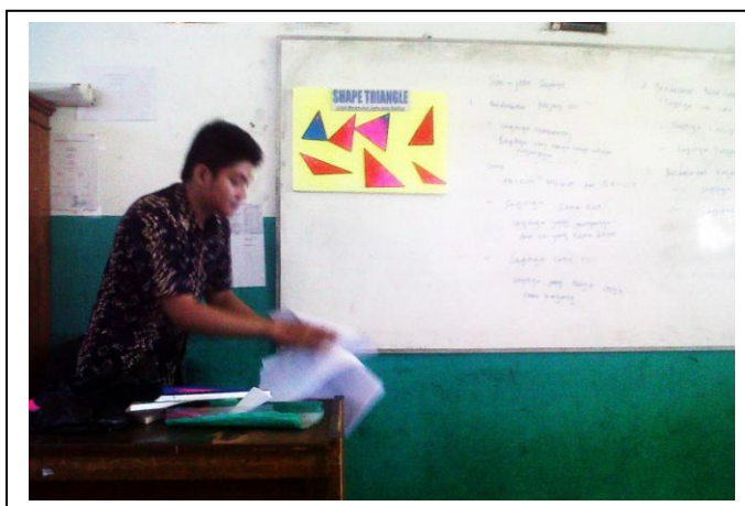
Gambar 4.2. Penyajian materi dengan alat peraga

Pada pertemuan ini peneliti menyiapkan alat peraga daerah segitiga dan macamnya, alat peraga ini memiliki manfaat agar peserta didik dapat menemukan konsep segitiga dan bidang segitiga, segitiga sembarang, segitiga lancip, segitiga siku-siku, segitiga tumpul, segitiga sama kaki, segitiga sama sisi, segitiga tumpul sama kaki dan segitiga siku-siku sama kaki dan sifat-sifatnya. Alat peraga tersebut digunakan pada pertemuan pertama untuk materi pengertian segitiga dan jenis-jenis segitiga. Cara penggunaan alat peraga ini adalah dengan menyiapkan papan gabus berbentuk persegi panjang sebagai alas untuk menempel alat peraga daerah segitiga dan macamnya, satu persatu bentuk segitiga ditempel dipapan gabus kemudian guru melibatkan siswa untuk menghitung panjang sisi dan besar sudut pada bentuk segitiga tersebut. Kemudian menyimpulkan secara bersama-sama jenis segitiga apa yang ada pada bentuk segitiga tersebut.