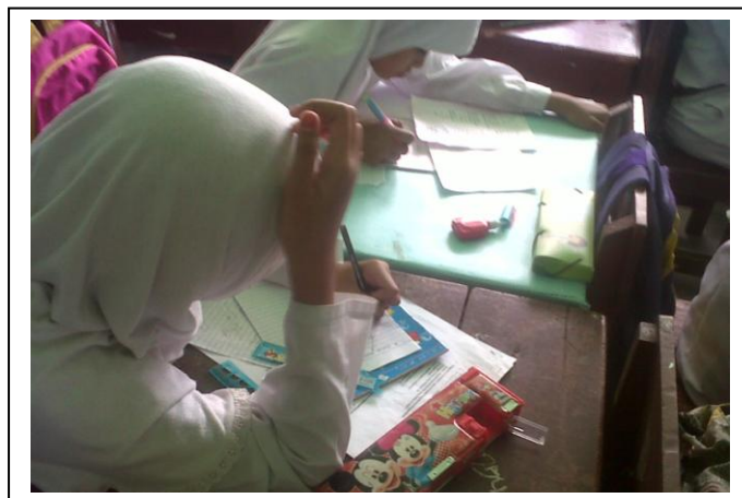
Gambar 4. 7. Aktivitas siswa saat mengerjakan tes formatif di kelas eksperimen

Setelah kegiatan inti selesai, peneliti bersama siswa menyimpulkan materi yang telah dipelajari. Kemudian guna mengetahui perkembangan peningkatan pengetahuan mereka terhadap materi yang telah dipelajari diadakan tes formatif pada setiap akhir pertemuan. Dalam mengerjakan tes formatif, setiap siswa tidak boleh saling membantu satu sama lain. Keberhasilan pelaksanaan pembelajaran sangat ditentukan oleh kesuksesan siswa dalam mengerjakan tes formatif tersebut.