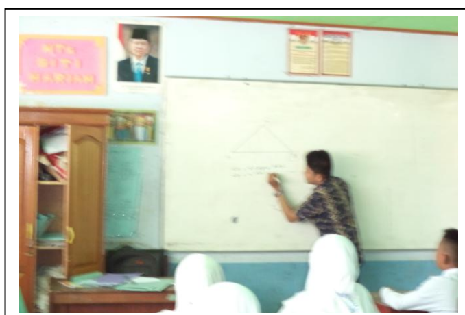
Gambar 4. 6. Penyajian materi di kelas kontrol tanpa alat peraga

Pada bagian ini berbeda halnya dengan di kelas eksperimen peneliti menjelaskan materi tanpa menggunakan alat peraga. Selama proses ini berlangsung siswa sangat antusias mengikuti pelajaran, hampir semua siswa memperhatikan penjelasan dari peneliti. Setelah selesai menyajikan informasi, peneliti mengadakan tanya jawab dengan siswa untuk mengetahui pemahaman siswa terhadap materi yang telah disampaikan dan peneliti memberikan kesempatan yang sama kepada setiap siswa untuk bertanya.