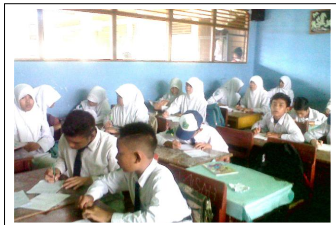
Gambar 4. 3. Aktivitas siswa saat mengerjakan tes formatif di kelas eksperimen

Setelah kegiatan inti selesai, peneliti bersama siswa menyimpulkan materi yang telah dipelajari. Kemudian guna mengetahui perkembangan peningkatan pengetahuan mereka terhadap materi yang telah dipelajari diadakan tes formatif pada setiap akhir pertemuan. Dalam mengerjakan tes formatif, setiap siswa tidak boleh saling membantu satu sama lain. Keberhasilan pelaksanaan pembelajaran sangat ditentukan oleh kesuksesan siswa dalam mengerjakan tes formatif tersebut.