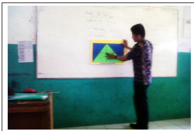
Gambar 4.5. Peneliti menjelaskan materi menggunakan alat peraga