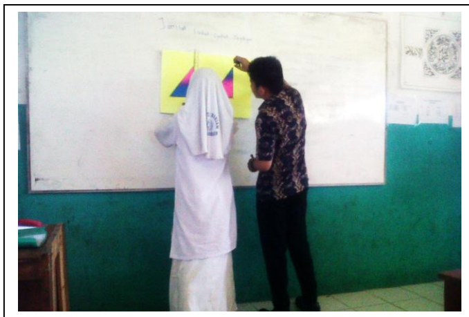
Gambar 4.4. Peneliti melibatkan siswa dalam penggunaan alat peraga

kembali potongan-potongan sudut menggunakan busur dan menjumlahkannya.