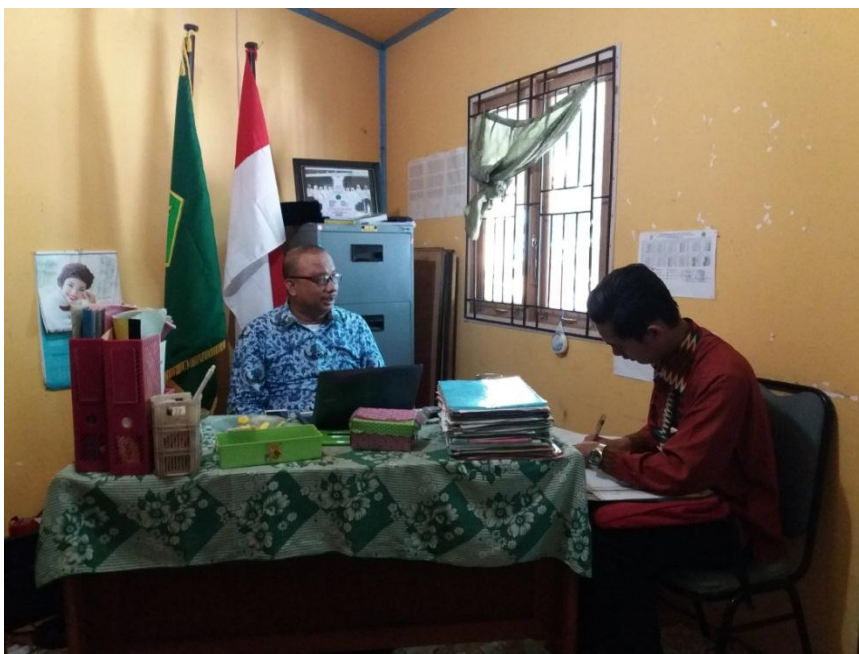
Wawancara dengan kepala madrasah MI TPI Keramat Banjarmasin