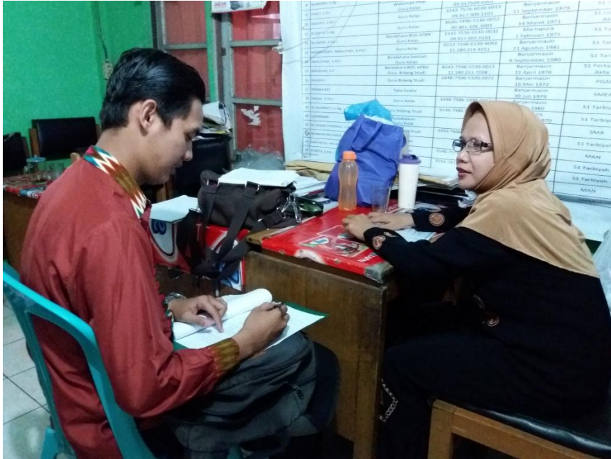
Wawancara dengan guru mata pelajaran sejarah kebudayaan Islam