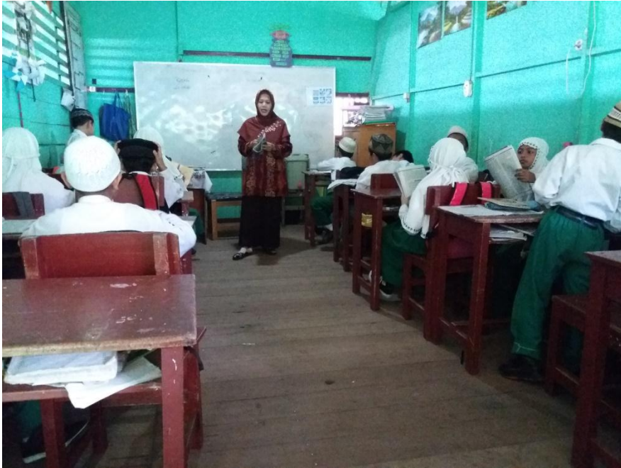
Perpindahan posisi guru