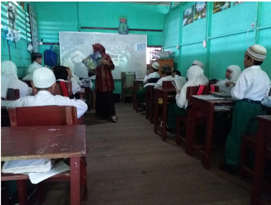
Pola interaksi dua arah