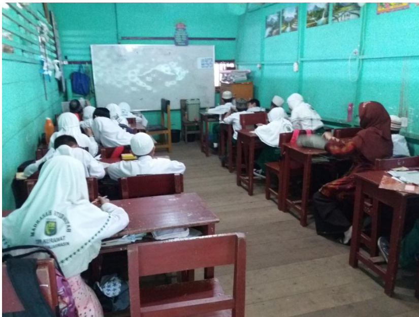
Pola interaksi multi arah, guru dan peserta didik mendengarkan salah satu peserta didik yang bercerita di tempat duduk saja