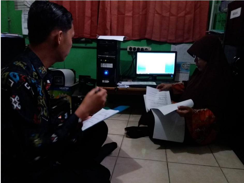
Wawancara dengan kepala staf tata usah MI TPI Keramat Banjarmasin