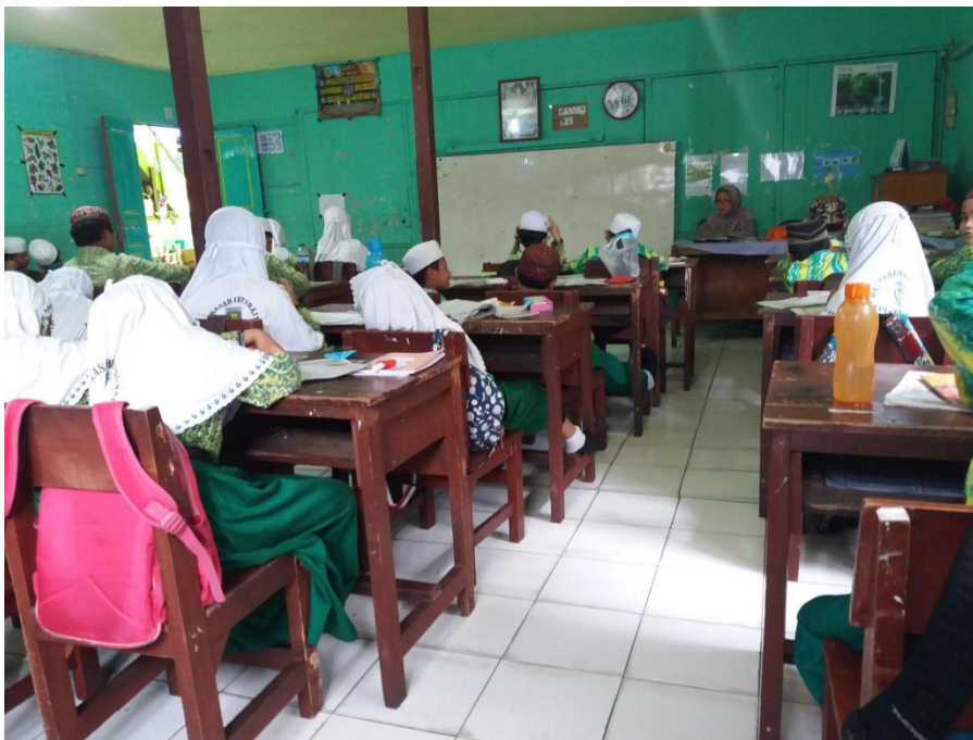
Proses pembelajaran sejarah kebudayaan Islam menggunakan variasi suara