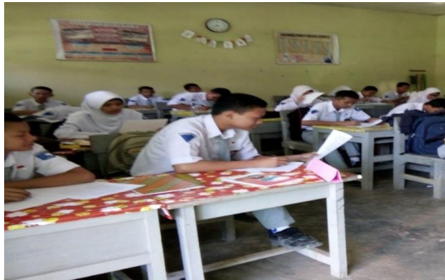
Gambar 4.1. Uji Kemampuan Awal

perkembangan peningkatan pengetahuan mereka terhadap materi yang akan dipelajari.