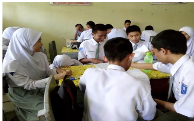
Gambar 4.4. Membahas Latihan Soal