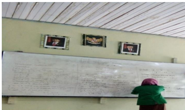
Gambar 4.2. Penyajian Materi

Guru menyajikan informasi tentang materi SPLKDV dengan rencana pelaksanaan pembelajaran yang telah dibuat disertai dengan memberikan contoh-contoh soal dan cara penyelesaian. Setelah selesai menyajikan informasi, guru mengadakan tanya jawab dengan siswa untuk mengetahui pemahaman terhadap materi yang telah diberikan, dan memberikan kesempatan yang sama kepada setiap siswa untuk bertanya siswa bertanya dengan antusias.