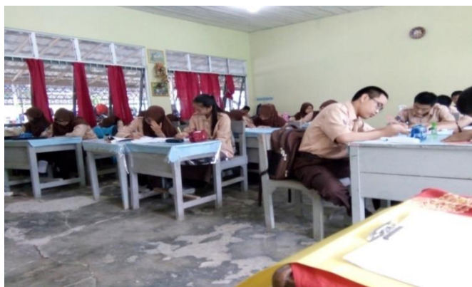
Gambar 4.12. Latihan Soal

Guru memberikan latihan soal kepada siswa, untuk mengetahui sampai mana pemahaman dan pengetahuan mereka. Latihan soal dikerjakan dengan perorangan tidak bersama-sama.