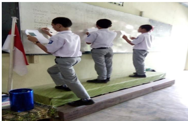
Gambar 4.5. Presentasi Hasil Latihan Soal