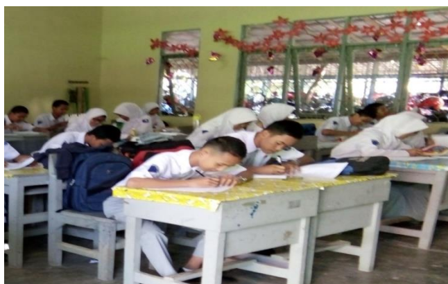
Gambar 4.6. Uji Kemampuan Akhir

Tahapan terakhir dari proses pembelajaran ini adalah mengadakan pos tes guna mengetahui perkembangan peningkatan pengetahuan mereka terhadap materi yang telah dipelajari disetiap akhir pertemuan. Dalam mengerjakan pos tes, setiap siswa tidak boleh saling membantu satu sama lain.