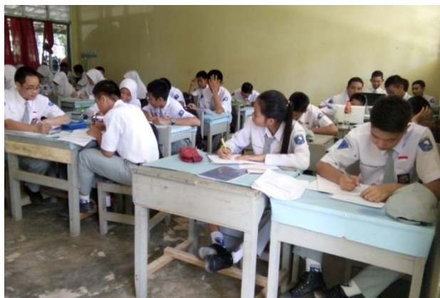
Gambar 4.7. Uji Kemampuan Awal

Pretest dilakukan pada tanggal 22 Agustus 2016 penelitian ini bertujuan untuk mengetahui hasil belajar matematika siswa kelas X IPA 1 SMAN 1 Simpang Empat. Sebelum melakukan pembelajaran dengan menggunakan model PBI, terlebih dahulu siswa diberikan pretest guna mengetahui perkembangan peningkatan pengetahuan mereka terhadap materi yang akan dipelajari.