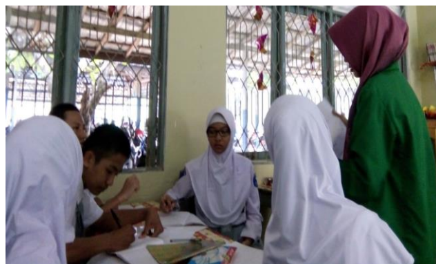
Gambar 4.9. Penyajian Materi

Guru menyajikan suatu permasalahan yang berkaitan dengan materi sistem persamaan linear dan kuadrat dua variabel, materinya yang sudah tercantum pada LKS yang telah dibagikan kepada seluruh siswa. Guru memantau kerja kelompok siswa, mendorong siswa untuk mengumpulkan informasi dan mengadakan tanya jawab dengan siswa untuk mengetahui pemahaman terhadap materi yang telah diberikan, dan memberikan kesempatan yang sama kepada setiap siswa untuk bertanya.