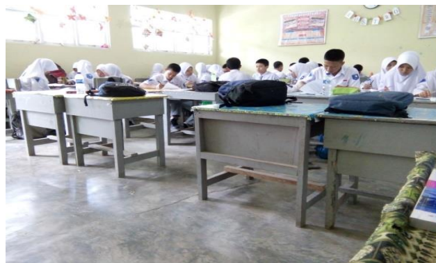
Gambar 4.3. Latihan Soal

Tahapan selanjutnya adalah pemberian latihan soal, dalam hal ini guru memberikan beberapa latihan soal sesuai materi yang telah disajikan kepada seluruh siswa kemudian mereka mengerjakan secara perorangan. Setelah memberikan waktu secukupnya untuk mengerjakan latihan soal tersebut, guru mempersilahkan kepada beberapa orang siswa untuk ke depan menuliskan hasil jawabannya. Setelah itu dibahas secara bersama-sama.