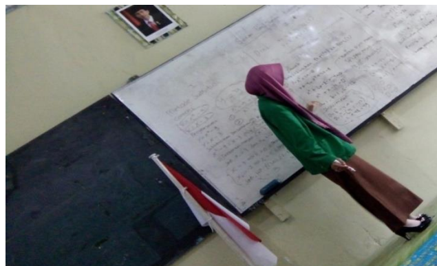
Gambar 4.11. Membahas Hasil Presentasi Kelompok