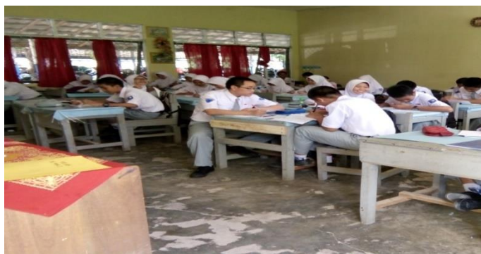
Gambar 4.13. Uji Kemampuan Akhir

Setelah melakukan pembelajaran matematika model problem based instruction , maka guna mengetahui perkembangan peningkatan pengetahuan mereka terhadap materi yang telah dipelajari diadakan pos tes pada setiap akhir pertemuan. Dalam mengerjakan pos tes, setiap siswa tidak boleh saling membantu satu sama lain. Keberhasilan kelompok sangat ditentukan oleh kesuksesan individu dalam mengerjakan pos tes tersebut.