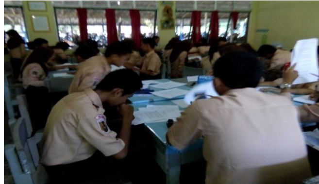
Gambar 4.8. Pembagian Kelompok

Guru membagi siswa menjadi beberapa kelompok. Guru memberikan arahan dalam belajar kelompok.