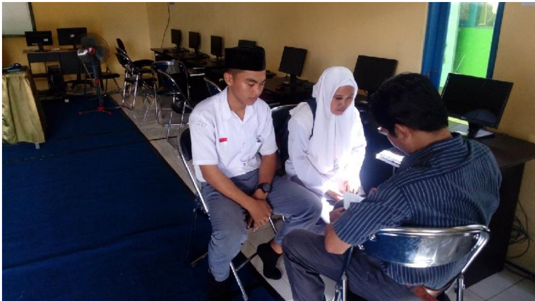
Gbr. 4.24. wawancara dengan Peserta didik