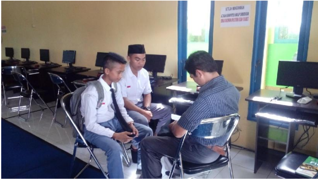
Gbr. 4.23. Wawancara dengan Peserta didik