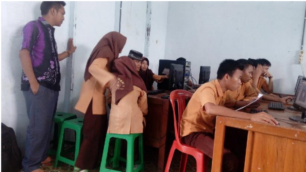
Gbr. 4.16. Peserta didik mengerjakan tugas secara kelompok