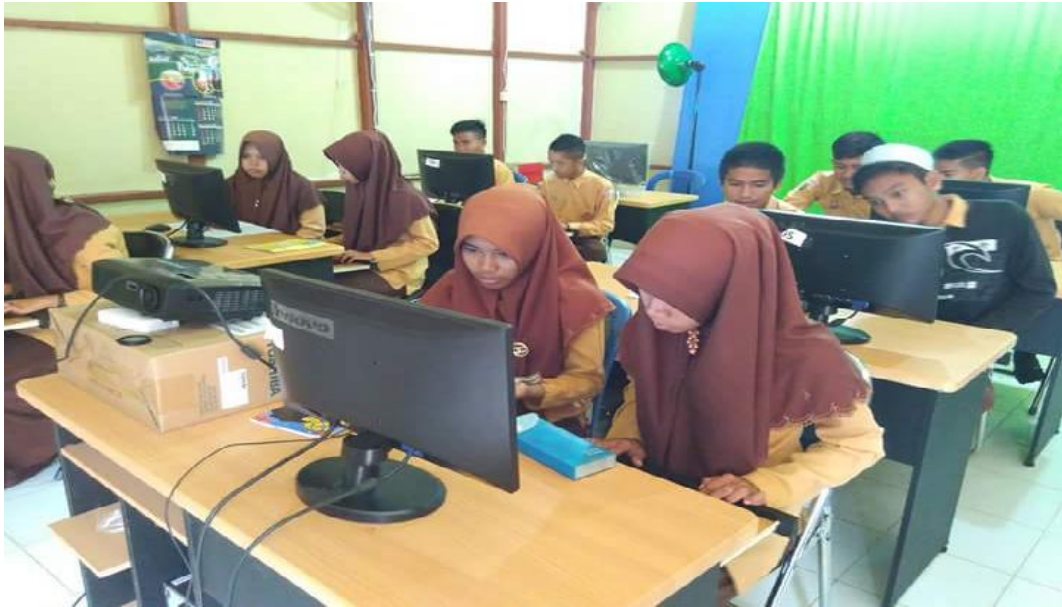
Gbr.4.27. Aktivitas Peserta didik