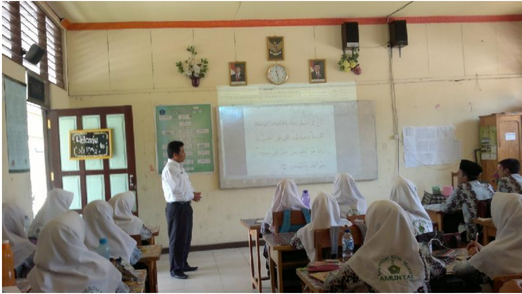
Gbr. 4.3 Guru Memberi Penjelasan dan Petunjuk Dan menampilkan ayat-ayat Alquran melalui powerpoint