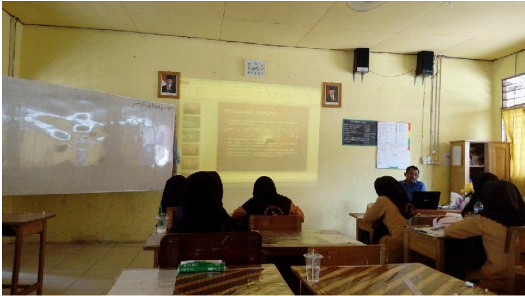
Gbr. 4.7 Bapak Musa melakukan pembelajaran dengan Tatap Muka Dengan menggunakan Powerpoint