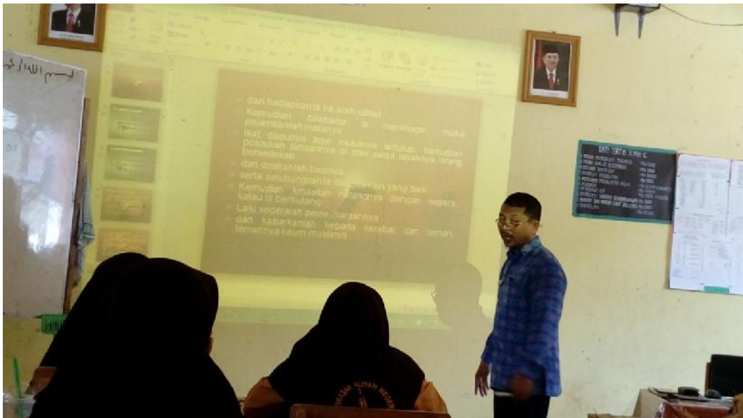
Gbr. 4.6 Guru Memberi Penjelasan dan Petunjuk