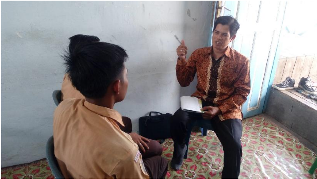
Gbr.4.29. Wawancara Dengan Siswa