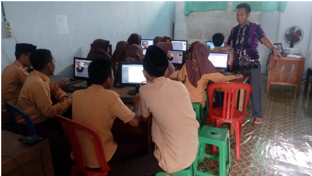
Gbr. 4.14. Bapak Saini Memberi Penjelasan dan Petunjuk kepada peserta didik