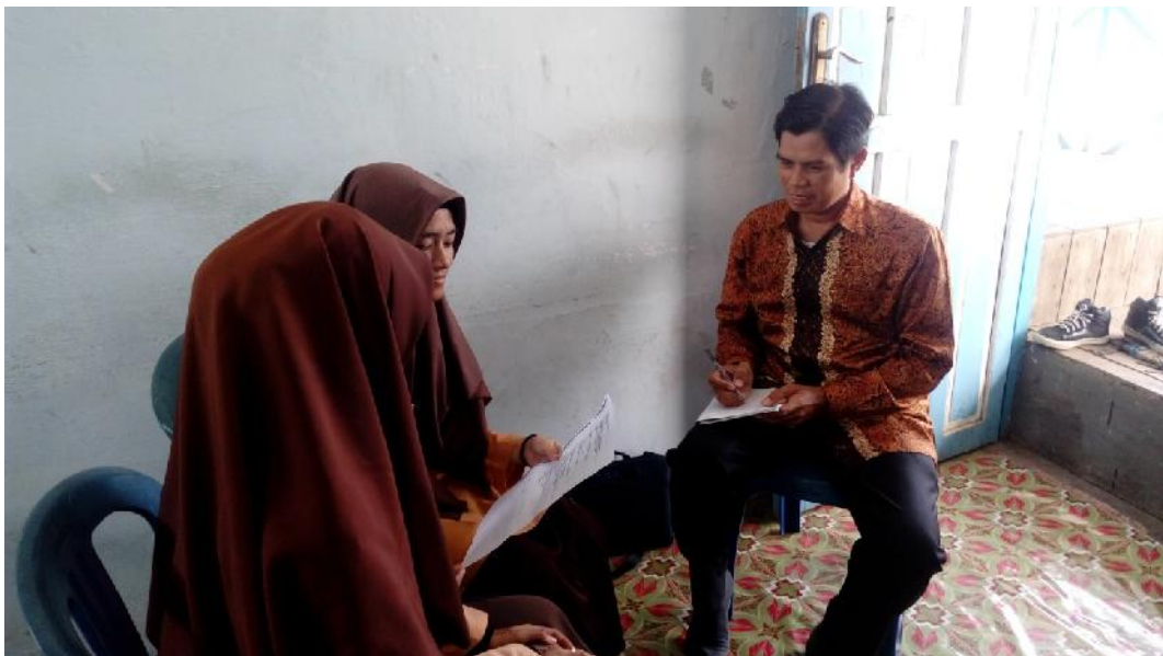
Gbr.4.30. Wawancara Dengan Siswa