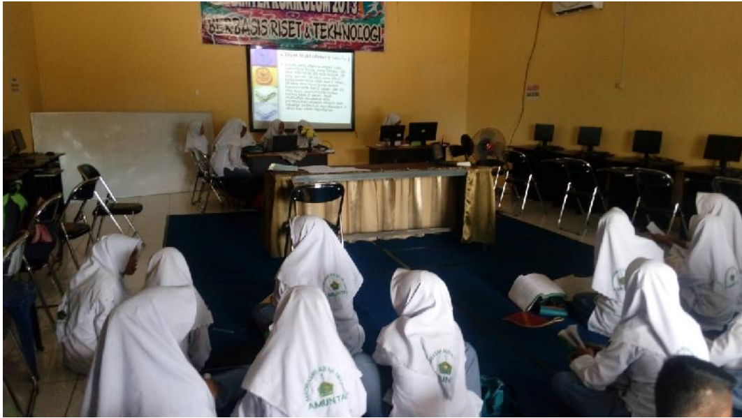
Gbr. 4.21. Presentasi oleh peserta didik dengan menggunakan Powerpoint