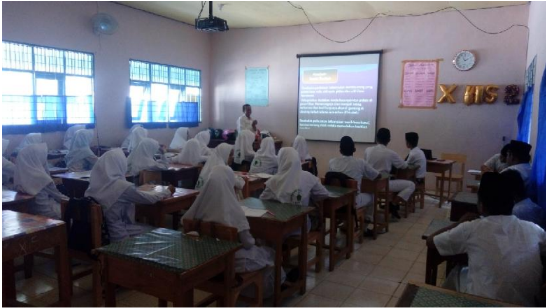
Gbr. 4.13 Guru Memberi Penjelasan dan Petunjuk