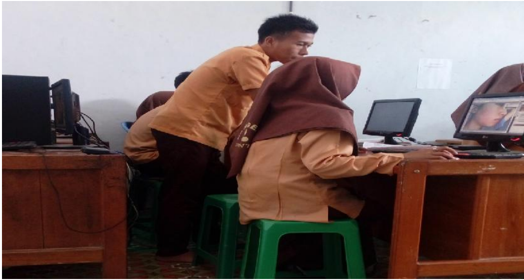
Gbr. 4.17. Peserta didik lain memberi petunjuk kepada temannya yang lain