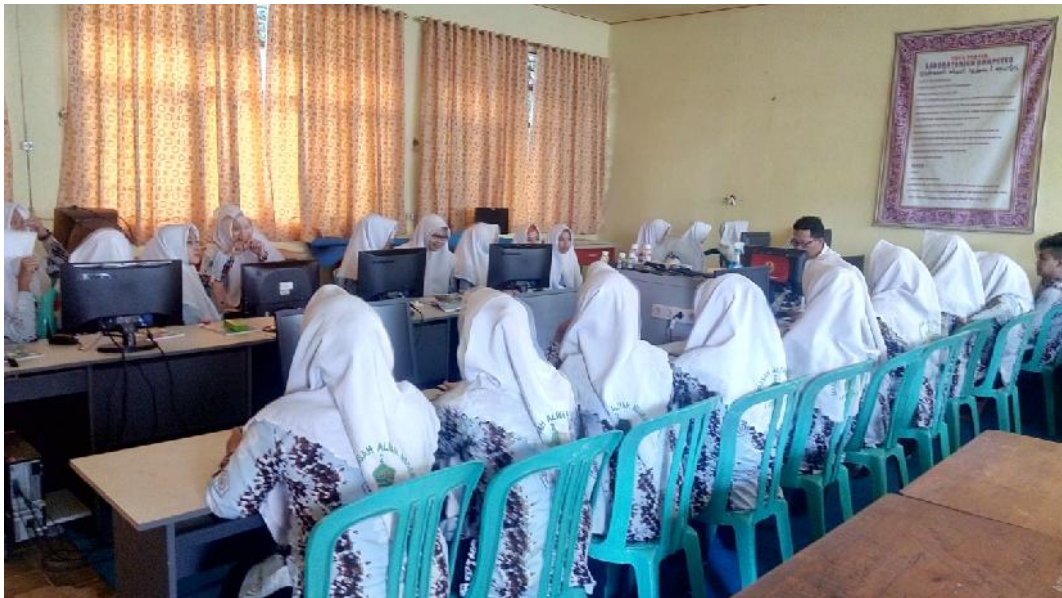
Gbr. 4.10. Peserta didik dan guru mengadakan pembelajaran di ruang laboratorium komputer