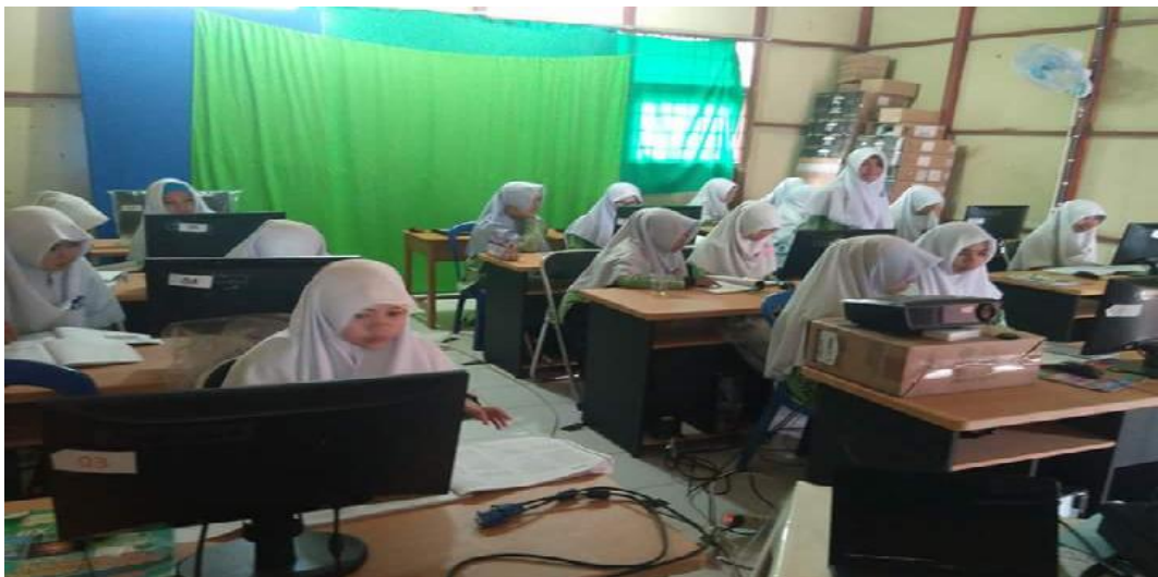
Gbr.4.26. Aktivitas Peserta didik