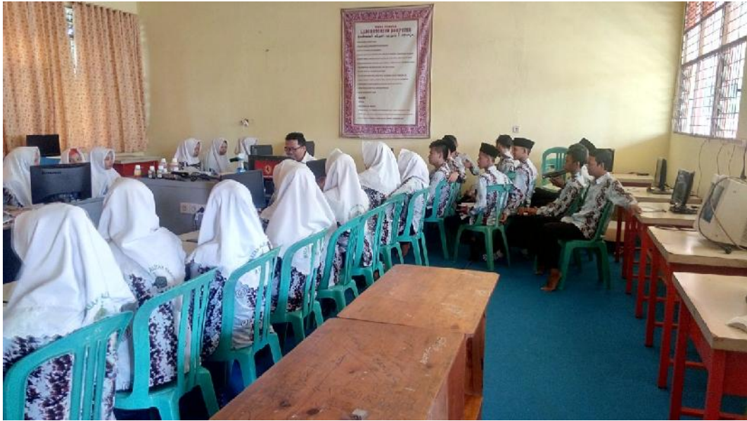
Gbr. 4.11 Guru memberi penjelasan dan arahan