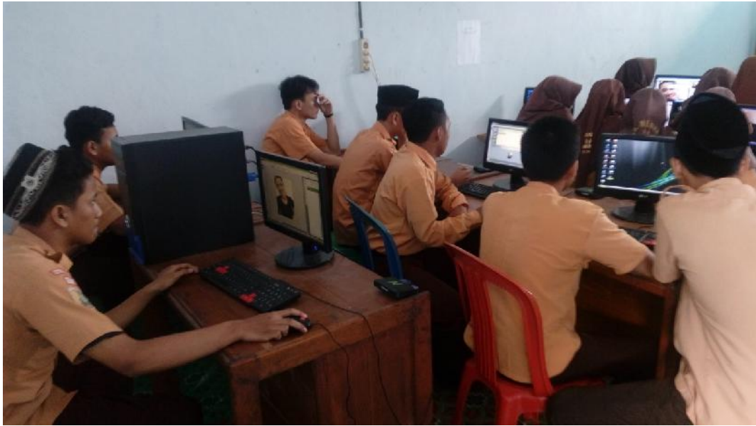
Gbr. 4.15. peserta didik mengerjakan tugas yang diberikan