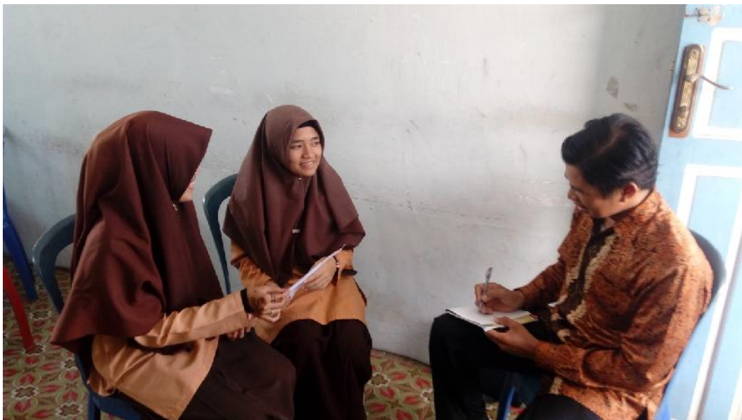
Gbr.4.28. Wawancara Dengan Siswa