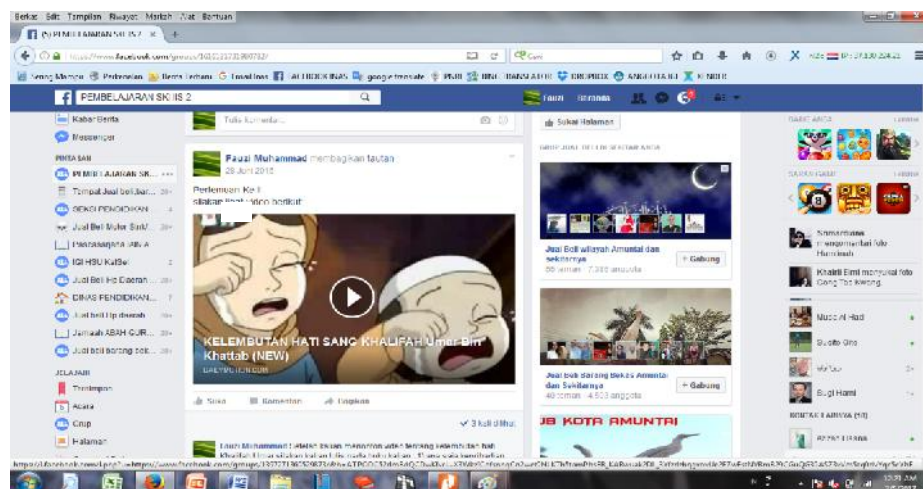
Gbr. 5.10. Penggunaan Facebook untuk pembelajaran

Tampilan gambar di atas maka dapat dilihat bahwa Bapak Muhammad Fauzi menampilkan video dengan diletakkan pada media sosial grup facebook. Dengan demikian peserta didik dapat melihat tampilan tersebut baik dengan komputer maupun dengan smartphone, sehingga perintah mengerjakan tugas yang diberikan guru yang ada di facebook dapat diketahui dan dipahami oleh peserta didik.