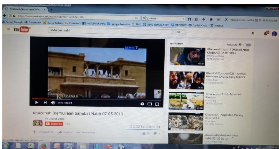
Gbr. 5.8. Tampilan video Youtube yang ditampilkan Bapak Norkansyah Kepada peserta didik

Penggunaan youtube oleh Bapak Norkansyah dapat dilihat dari gambar di bawah ini