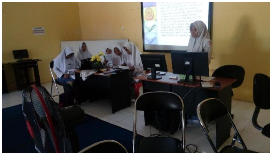
Gbr. 5.7. peserta didik mempresentasikan hasil pembuatan makalah Yang dikerjakan di rumah dan dipresentasikan di kelas

peserta didik tetapi masih dalam pemberian kontrol waktu, tempat dan lainnya dari guru 168 .