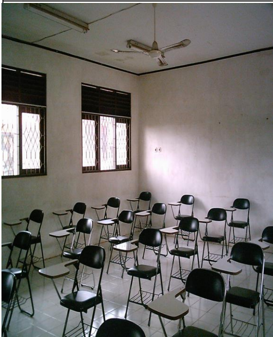
RUANG AUDIO VISUAL