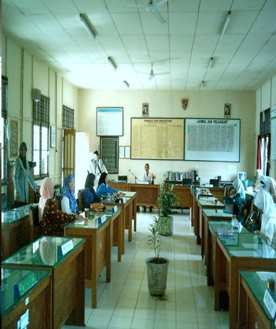
RUANG DEWAN GURU