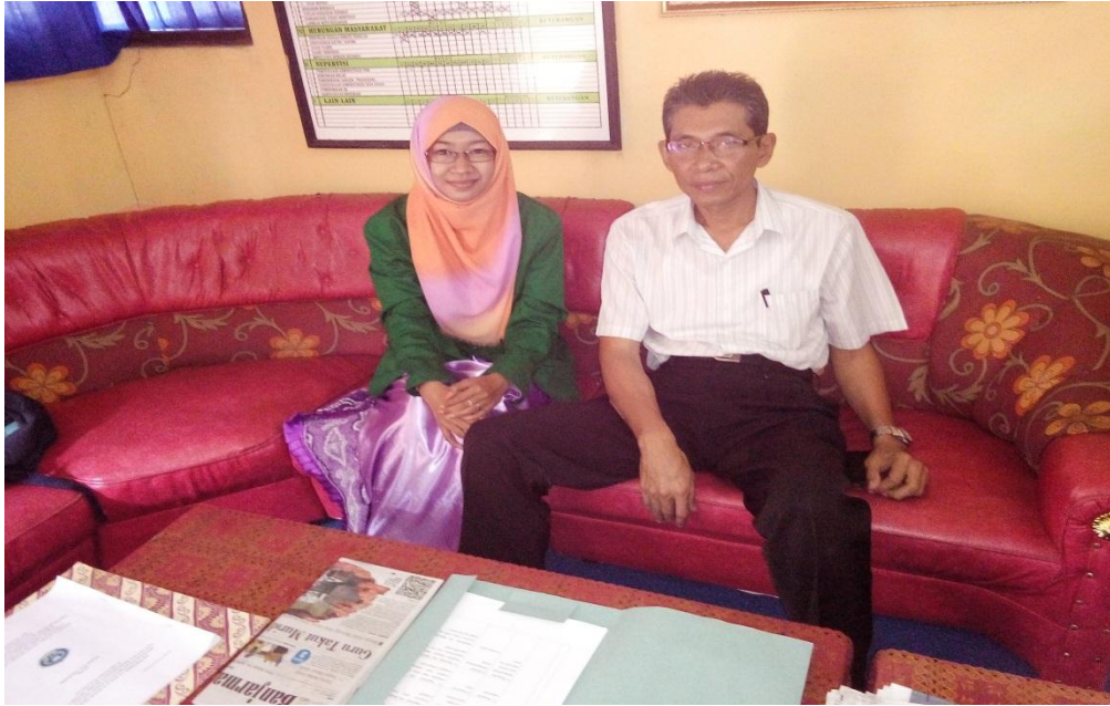
Foto Bersama Kepala Sekolah SMK Negeri 1 Paringin Kabupaten Balangan