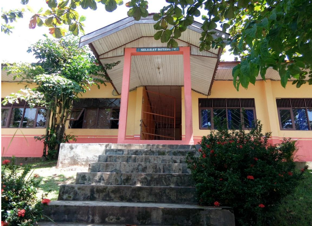
Ruang Belajar SMK Negeri 1 Paringin