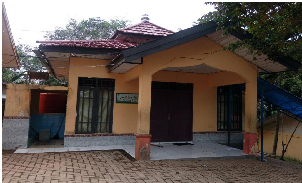
Musholla SMK Negeri 1 Paringin