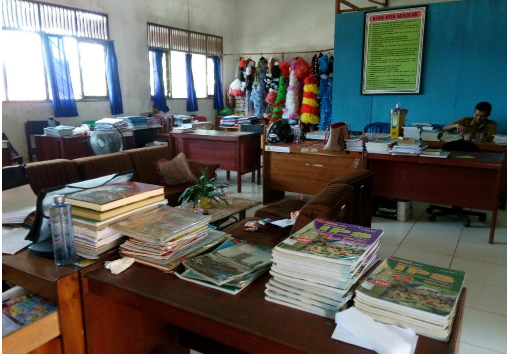
Kantor Guru SMK Negeri 1 Paringin