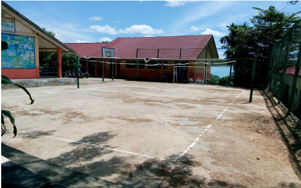
Lapangan Olahraga SMK Negeri 1 Paringin