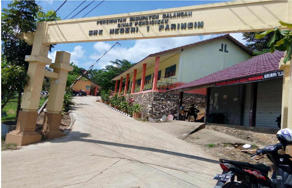
Gerbang SMK Negeri 1 Paringin Kabupaten Balangan