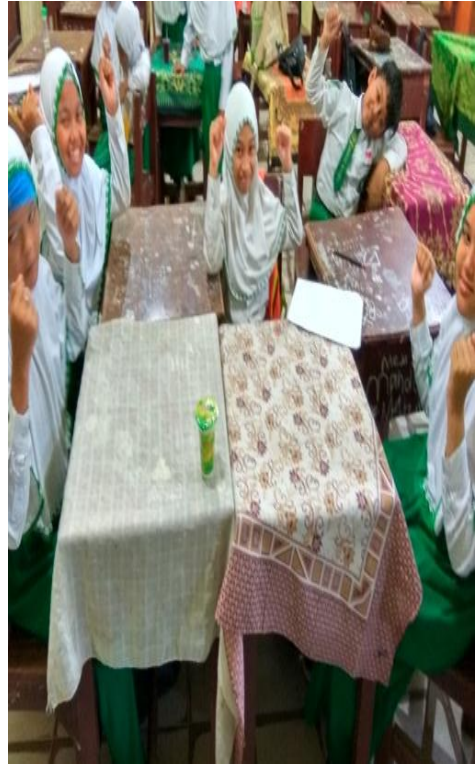
Pembelajaran di kelas eksperimen