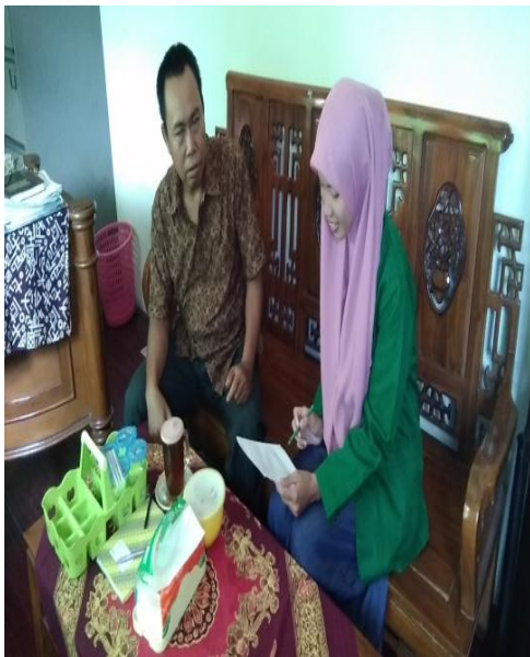
Wawancara dengan kepala sekolah