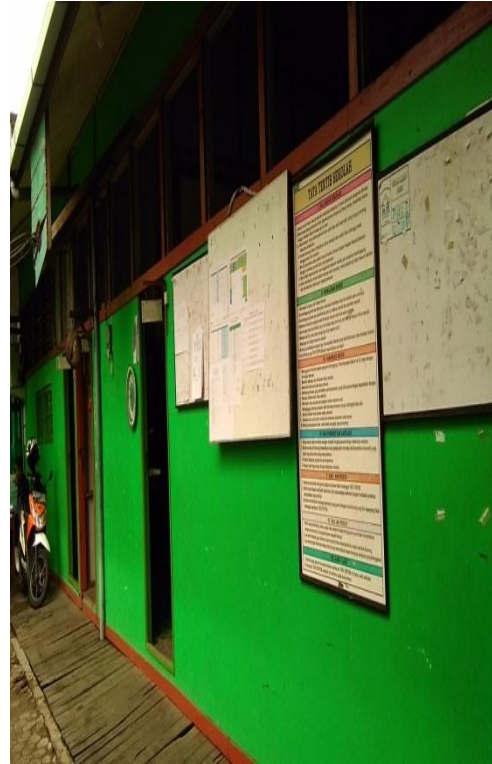
Gedung sekolah MIN Kebun Bunga Banjarmasin