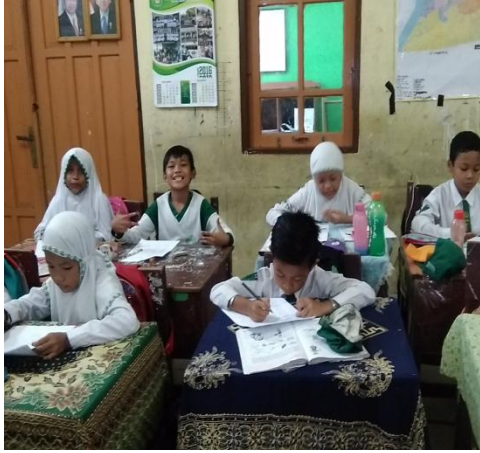
Pretest di kelas kontrol