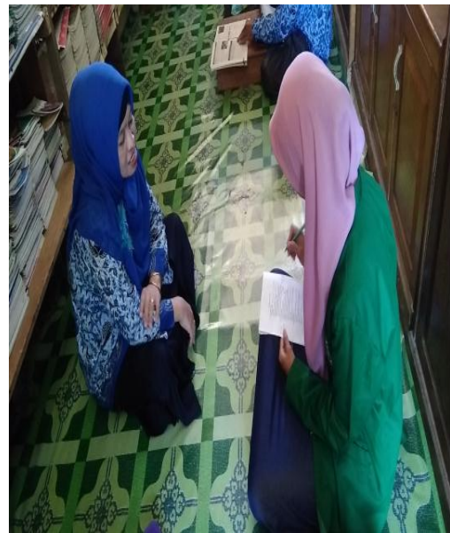
Wawancara dengan guru Matematika kelas IV