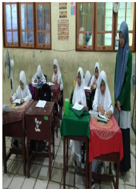
Postest di kelas eksperimen