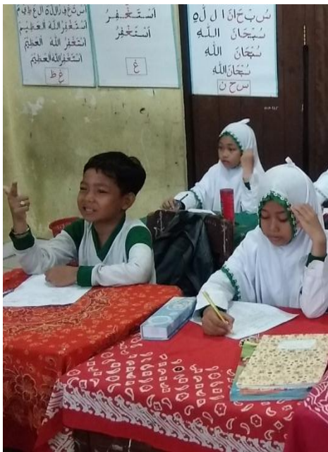
Postest di kelas kontrol