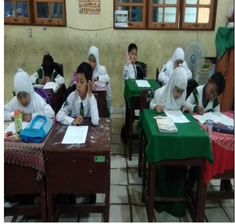
Pretest di kelas eksperimen