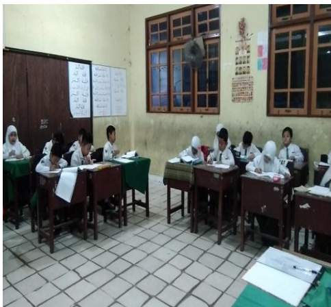
Pembelajaran di kelas eksperimen