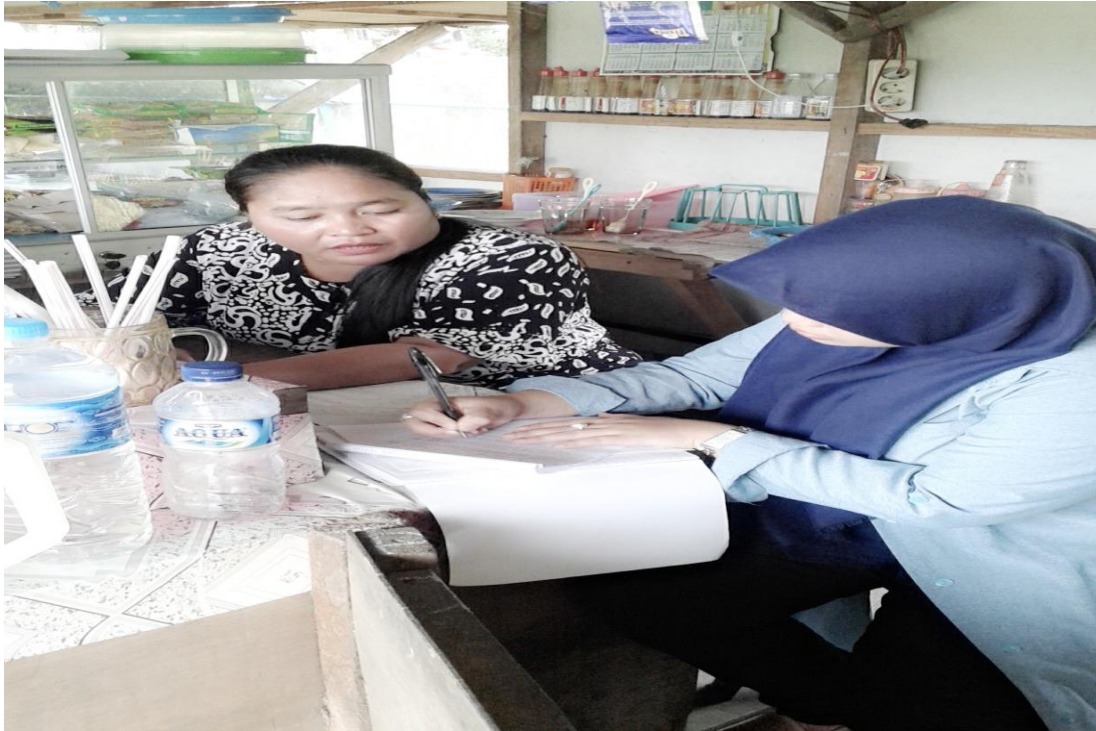
Photo Wawancara dan Observasi