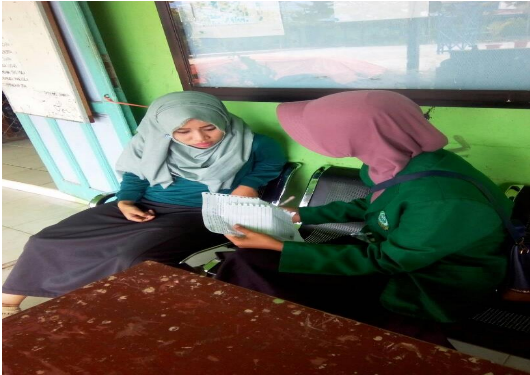
Foto saat wawancara dengan siswa