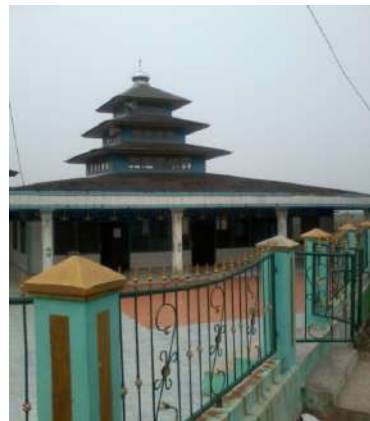
Masjid Al-Azhar di Desa Hiyung