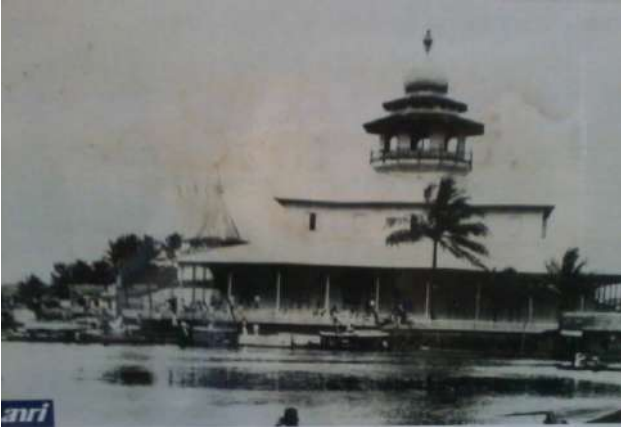
Masjid Negara di Banjarmasin yang terletak di tepi Sungai Martapura pada tahun 1930