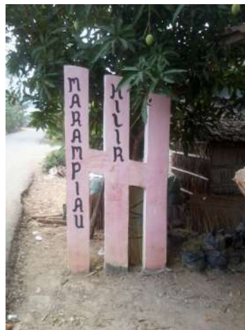
Papan nama-gerbang masuk Desa Marampiau Hilir Margasari