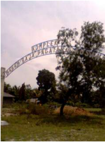
Pintu masuk kompleks makam Arung atau raja-raja Pagatan

Bukti sejarah eksistensi dan aktivitas penyebaran Islam di kawasan ini, setidaknya dapat dilihat dari bekas areal Kerajaan Pagatan, makam para Raja Pagatan, dan makam ulama yang berdakwah di Pagatan.