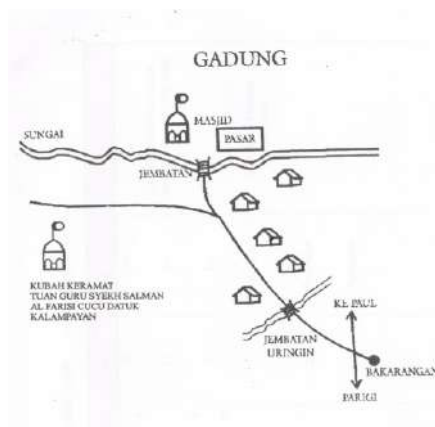
Peta Banua Gadung (dalam A Gazali Usman, 1999)

Kemudian, Islam juga masuk dan menembus daerah Banua Ampat yang lainnya, yakni Banua Gadung. Melalui lintasan Sungai Tapin yang mengalir dari Pergunungan Meratus dan bermuara di sungai besar Muara Muning, tepat melintasi di tengah-tengah desa atau Banua Gadung, sehingga menjadikan Banua Gadung yang mengenal sistem air pasang surut yang diatur oleh alam sebagai daerah yang subur dan di masa pemerintahan Kesultanan Banjar, merupakan wilayah strategis penyebaran Islam. Di samping sebagai daerah utama penghasil beras atau lumbung padi, Banua Gadung juga menjadi penghubung ke wilayah Balimau, Kandangan dan sekitarnya dalam proses penyebaran Islam di Kabupaten Hulu Sungai Selatan. Sementara, Sungai Tapin dan Sungai Gadung sendiri menghubungkan Banua Gadung dengan desa yang ada di sekitarnya, seperti Desa Balimau, Margasari, dan bahkan menjadi jalur utama untuk menuju ke Muara Bahan dan terus ke Banjarmasin. 47