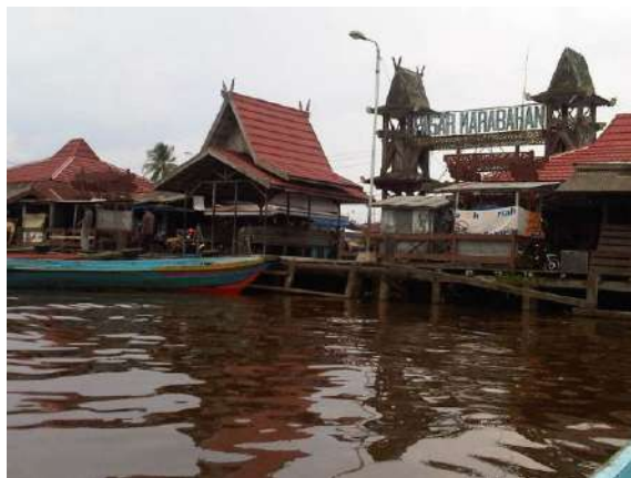
Pelabuhan-Dermaga Marabahan di pinggir Sungai Barito sekarang