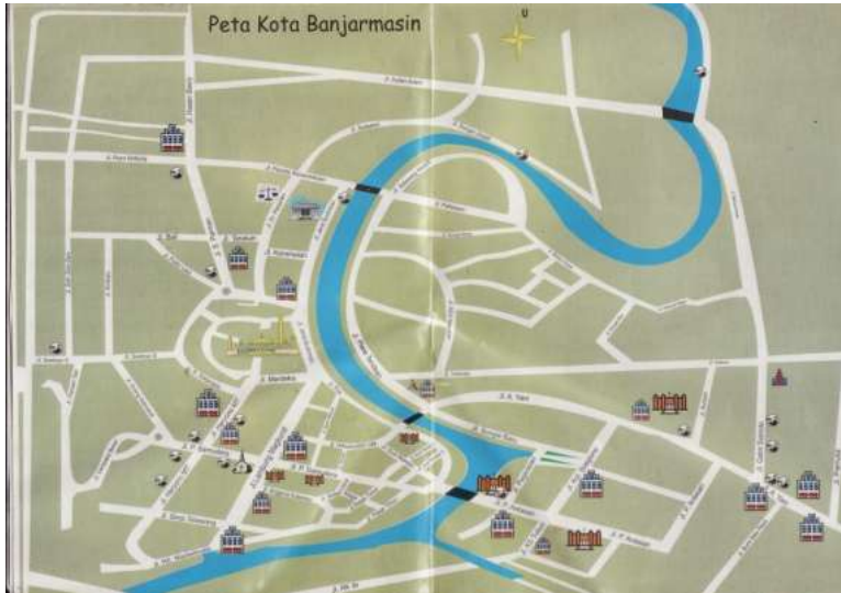
Peta Kota Banjarmasin

kebun dan sawah. Jumlah penduduk Banjarmasin pada waktu itu diperkirakan mencapai 15.000 orang setelah penduduk Daha di angkut ke ibu kota kerajaan.