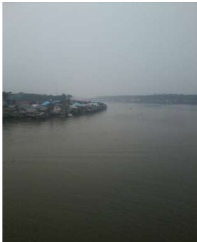
Kawasan yang diduga bekas Pelabuhan Muara Rampiau, sekarang menjadi permukiman padat penduduk

Di masanya, pelabuhan Muara Rampiau yang berada pada lokasi sangat strategis karena terletak di muara sungai yang merupakan titik pertemuan antar sungai dan antar pelayaran laut, memiliki peranan yang sangat penting terhadap perkembangan berbagai aspek kehidupan masyarakat Kerajaan Daha, tidak hanya dari segi ekonomi-perdagangan, tetapi juga politik, agama, dan kebudayaan, karena terbukanya daerah dan hubungan dengan dunia luar.