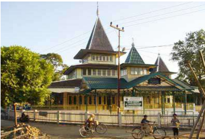
Masjid Al-Mukarramah di Banua Halat Rantau

Di antara bukti sejarah penyebaran Islam di Banua Halat adalah bangunan masjid keramat Al-Mukarramah yang terletak di Banua Halat. Masjid ini dibangun oleh Datu Pujung dan menjadi tonggak awal penyebaran Islam di Banua Halat dan sekitarnya. Hingga sekarang, bangunan masjid dengan atap tumpang ini menjadi pusat pelaksanaan tradisi Baayun Maulid yang setiap tahun dan saban bulan Maulid dilaksanakan oleh masyarakat Banjar. Menurut penuturan masyarakat Banua Halat, tradisi Baayun Maulid sudah dikenal oleh masyarakat Banua Halat sejak lama, seiring dengan masuk dan tersebarnya Islam (dari Banjarmasin) ke wilayah ini dan sekitarnya. Di samping itu, tradisi Baayun Maulid ini juga dianggap sebagai penanda penting konversi atau masuk Islamnya orang-orang Dayak Banua Halat ke dalam Islam, yang dalam tutur lisan mereka diawali oleh masuk Islamnya Intingan atau Palui Anum (Datu Pujung), yang dianggap sebagai nenek moyang orang-orang Banua Halat yang berjasa besar terhadap proses penyebaran Islam di kawasan ini.