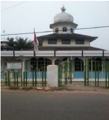
Masjid Baitun Nur di Desa Sungai Rutas

Tonggak awal sejarah penyebaran Islam dengan Pelabuhan Muara Rempiau sebagai pintu masuknya serta Margasari sebagai kawasan utama sebaran utama Islam juga dapat ditelusuri dari keberadaan masjid atau langgar-langgar (surau) tua berarsitektur awal perkembangan Islam yang umunya beratap tumpang di Margasari dan kampung-kampung awal sepanjang aliran sungai yang masih terawat dan terjaga hingga sekarang. Seperti halnya dengan Masjid Baiturrahim di Margasari yang merupakan masjid tertua di kawasan ini, Masjid Baitun Nur di Desa Sungai Rutas, Masjid Al Azhar di Desa Hiyung, dan lain-lain.