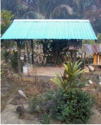
Makam Datu Ishaq bin Libana (1750 M) di Desa Baringin