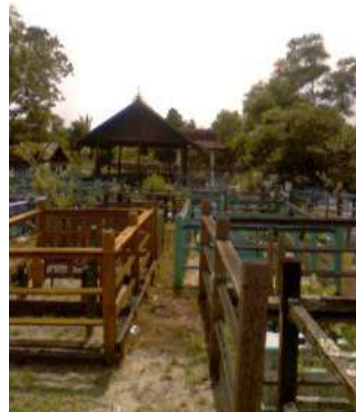
Komplek makam Arung atau raja-raja Pagatan