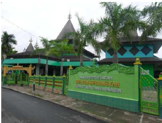
Masjid Sultan Suriansyah di pinggiran Sungai Kuin Banjarmasin

Pola perkampungan yang dibangun mengelompok di sepanjang pinggiran Sungai Kuin. Permukiman atau rumah-rumah dibangun secara berbanjar menghadap ke sungai. Bentuk rumah umumnya adalah rumah panggung dengan tiang dari ulin. Lantai dan dinding terbuat dari papan, atapnya dari sirap atau daun rumbia, dan antar rumah dihubungkan dengan titian yang terbuat dari kayu. Setiap rumah di tepian sungai tersebut memiliki batang, yaitu sejenis rakit yang terbuat dari kayu yang terapung atau bambu untuk tempat mandi dan mencuci, sekaligus tempat jamban serta dermaga kecil untuk tambatan perahu. 20 Tentu saja, pada setiap kampung biasanya terdapat sebuah langgar atau surau dan pada kampung yang agak besar biasanya terdapat masjid. Hubungan antar kampung dilakukan dengan menggunakan perahu. Selain itu, terdapat pasar sebagai tempat terjadinya transaksi jual-beli kebutuhan masyarakat. Biasanya pasar berada pada persimpangan, yaitu tempat bertemunya dua sungai. Transaksi dilakukan di atas jukung/perahu. Para pedagang juga singgah pada rumah-rumah-rumah di tepian sungai untuk menjual dagangannya. 21