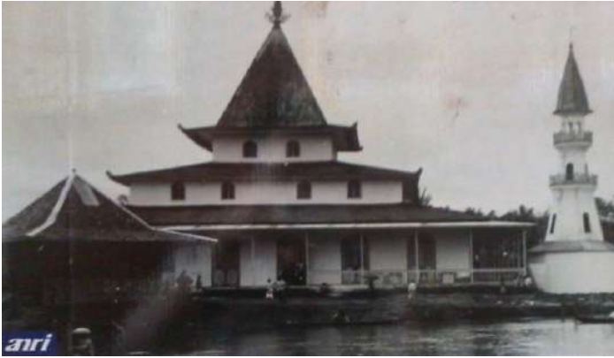
Bangunan Masjid di tepi Sungai Martapura pada tahun 1930

sungai. 64 Itu sebab, dalam perkembangannya, pelabuhan sungai memiliki sejarah yang panjang.