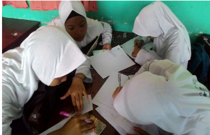
Gambar 4.10 siswa berdiskusi