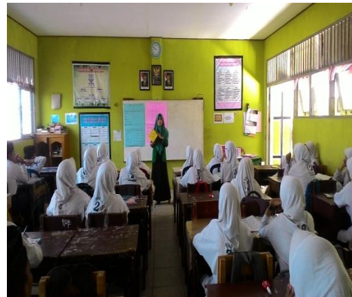
Gambar 4.2 guru menjelaskan