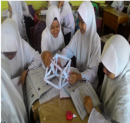
Gambar 4.3 siswa meidentifikasi

Kemudian mengisi LKS dengan bimbingan guru.