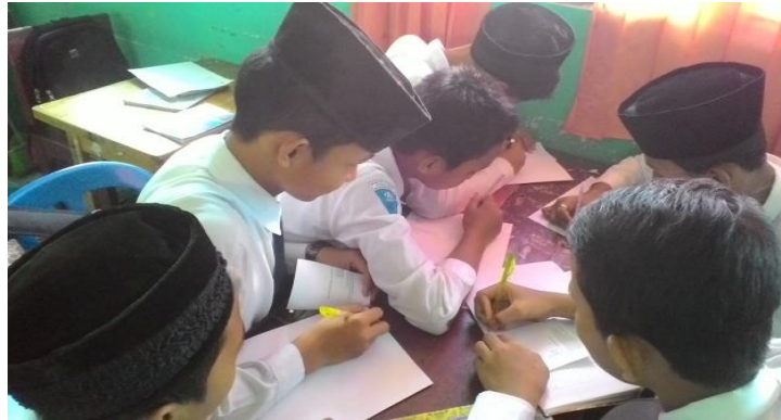
Gambar 4.5 siswa berdiskusi