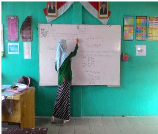
Gambar 4.12 guru menjelaskan

Peneliti menyiapkan rencana pembelajaran untuk menyampaikan materi pembelajaran. Terlebih dahulu guru menjelaskan materi tentang menghitung luas dan volume kubus dan balok. Dengan metode ceramah dan tanya jawab dengan siswa. Kemudian guru membagi siswa kedalam beberapa kelompok secara heterogen yang terdiri 3-4 orang perkelompok. Dan membagikan LKS untuk dikerjakan secara berdiskusi dengan kelompoknya masing-masing. Dan setelah selesai berdiskusi siswa diberi kesempatan untuk mempersentasikan hasil kerja kelompoknya didepan kelas.