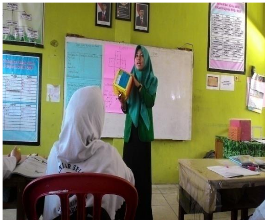
Gambar 4.1 tanya jawab

Peneliti menyiapkan rencana pembelajaran untuk menyampaikan materi pembelajaran. Terlebih dahulu guru menjelaskan materi tentang kubus dan balok yaitu dengan memperkenalkan kubus dan balok dengan media kotak yang berbentuk kubus dan balok kepada siswa, pada tahap ini guru membimbing siswa merumuskan definisi dari kubus dan balok.