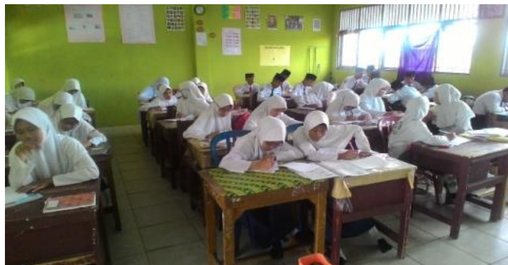
Gambar 4.8 siswa evaluasi

Guru memberikan himbawan kepada siswa sebelum memulai post test menyuruh siswa untuk mengisi nama, kelas dan juga tanggal/hari yang terdapat dalam lembar jawaban. Dalam mengerjakan post test , setiap siswa tidak boleh saling membantu satu sama lain. Keberhasilan pelaksanaan pembelajaran sangat ditentukan oleh kesuksesan siswa dalam mengerjakan post test tersebut. Aktivitas siswa ketika mengerjakan pot test dapat dilihat pada gambar berikut ini.