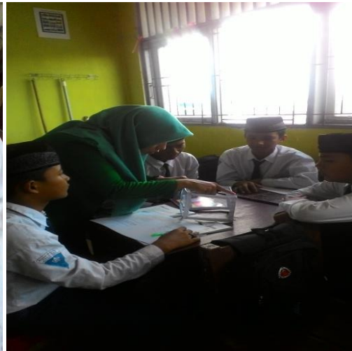
Gambar 4.4 guru membimbing