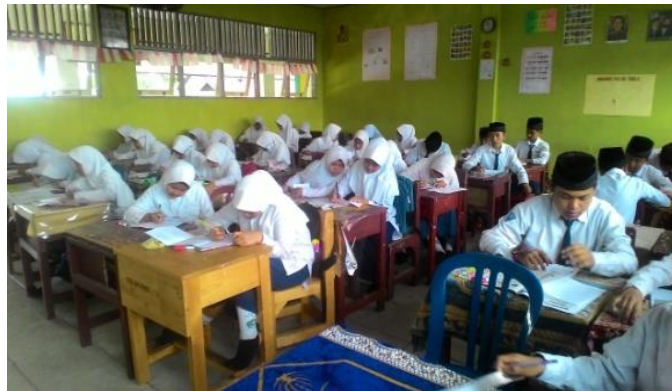
Gambar 4.14 Evaluasi

Guru memberikan himbawan kepada siswa sebelum memulai post test menyuruh siswa untuk mengisi nama, kelas dan juga tanggal/hari yang terdapat dalam lembar jawaban. Dalam mengerjakan post test , setiap siswa tidak boleh saling membantu satu sama lain. Keberhasilan pelaksanaan pembelajaran sangat ditentukan oleh kesuksesan siswa dalam mengerjakan post test tersebut. Aktivitas siswa ketika mengerjakan post test dapat dilihat pada gambar berikut ini.