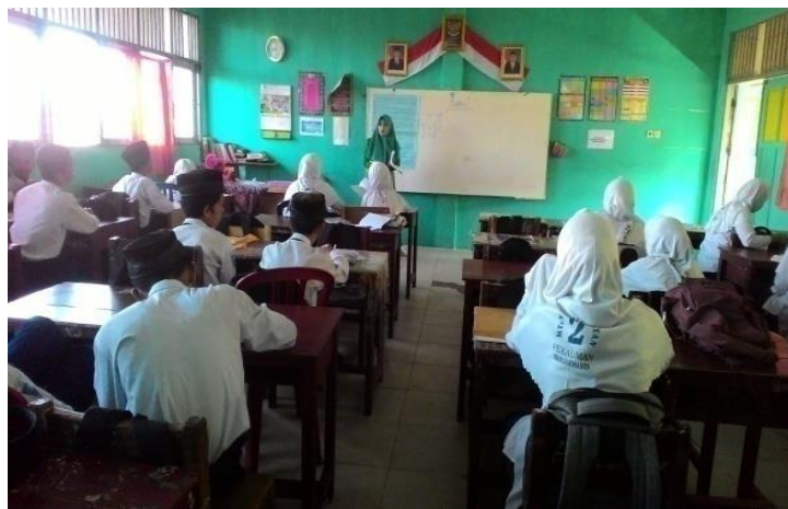
Gambar 4.9 guru menjelaskan

sudut). Dengan metode ceramah dan tanya jawab dengan siswa. Kemudian guru membagi siswa kedalam beberapa kelompok yang terdiri 3-4 orang perkelompok. Dan membagikan LKS untuk dikerjakan secara berdiskusi dengan kelompoknya masing-masing. Dan setelah selesai berdiskusi siswa diberi kesempatan untuk mempersentasikan hasil kerja kelompoknya didepan kelas.