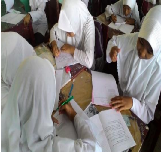
Gambar 4.6 siswa berdiskusi

Pada fase ini siswa juga mempresentasikan hasil diskusi didepan kelas keseluruhan teman sekelasnya dan guru juga memberikan penjelasan bagi siswa yang masih belum mengerti.