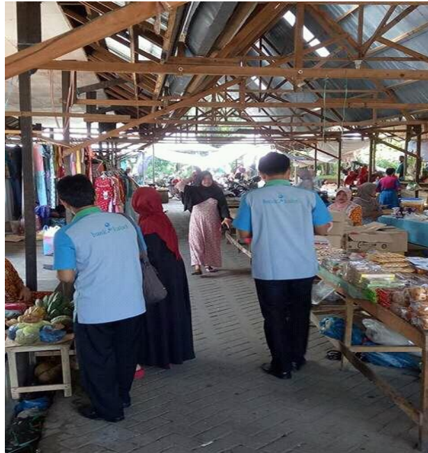
Bank Kalsel Cabang Syariah Kandungan bekerja sama dengan Dinas Perindagkop dan UKM pada pelatihan peningkatan kualitas dan packaging ikan Sepat Kering di Desa Muning Baru Kec. Daha Selatan pada tgl 23-34 September 2016