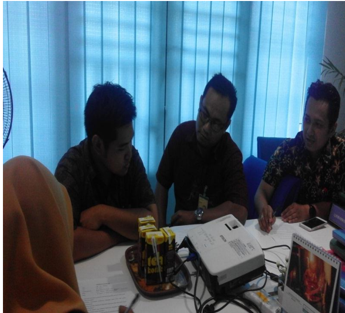
Program “manyasah pasar” oleh Bank Kalsel Cabang Syariah Kandangan