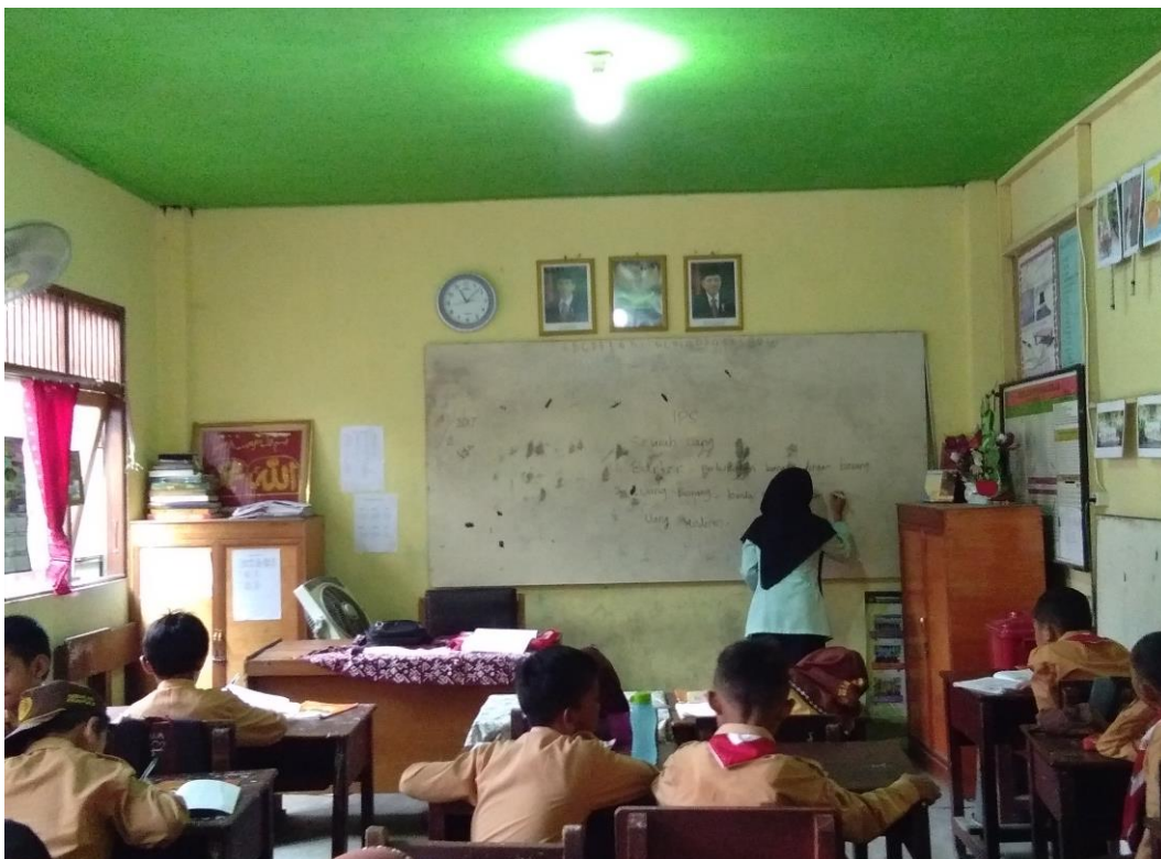
Lampiran 78. Dokumen (Foto-Foto) Keadaan MIN Kebun Bunga Banjarmasin dan Proses Pembelajaran IPS di Kelas Eksperimen I ( Scramble ) dan Eksperimen II ( Word Square )