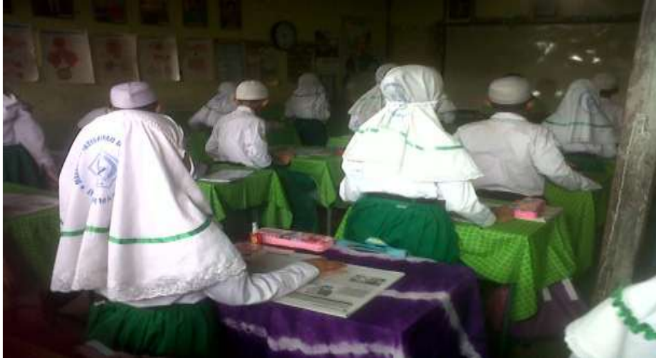
Kegiatan saat guru memasuki ruangan kelas

Pada saat pembelajaran IPS dengan Materi tentang Perjuangan Bangsa Indonesia Melawan Penjajah