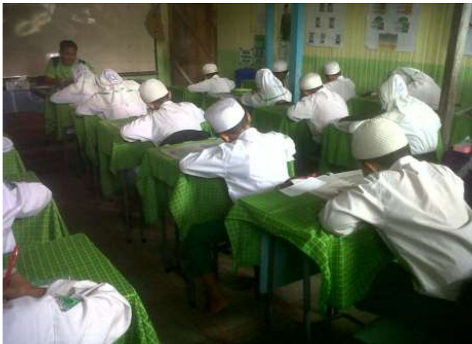
Suasana peserta didik saat mengerjakan latihan yang diberikan guru