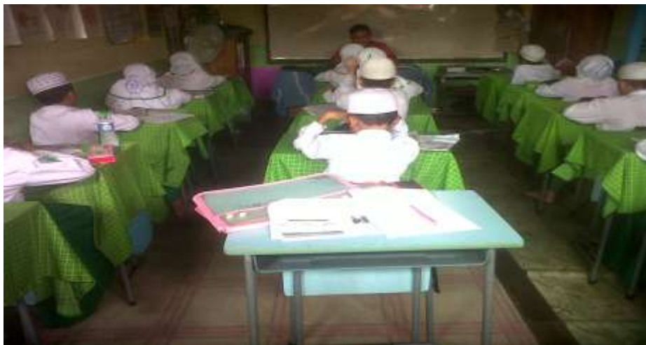
Kegiatan saat guru menjelaskan materi tentang Perjuangan Bangsa Indonesia menggunakan Metode Bercerita