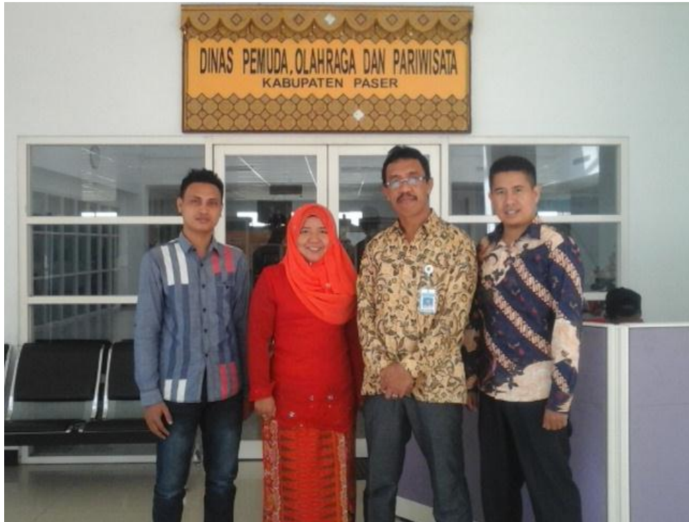
Foto bersama di depan kantor Dinas Pemuda, Olah Raga dan Pariwisata