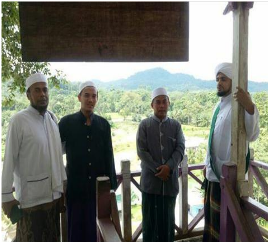
Saat berada di atas tangga didepan Goa Tengkorak