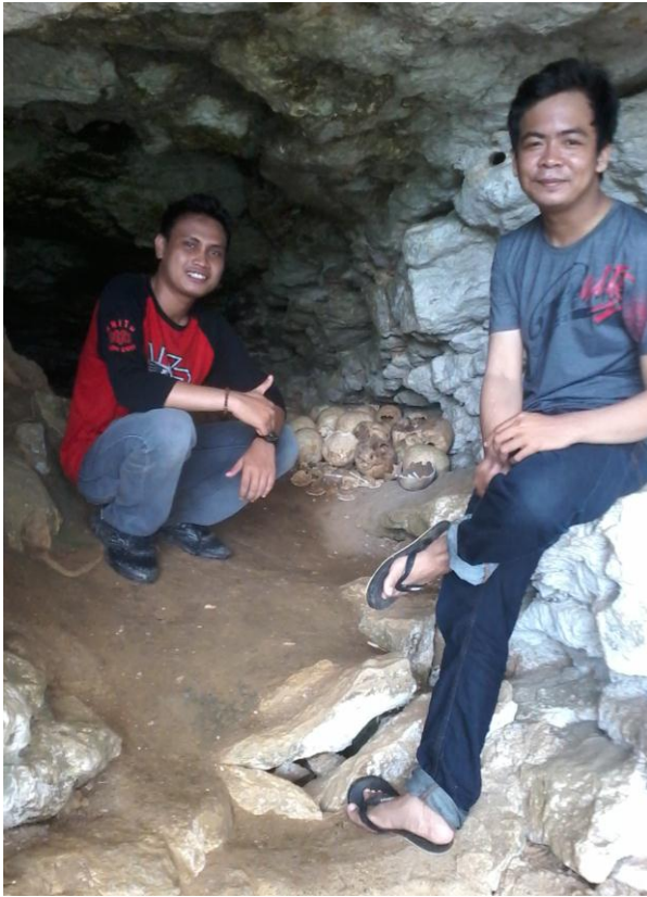
Saat didalam Goa Tengkorak