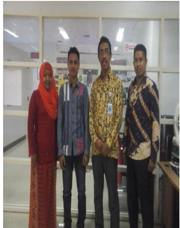
Foto bersama didalam ruangan