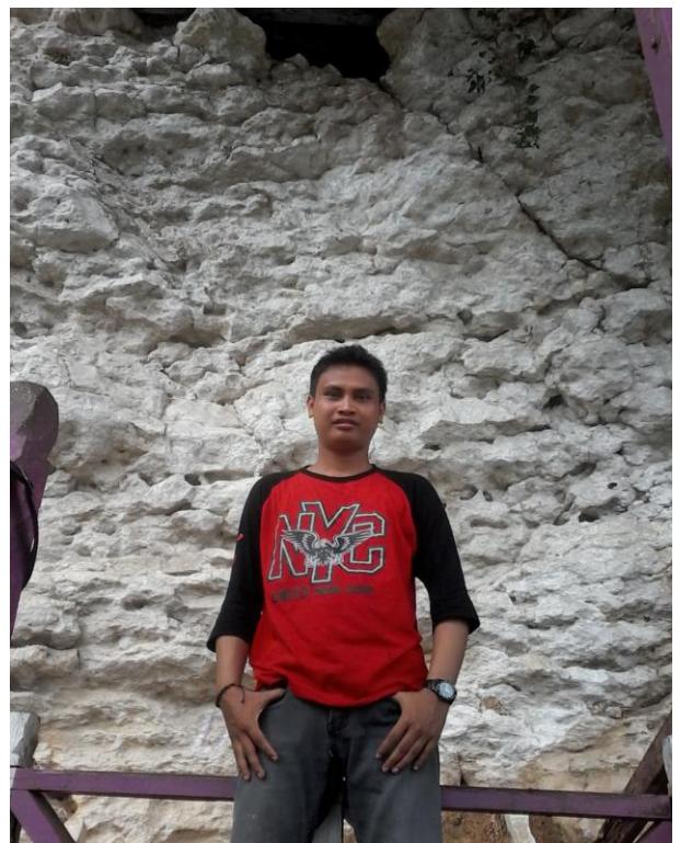
Di luar Goa Tengkorak