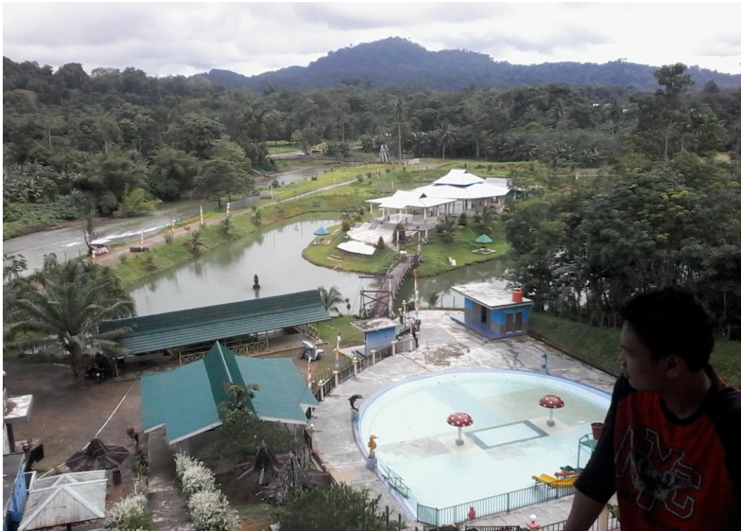
Pemandangan yang dilihat saat berada didepan Goa Tengkorak