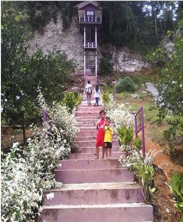
Tangga jalan menuju Goa Tengkorak