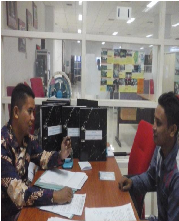
Saat wawancara secara langsung