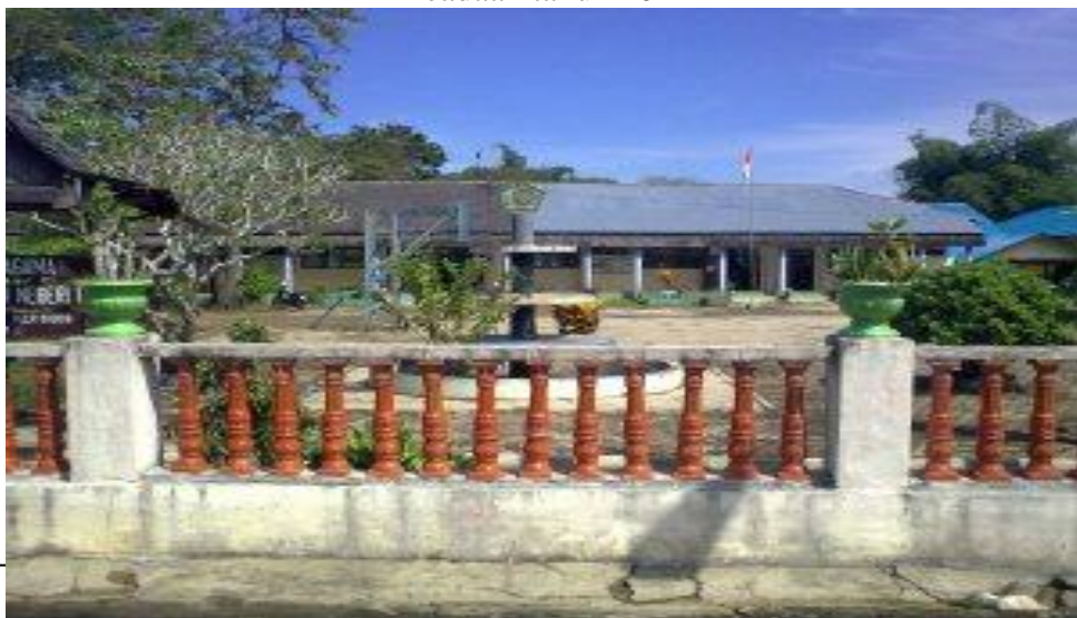
Keadaan tahun 2011

MAN 1 Amuntai adalah contoh madrasah yang dalam kurun waktu 5 tahun telah terjadi perubahan yang sangat cepat. Data penelitian menunjukkan perbandingan fasilitas pada tahun 2011 dengan tahun 2016 sebagai berikut: