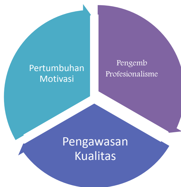
Gambar 5.3: Tiga tujuan Supervisi Akademik

Supervisi akademik sekolah di MTs RM Putra terhadap guru diadakan secara berkala dan terjadual selama hari kerja sekolah atau hari aktif belajar. Sepervisornya adalah kepala sekolah bersama wakil kepala sekolah. Hal-hal yang