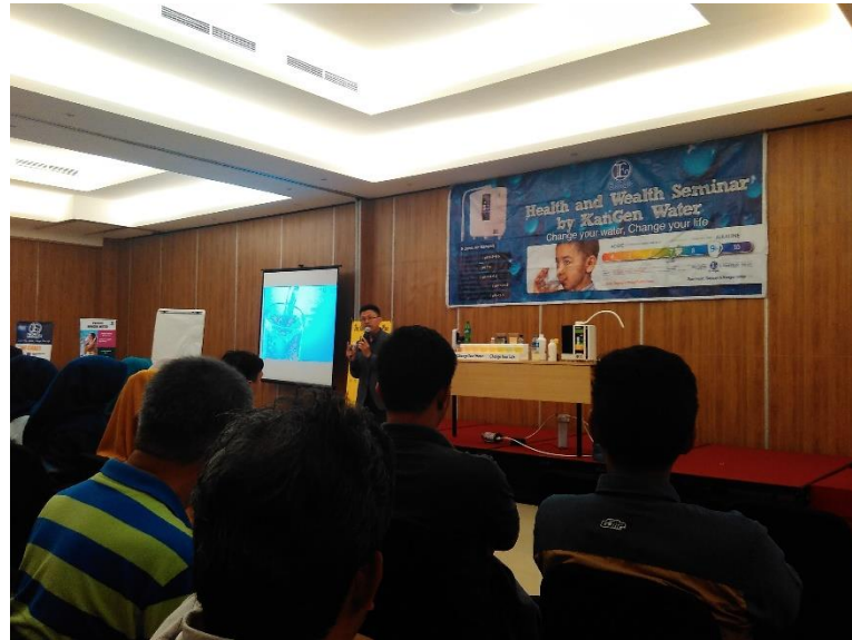
Seminar pengenalan produk oleh para distributor Pt. Enagic