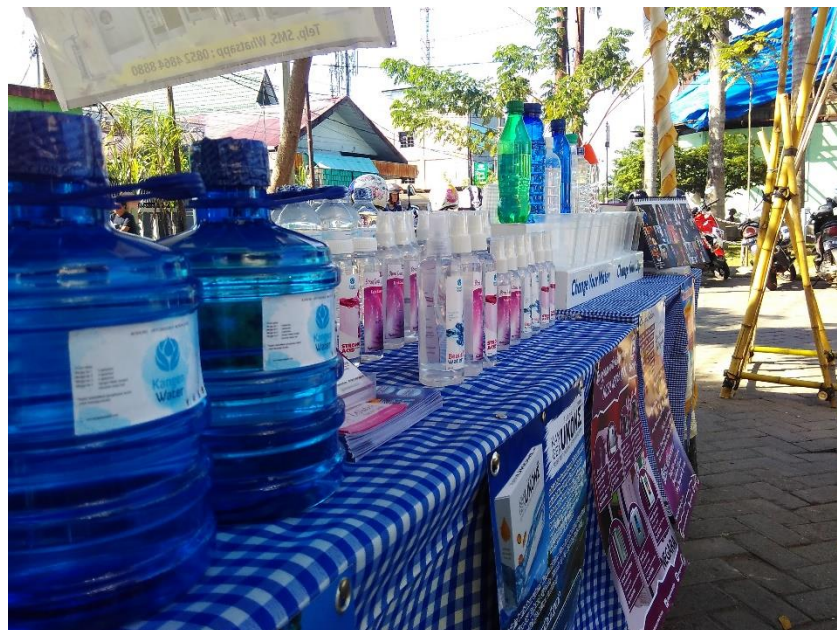
Penjualan Air yang di proses melalui mesin LEVELUK yaitu KanGen Water