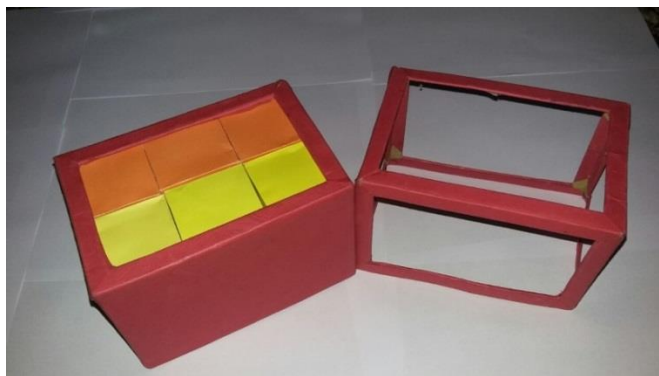
Gambar 4. 3. Kubus-kubus Kecil dan Balok