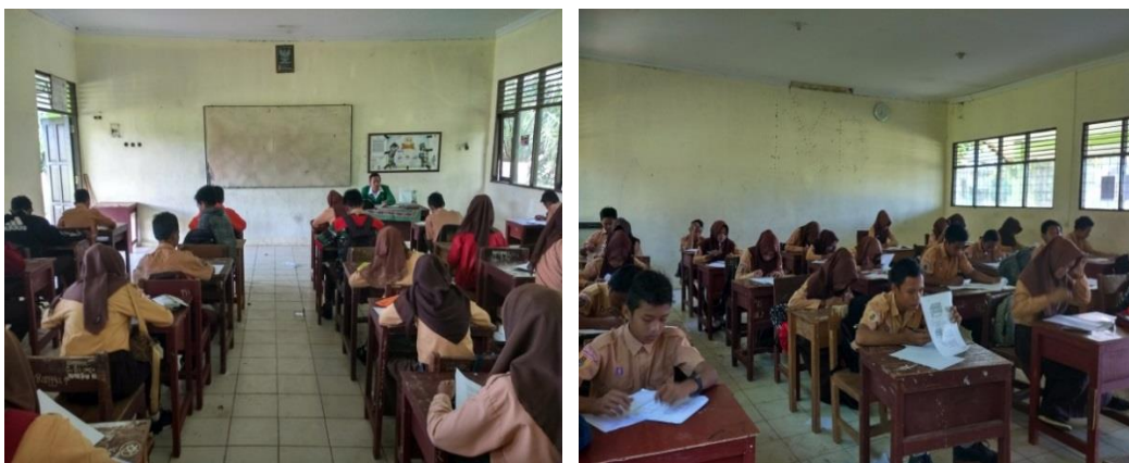
Gambar 4. 6. Tes Akhir

Pada pertemuan ketiga dilakukan tes akhir. tes akhir dilakukan untuk mengukur tingkat penguasaan materi terkait dengan materi yang diajarkan yaitu tentang bangun ruang kubus dan balok. Serta jumlah butir soal yang diberikan sebanyak 8 soal yang mengacu dari 4 indikator kecerdasan visual-spasial .