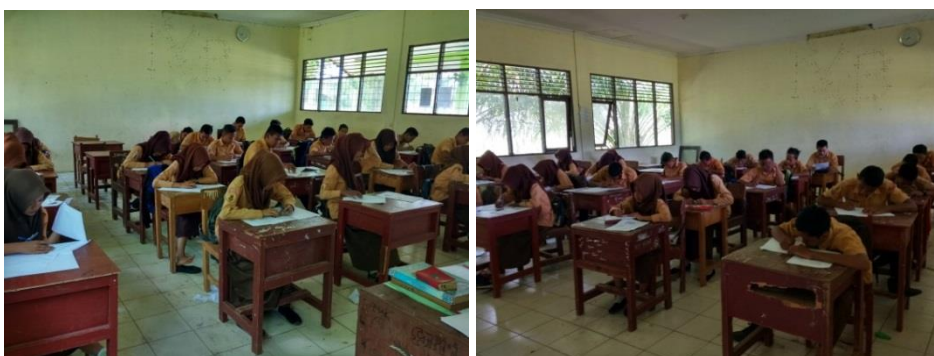
Gambar 4. 4. Siswa Melaksanakan Tes Akhir

Pada pertemuan ketiga dilakukan tes akhir, tes akhir dilakukan untuk mengukur tingkat penguasaan materi terkait dengan materi yang diajarkan yaitu tentang bangun ruang kubus dan balok. Serta jumlah butir soal yang diberikan sebanyak 8 soal yang mengacu dari 4 indikator kecerdasan visual-spasial .