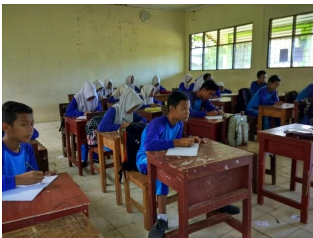
Gambar 4. 5. Siswa Mencatat Setelah Guru Menyampaikan Materi

Pada pertemuan pertama guru menyampaikan materi tentang bangun ruang kubus dan bagian bagian dari sebuah kubus dan memberikan contoh-contoh soal yang berkaitan dengan kubus. Setelah selesai menyajikan informasi, guru mengadakan tanya jawab dengan siswa untuk mengetahui pemahaman terhadap materi yang telah diberikan dan memberikan kesempatan yang sama kepada siswa untuk bertanya. Pada pertemuan kedua guru menyampaikan materi tentang bangun ruang balok dan memberikan contoh-contoh soal yang berkaitan dengan materi.