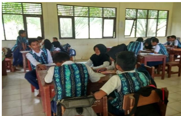
Gambar 4. 1. Siswa Duduk Sesuai Kelompoknya.

Pada tahap ini guru membagi siswa ke dalam beberapa kelompok belajar heterogen, yaitu terdiri dari 4-5 perkelompok (langkah a). Pembentukan kelompok tersebut berdasarkan nilai tes kemampuan awal yang di ambil dari ulangan harian. Pembentukan kelompok dilakukan dengan cara mengurutkan siswa mulai dari kemampuan tinggi sampai rendah dengan rincian tiap kelompok sebagai berikut, dua siswa berkemampuan tinggi pada setiap kelompok, dan sisanya siswa berkemampuan sedang atau rendah. Pada pertemuan kedua kelompok yang digunakan sama dengan pembagian kelompok pada pertemuan pertama.