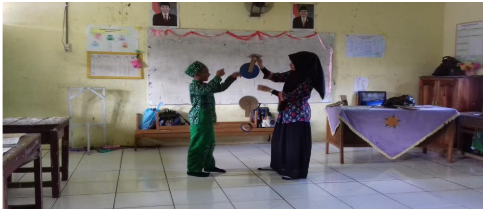
Gambar 4.1. Aktivitas Guru dan Siswa Kelas V A Saat Pembelajaran Pertama Menggunakan Alat Peraga Sederhana dari Kardus Bekas

menyebutkan jenis-jenis katrol, siswa juga mampu membedakan jenis-jenis katrol tersebut dengan cara melihat serta memegang secara langsung alat peraga katrol (katrol tetap, bebas dan majemuk).