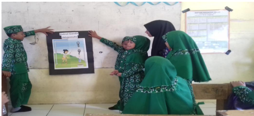
Gambar 4.4. Aktivitas Siswa Kelas V B Saat Menunjukkan Cara Kerja Jenis-Jenis Katrol