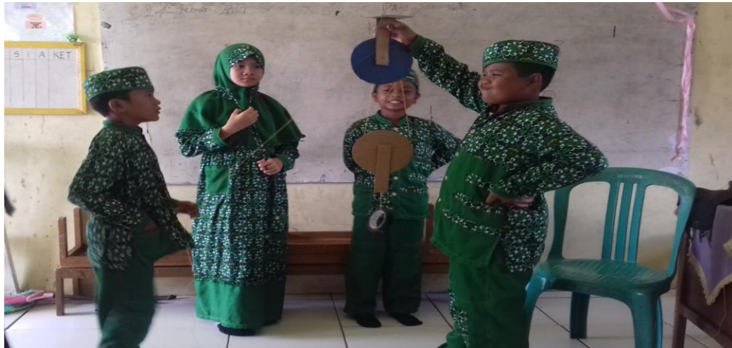
Gambar 4.2. Aktivitas Siswa Saat Menunjukkan Cara Kerja Jenis-Jenis Katrol