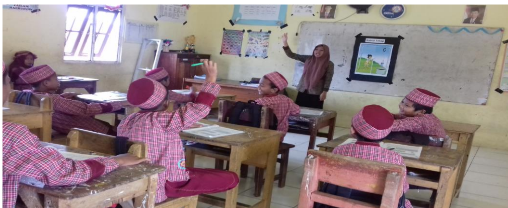
Gambar 4.3. Aktivitas Guru dan Siswa Kelas V B Saat Pembelajaran Pertama Menggunakan Media Gambar Kontrol

Pada pertemuan pertama siswa menyebutkan jenis-jenis kontrol beserta pengertian berbagai jenis kontrol dan pertemuan kedua selain siswa mampu menyebutkan jenis-jenis kontrol, siswa juga mampu membedakan jenis-jenis kontrol tersebut dengan cara melihat media gambar kontrol.