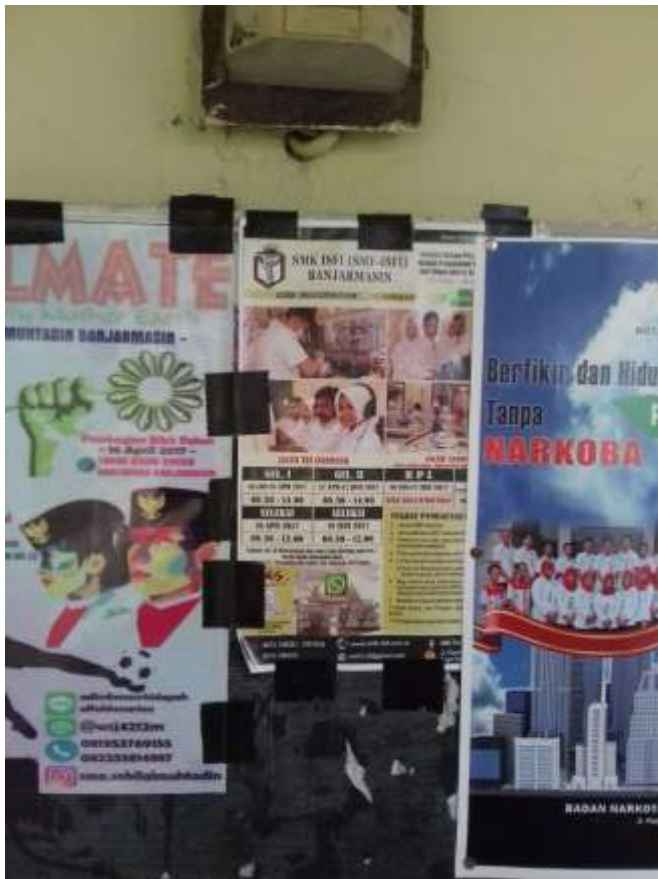
Brusur sekolah lanjutan