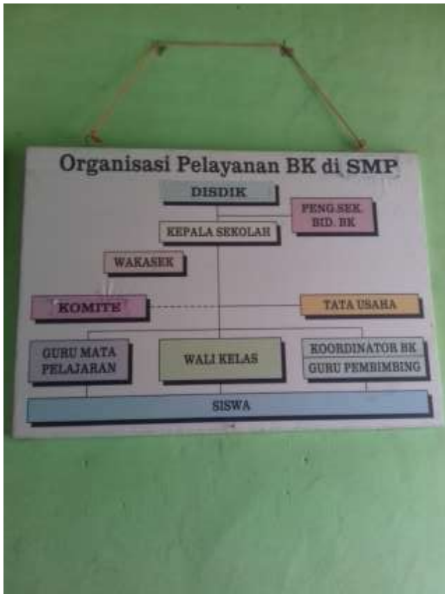
Struktur Organisasi Pelayanan BK di SMPN 23 Banjarmasin