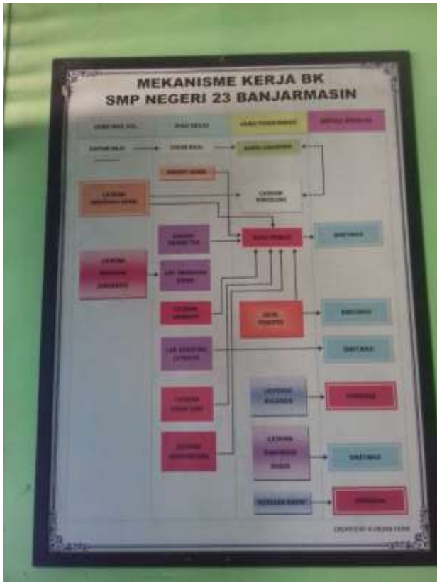
Mekanisme Kerja BK SMPN 23 Banjarmasin