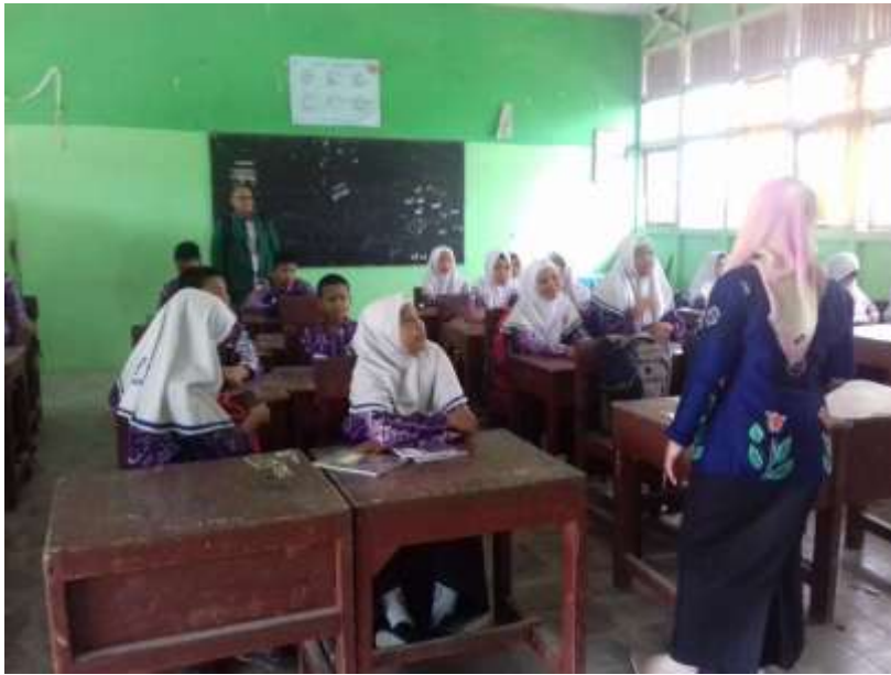
Observasi saat Layanan diberikan Guru Bimbingan dan Konseling