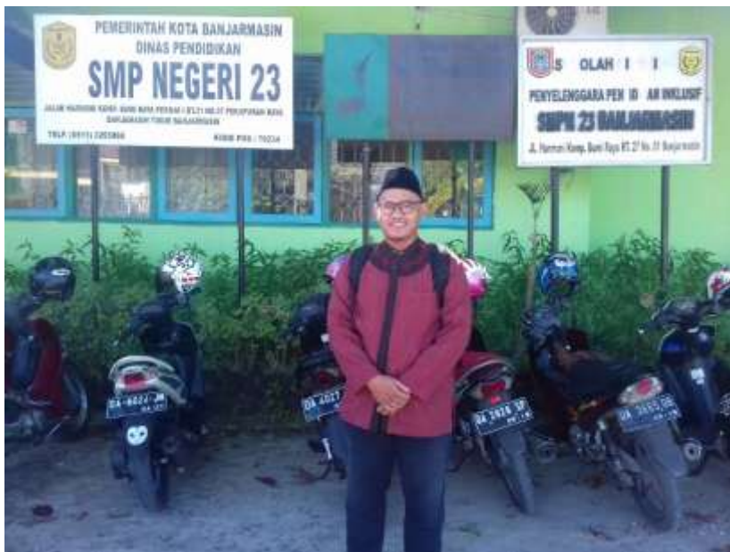
Penulis Berada di depan SMPN 23 Banjarmasin