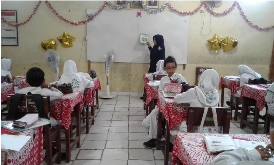
foto ketika peserta didik bertanya terhadap materi pembelajaran SBK

foto ketika observasi di kelas pada saat pembelajaran SBK berlangsung.