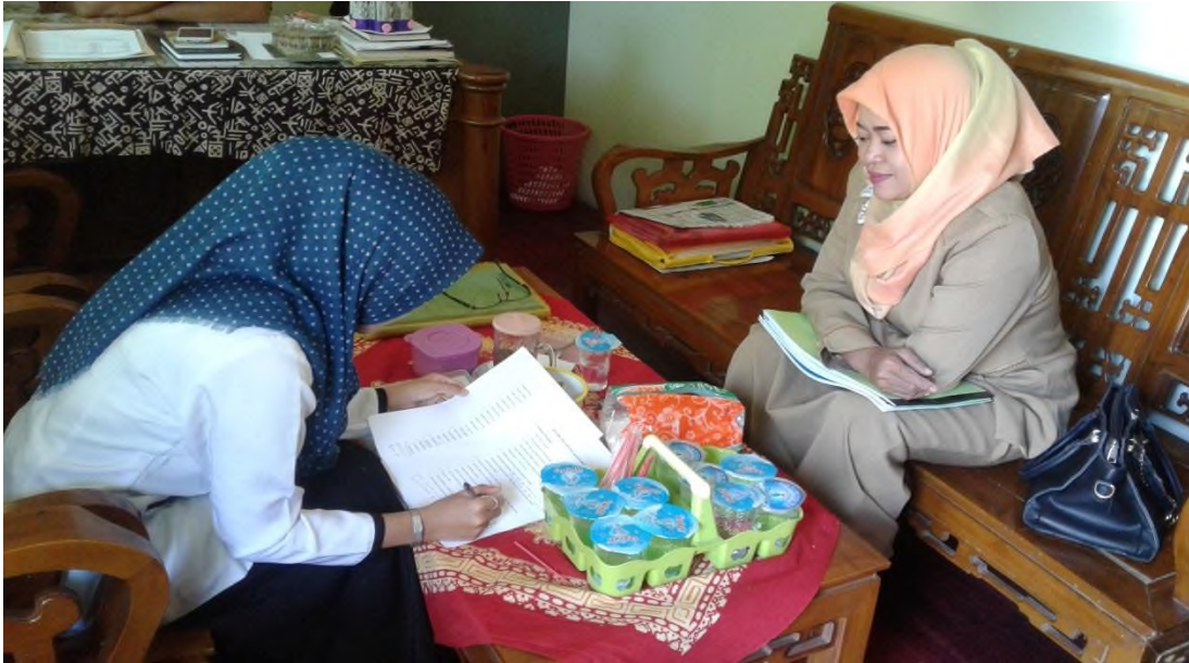
Foto wawancara dengan kepala sekolah MIN 4 Kota Banjarmasin

Foto wawancara bersama guru mata pelajaran SBK MIN 4 Kota Banjarmasin