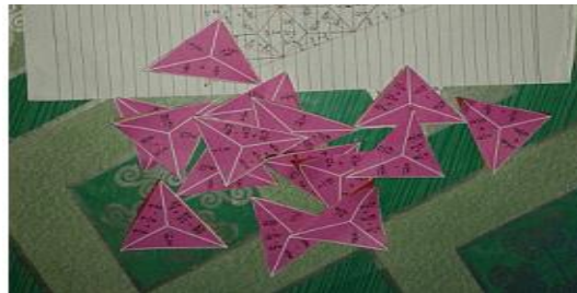
Gambar 2.2 Math Triangle