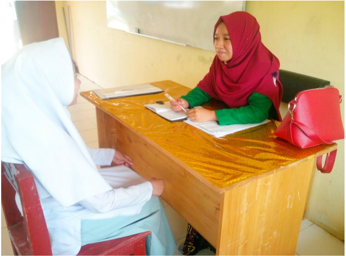
Penulis sedang melakukan wawancara dengan siswa kelas XI Agama