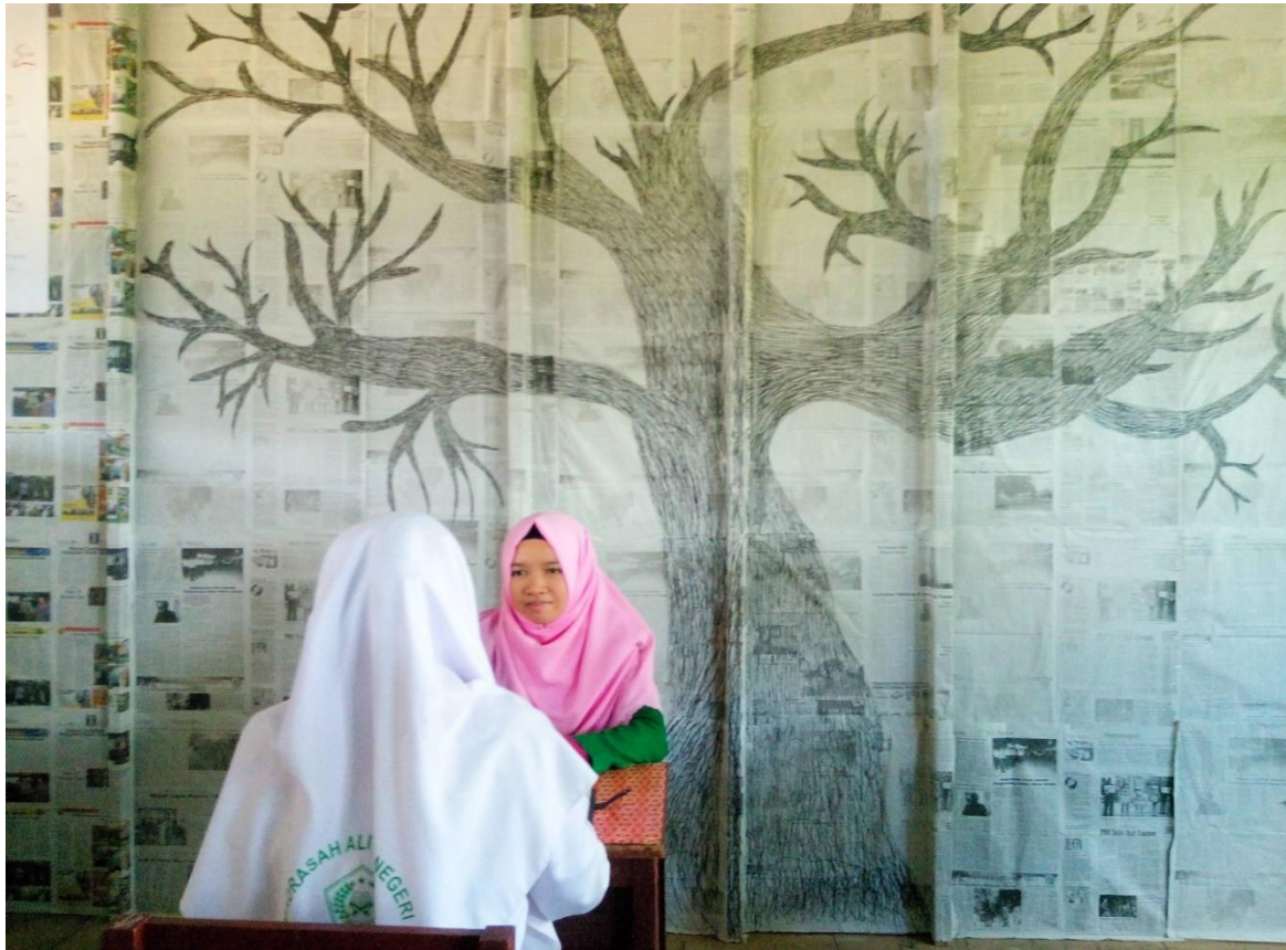
Penulis sedang melakukan wawancara dengan siswa kelas XI IPA1