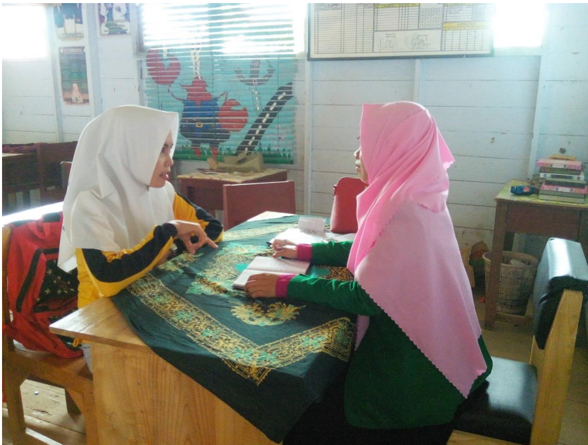
Penulis sedang melakukan wawancara dengan siswa kelas XI IPA1