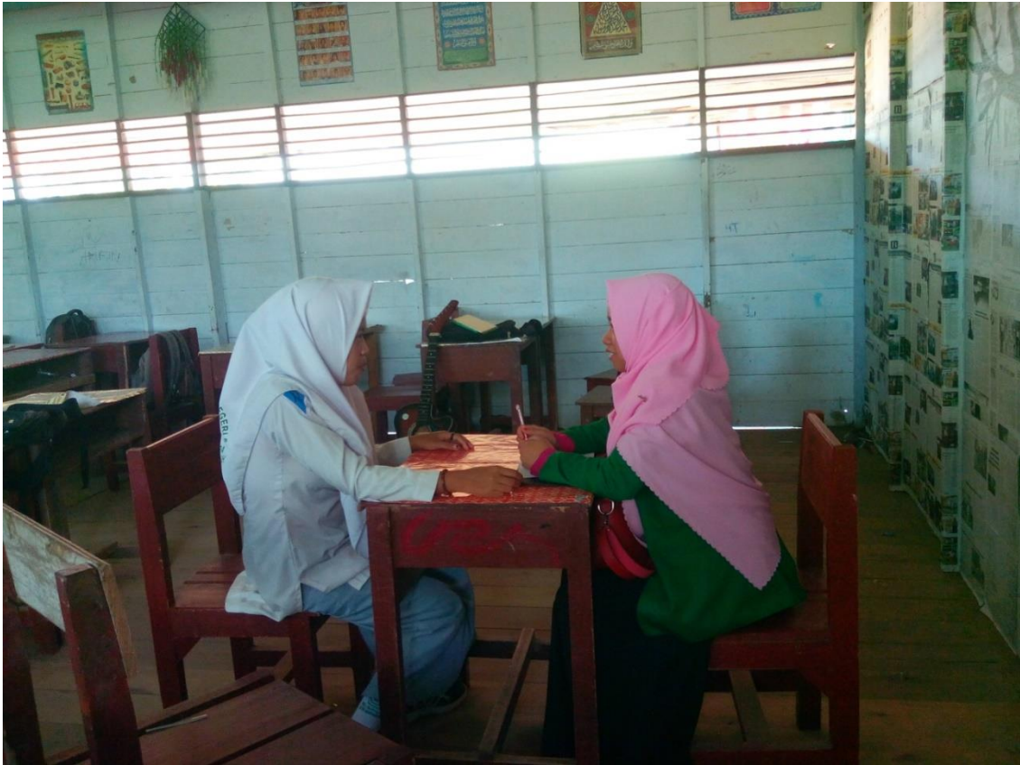
Penulis sedang melakukan wawancara dengan siswa kelas XI IPA 2