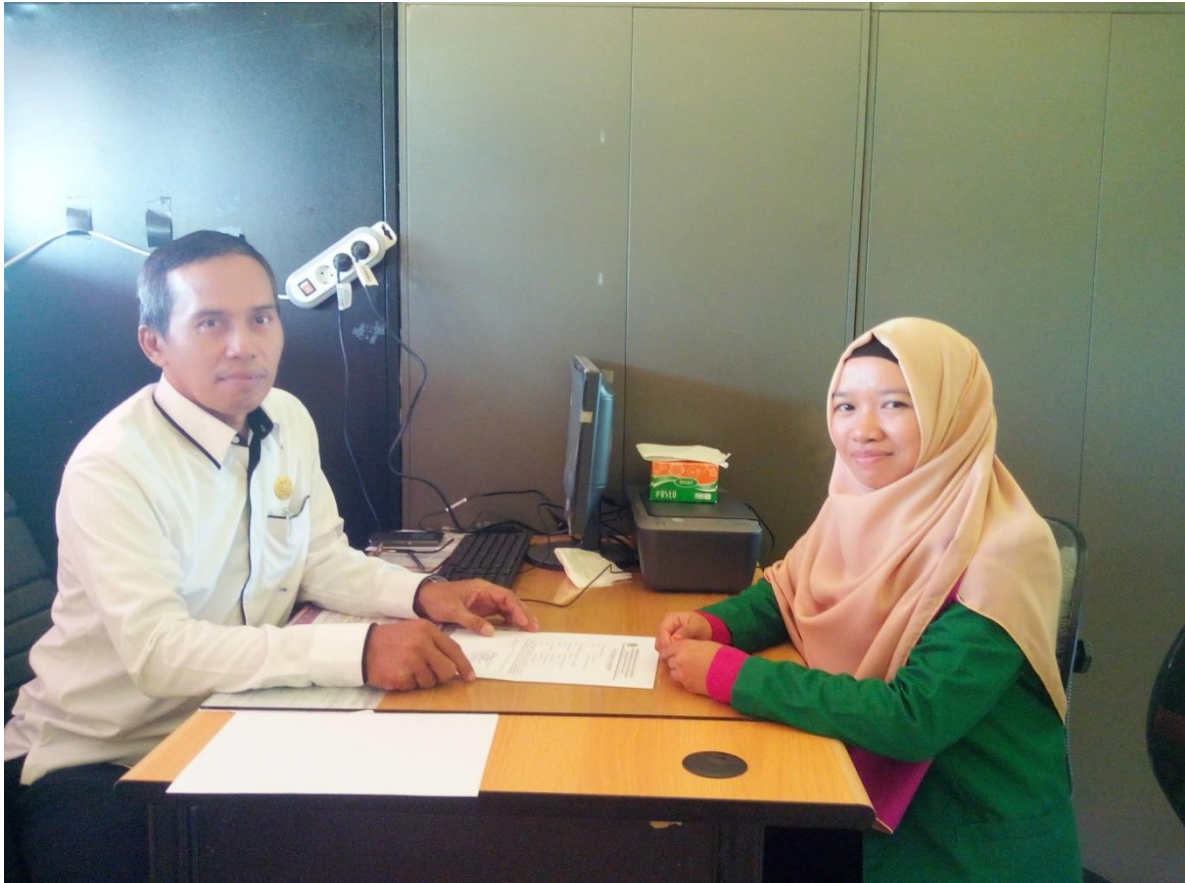
Penulis sedang melakukan wawancara dengan guru Kepala sekolah