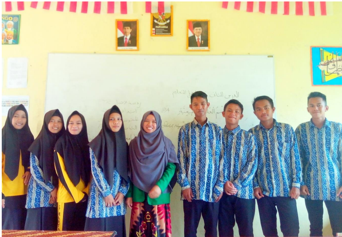
Penulis sedang photo bersama siswa