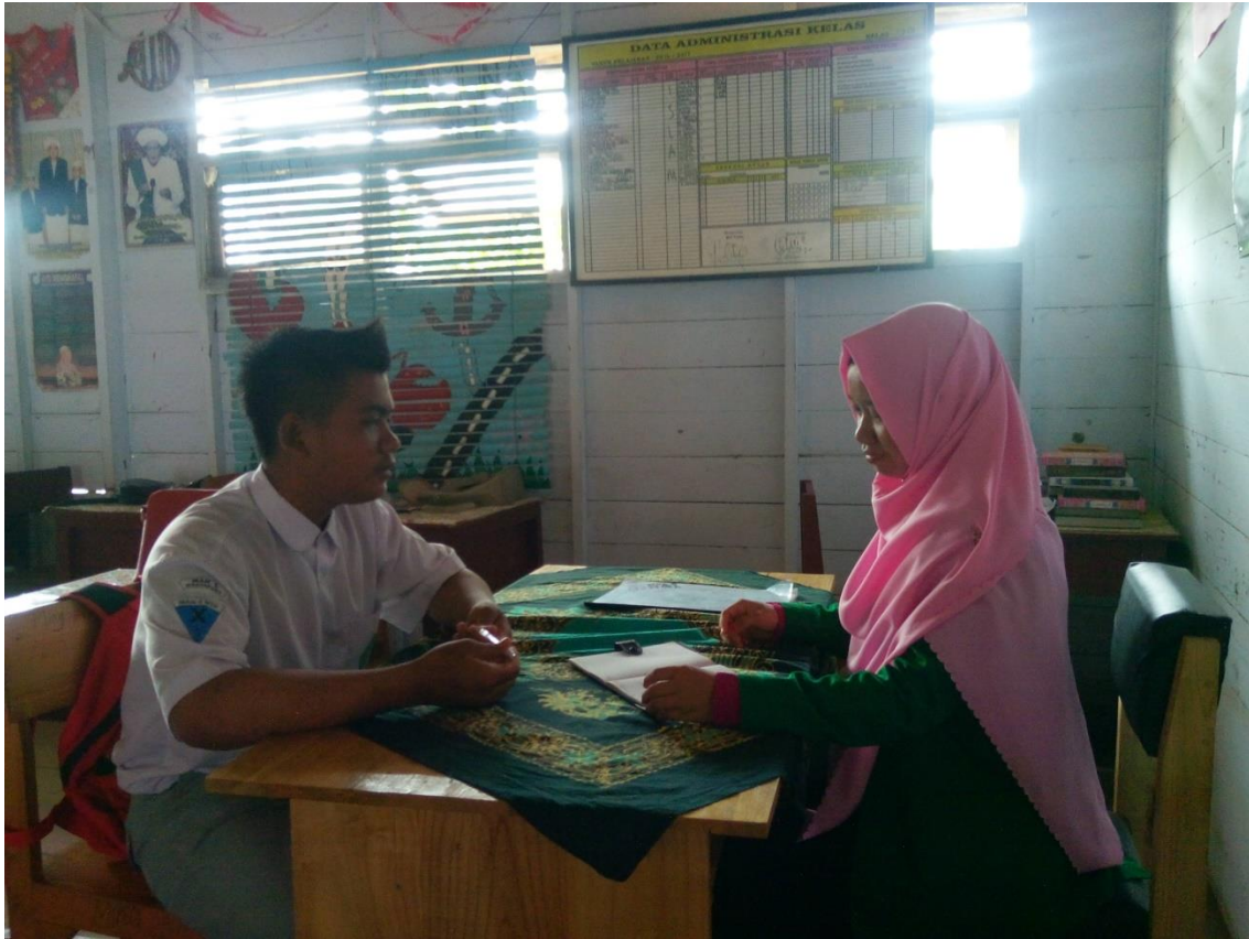
Penulis sedang melakukan wawancara dengan siswa kelas XI IPA1