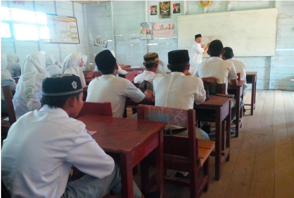
Siswa sedang memperhatikan pembelajaran Al-quran Hadist