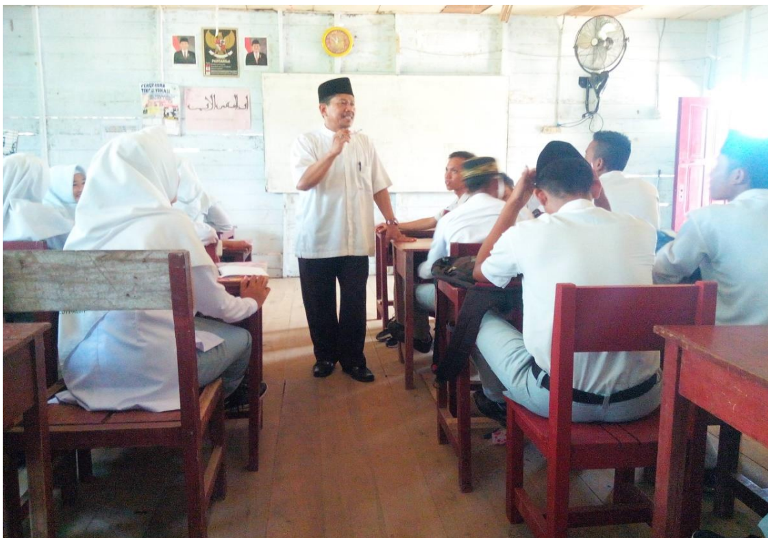
Guru sedang menjelaskan mata pelajaran Al-quran Hadist di dalam kelas