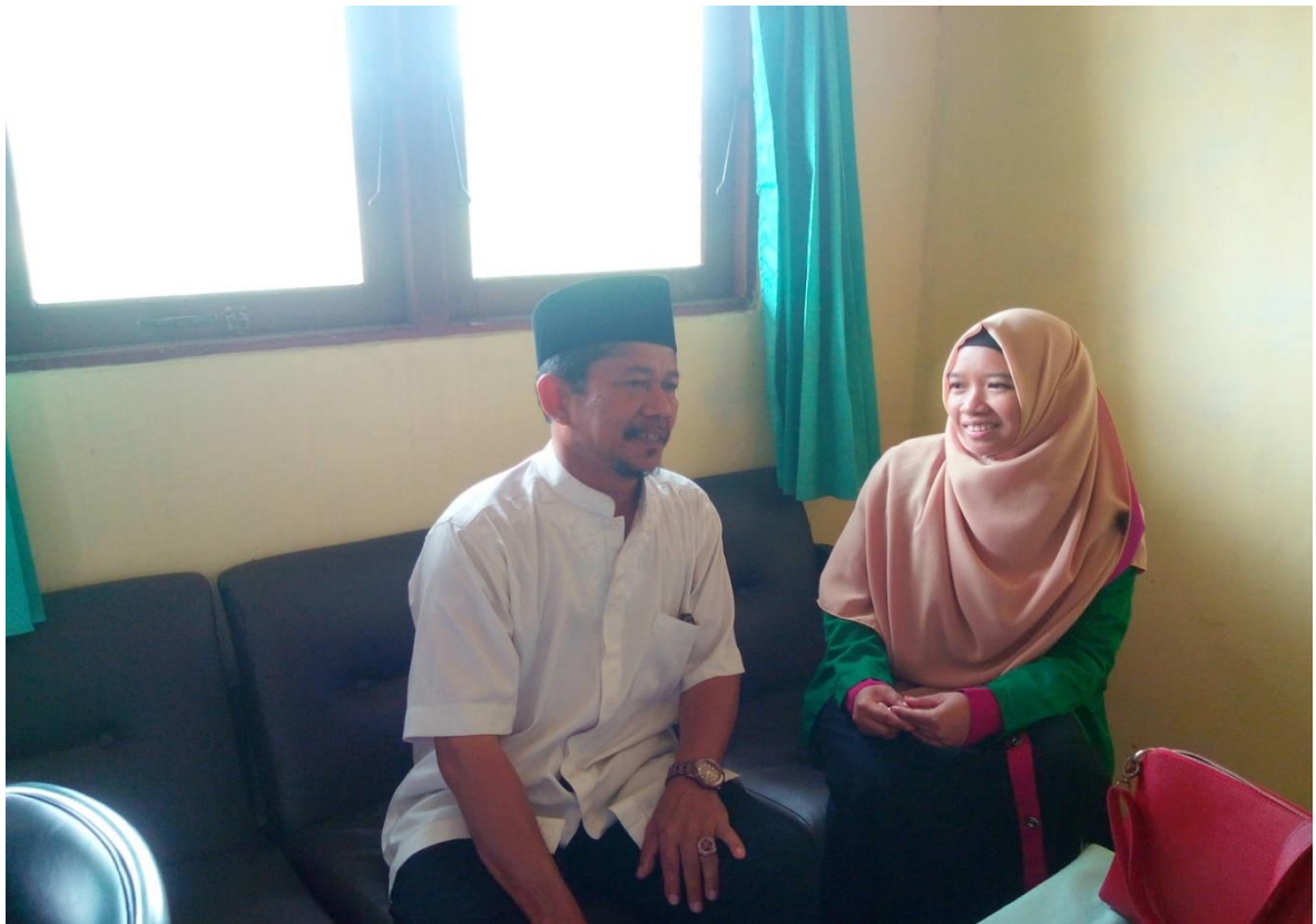
Penulis sedang melakukan wawancara dengan guru Al-quran Hadist