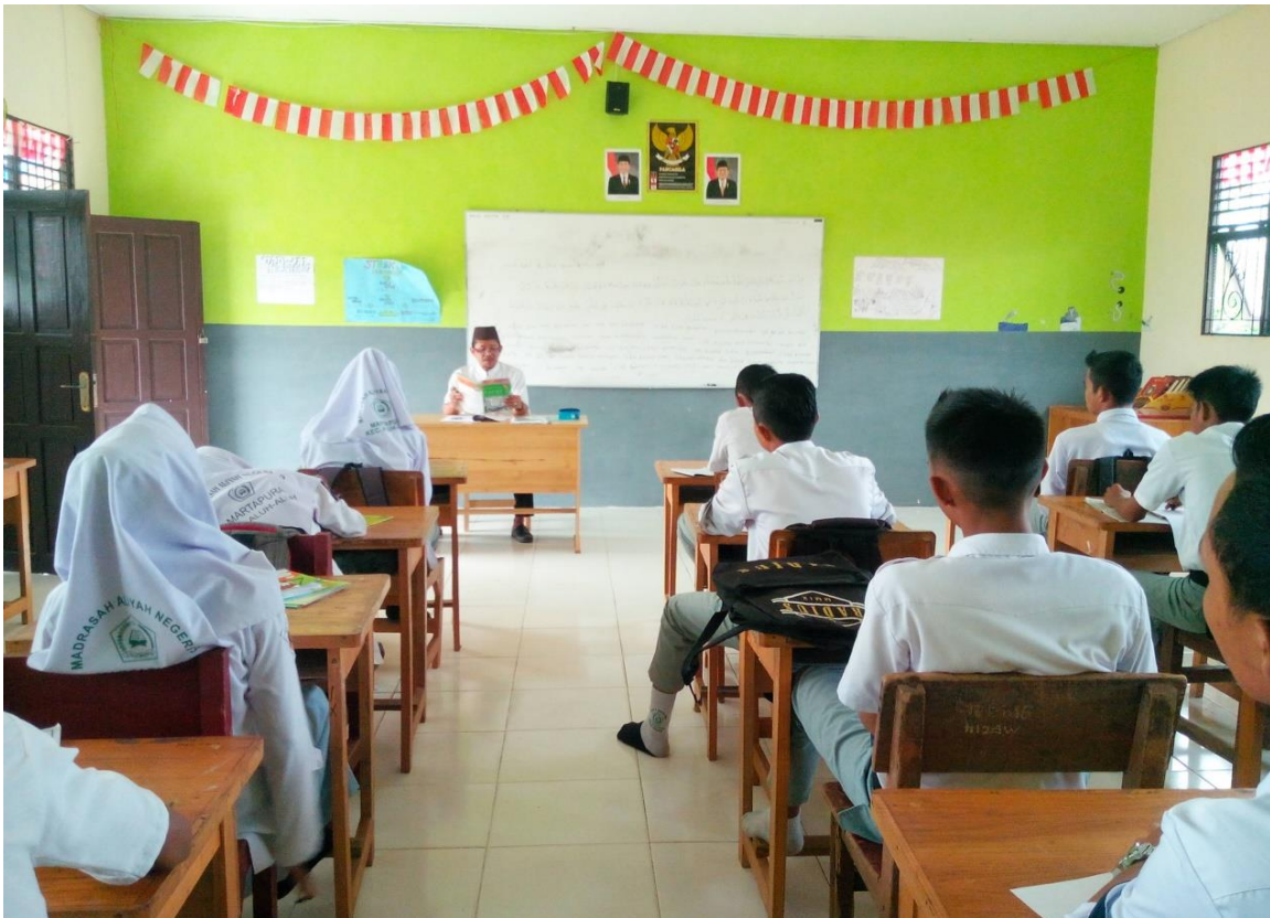
Guru sedang melaksanakan kegiatan pembelajaran Al-quran Hadist