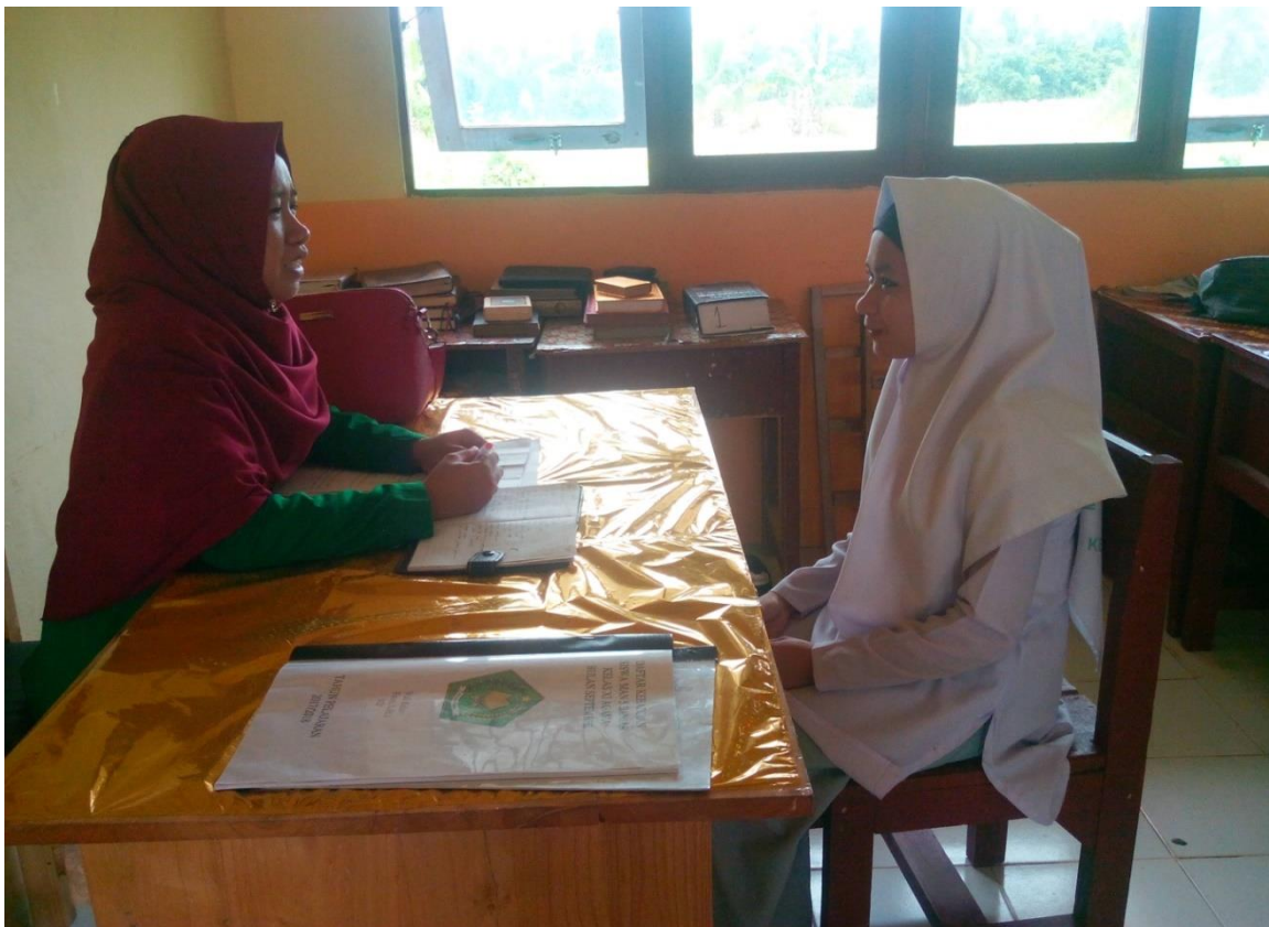
Penulis sedang melakukan wawancara dengan siswa kelas XI Agama