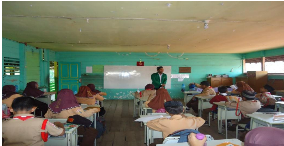
Gambar 4.5. Aktivitas Guru Saat Penyajian Materi

Guru menyajikan materi tentang mengenal keragaman kenampakan alam dan buatan serta pembagian wilayah waktu di Indonesia sesuai dengan rencana pelaksanaan pembelajaran yang telah dibuat dan pembelajaran dibagi menjadi 3 kali pertemuan. Setelah selesai menyajikan informasi, guru mengadakan tanya jawab dengan siswa untuk mengetahui pemahaman materi yang telah diberikan, dan memberikan kesempatan kepada siswa untuk bertanya.