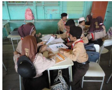
Gambar 4.6. Aktivitas Siswa dalam Kelompok