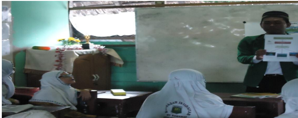
Gambar 4.4. Aktivitas guru menjelaskan kembali hasil diskusi siswa

Aktivitas guru menjelaskan kembali hasil diskusi siswa dilihat pada gambar berikut ini.