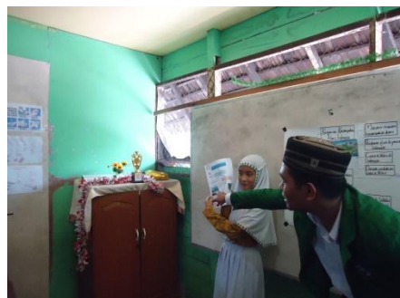
Gambar 4.3. Aktivitas Siswa Pada Saat Presentasi Hasil Diskusi

Dalam pembahasan hasil diskusi pada pertemuan kedua dan ketiga perhatian siswa pada setiap perwakilan kelompok yang menjelaskan hasil peta konsep yang telah dibuat oleh setiap kelompok lebih baik dari pertemuan pertama.