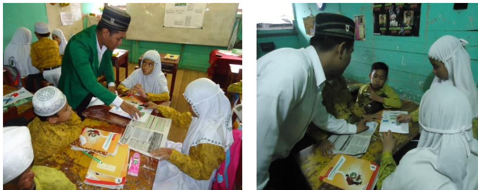
Gambar 4.2. Aktivitas Siswa dalam Kelompok mengisi bagian dari Peta Konsep

Guru memberikan lembar kerja kepada setiap kelompok, Menjelaskan kepada setiap kelompok untuk mengisi lembar kerja siswa dan mengisi bagian dari peta konsep sesuai dengan bahasa mereka sendiri, kemudian menjelaskan bahwa bagian peta konsep yang mereka kerjakan akan dipresentasikan. guru memantau kerja tiap kelompok dan membantu kelompok yang mengalami kesulitan jika ada hal-hal yang belum mereka pahami. Dalam kelompok, siswa mengisi peta konsep dengan menempelkan gambar dan menuliskan pengertian serta contoh-contohnya.