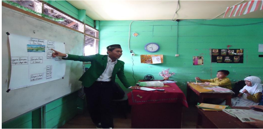
Gambar 4.1. Aktivitas Guru Saat Penyajian Materi