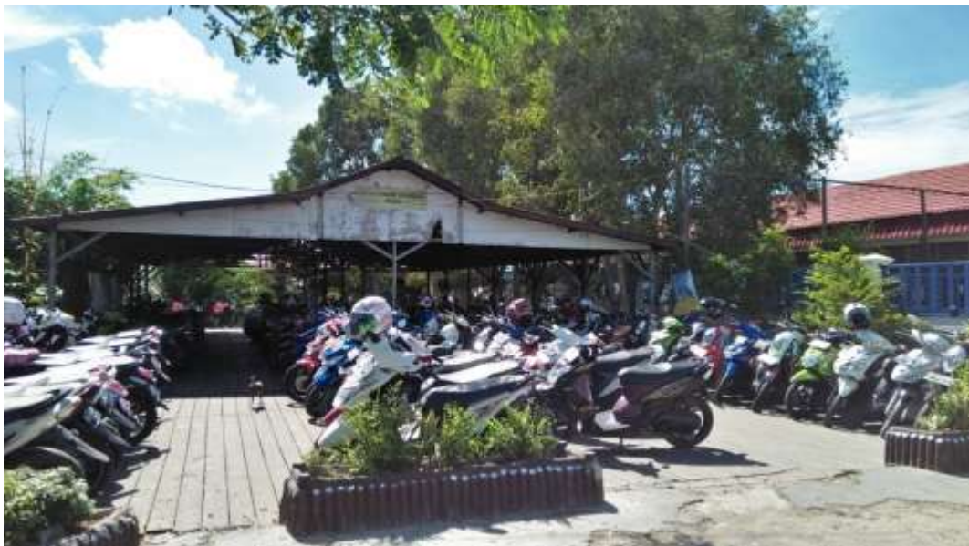
❖ Tempat Parkir peserta didik SMAN 1 DAHA UTARA