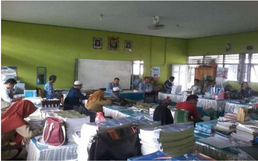
❖ Ruang Guru pengajar SMAN 1 Daha Utara.