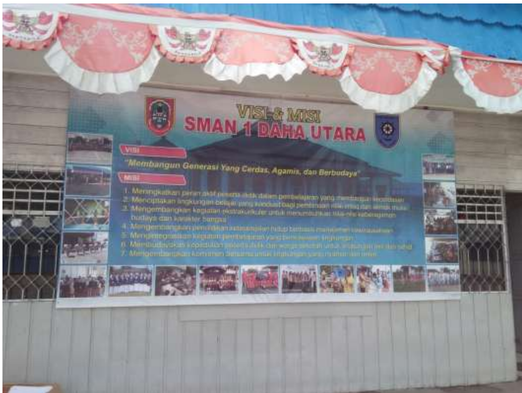
❖ Ruang Guru-guru dan kantor kepala Sekolah SMAN 1 Daha Utara