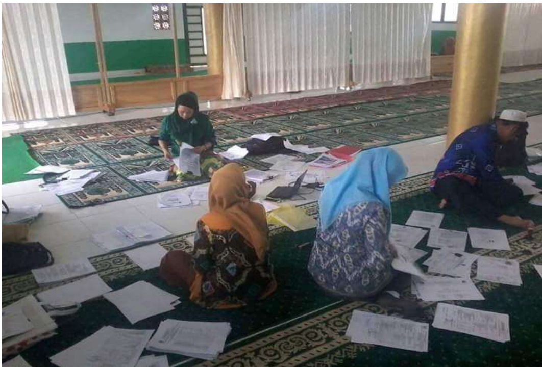
Panitia mengumpulkan dan mengelompokkan peminatan peserta didik Baru.