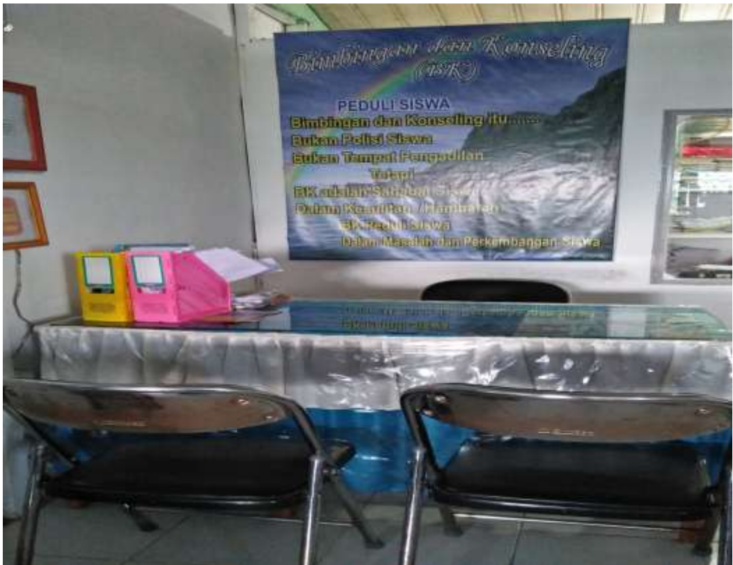
❖ Tempat konsultasi peserta didik SMAN 1 Daha Utara