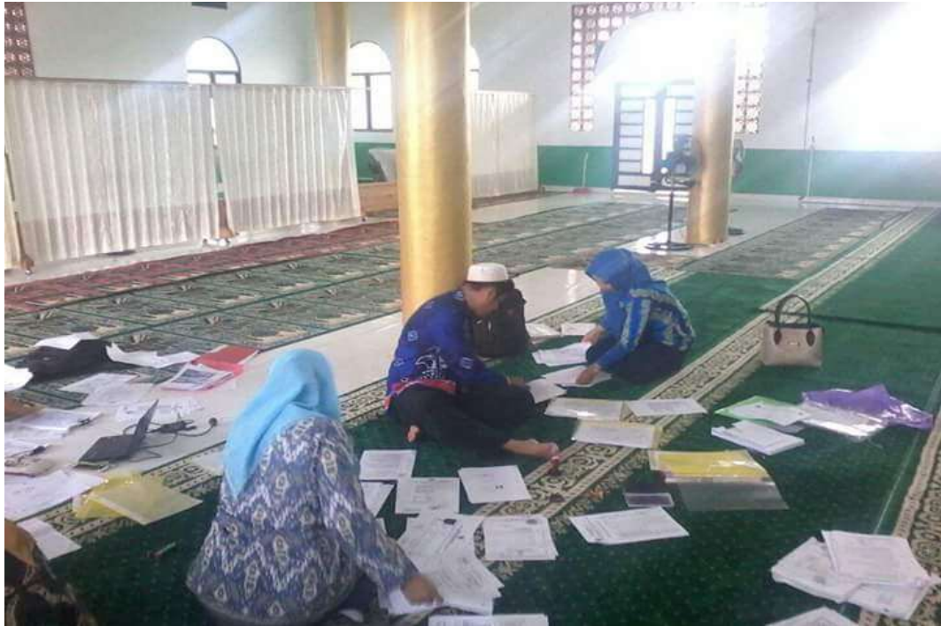
❖ Identifikasi Berkas Pendaftaran Peserta didik Baru