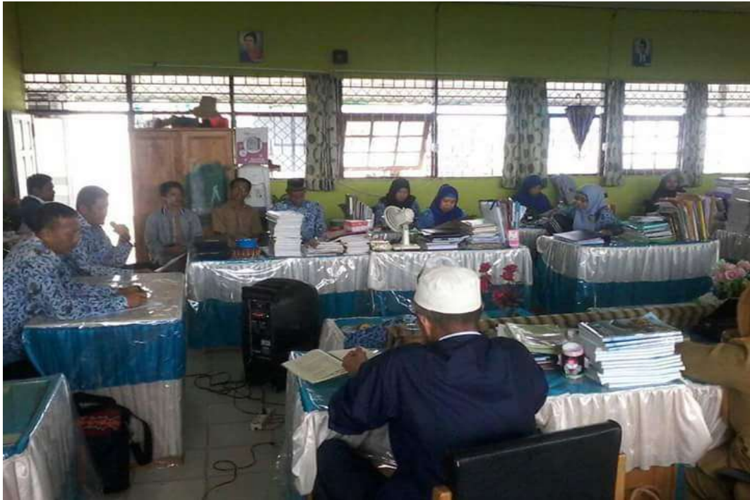
❖ Pemilihan dan Penetapan Peserta Didik Baru SMAN 1 Daha Utara.