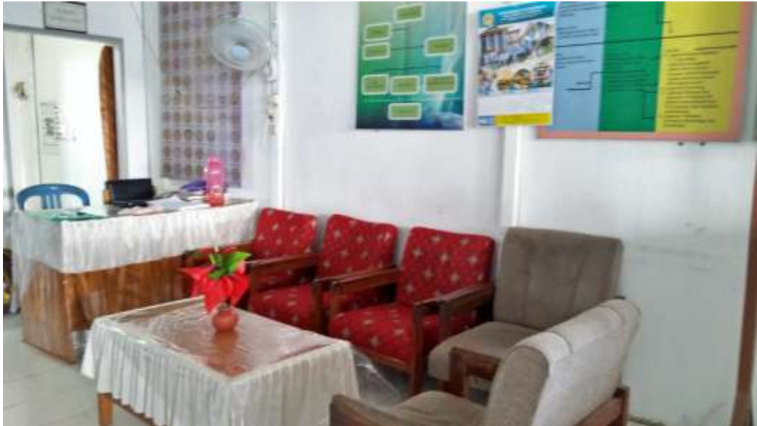
❖ Ruang Tamu Bimbingan dan Konseling SMAN 1 Daha Utara