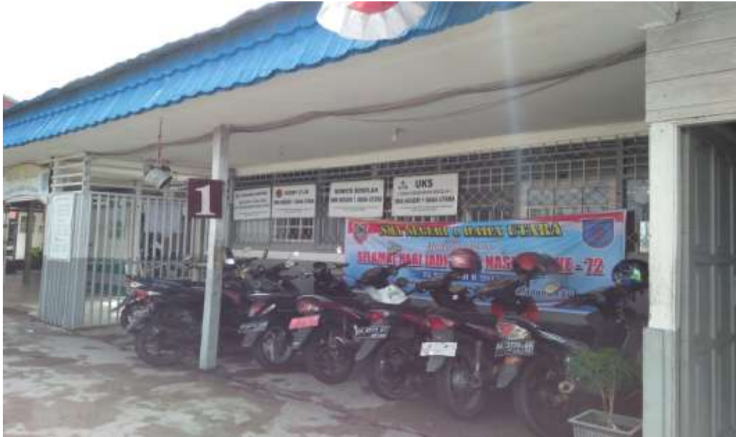
❖ Tempat Parkir Guru dan Staf Tata Usaha SMAN 1 Daha Utara