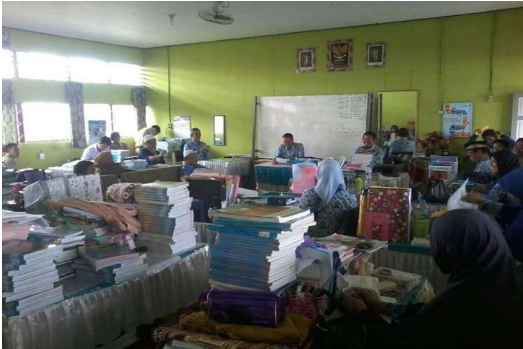
❖ Rapat Dewan Guru SMAN 1 Daha Utara