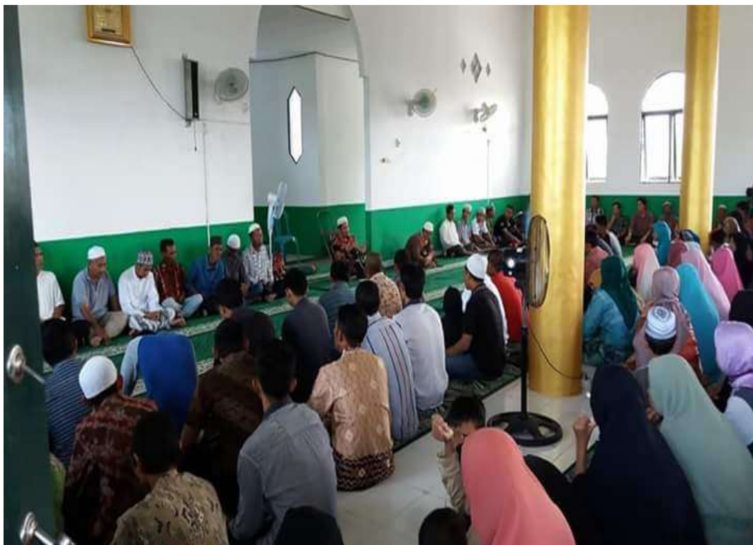
❖ Pertemuan Orang tua/ Wali Peserta didik dalam rangka silaturahmi dewan guru SMAN 1 Daha Utara