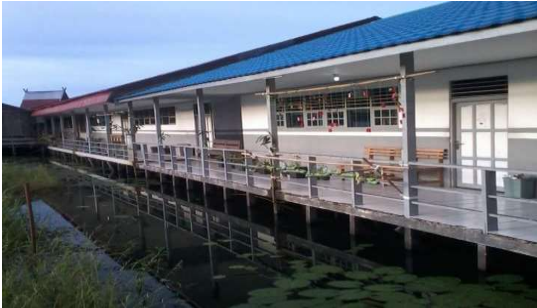
❖ Ruang Kelas SMAN 1 DAHA UTARA