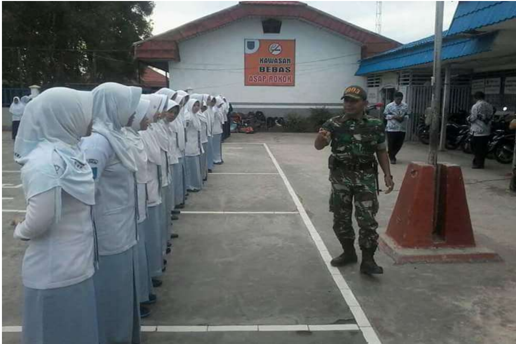
❖ Pelatihan baris berbaris dan pengarahan dari Korim/ Kepolisian