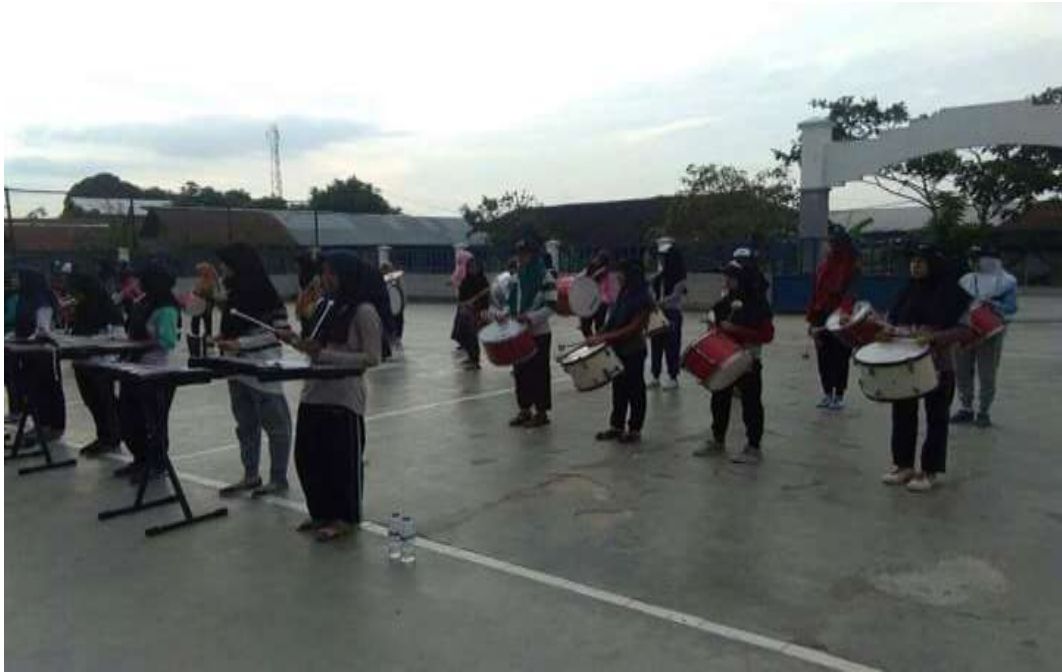
❖ Ektrakurikuler Drum Band SMAN 1 Daha Utara