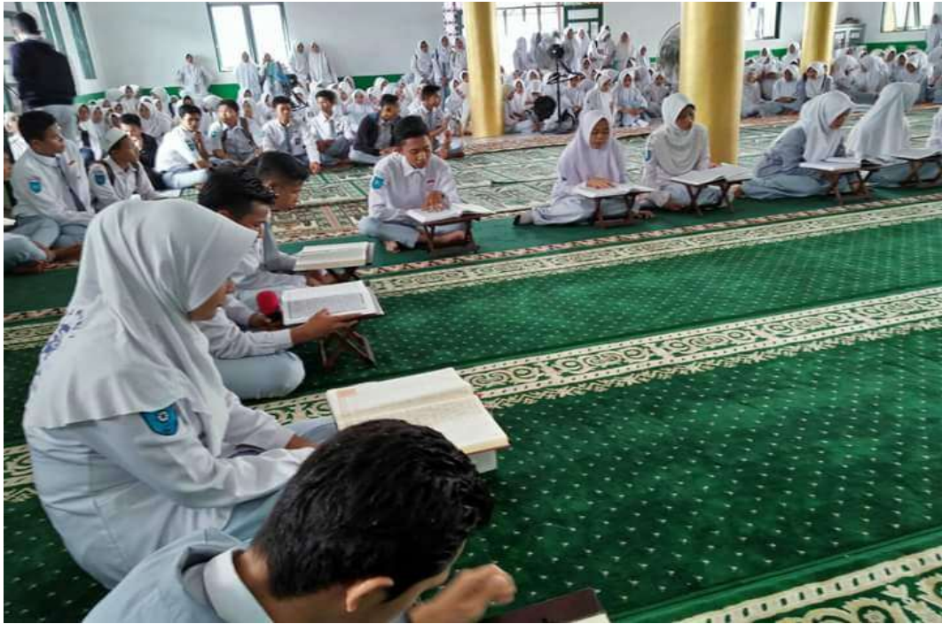
❖ Kegiatan Khataman Masal Peserta Didik SMAN 1 Daha Utara