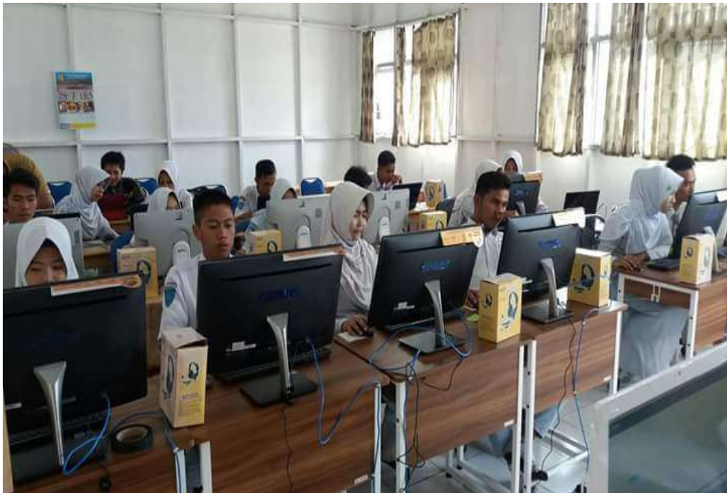
❖ Ruang Komputer/ PSB (Pusat Sumber Belajar) SMAN 1 Daha Utara