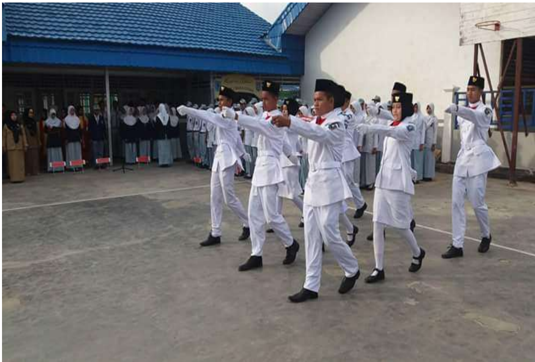
❖ Paskibraka SMAN 1 Daha Utara