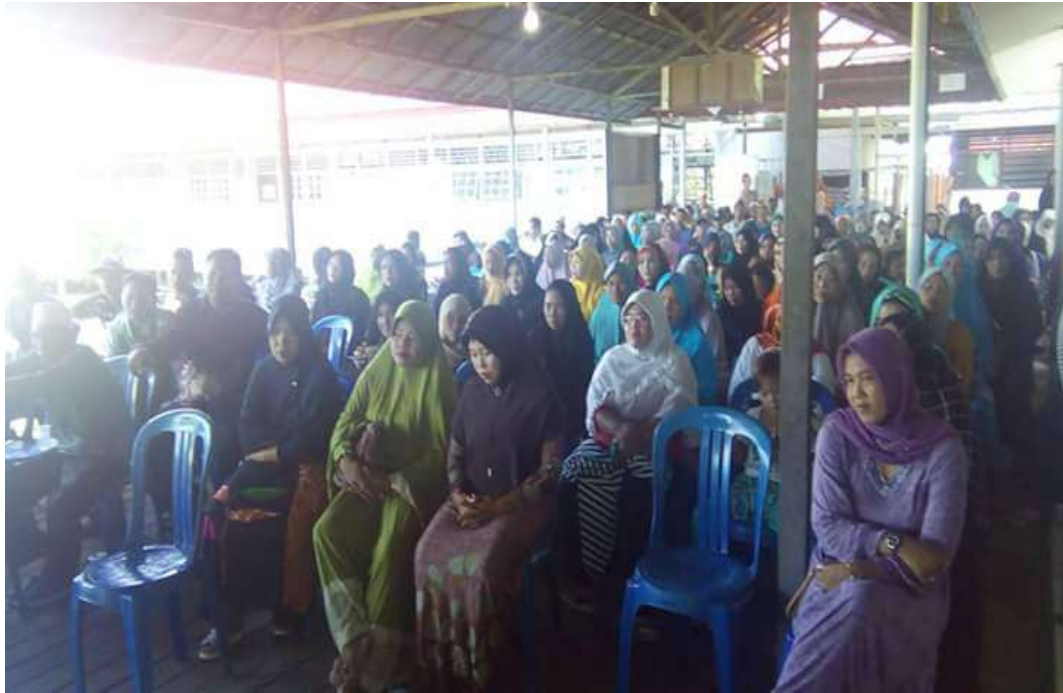
❖ Pertemuan Orang Tua Peserta didik Baru SMAN 1 Daha Utara