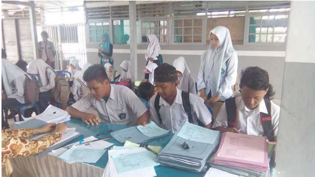
❖ Calon Peserta didik mendaftarkan diri di SMAN 1 Daha Utara