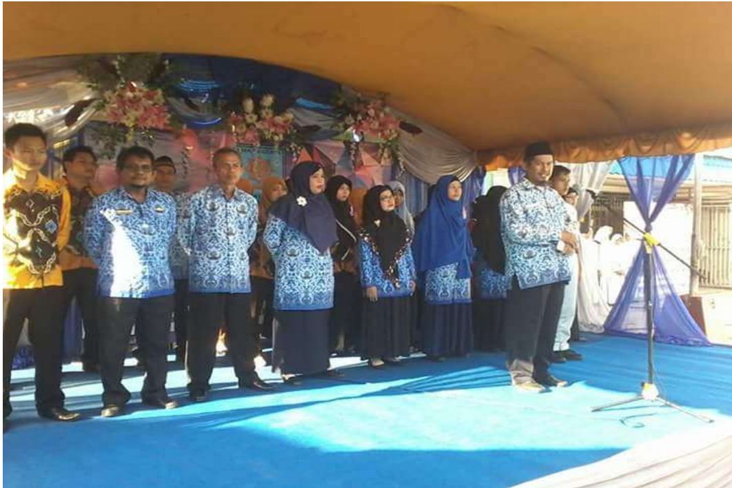
❖ Dewan Guru SMAN 1 Daha Utara.