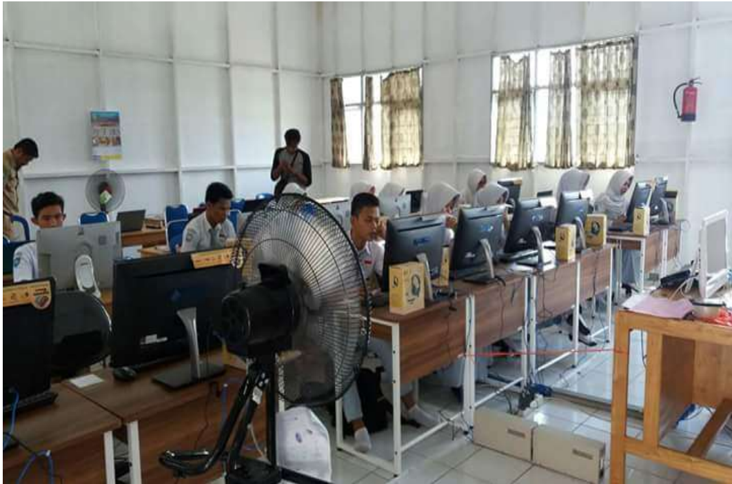
❖ Ruang Komputer/ PSB (Pusat Sumber Belajar) SMAN 1 Daha Utara