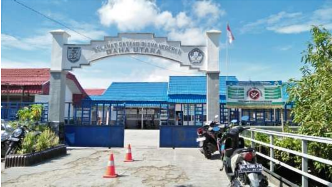
❖ Pintu Gerbang SMAN 1 DAHA UTARA