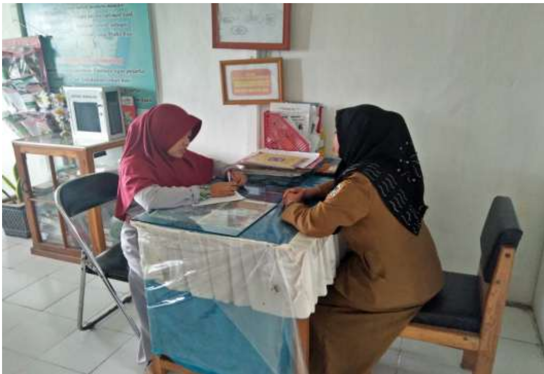
❖ Wawancara dengan Guru BK SMAN 1 Daha Utara.