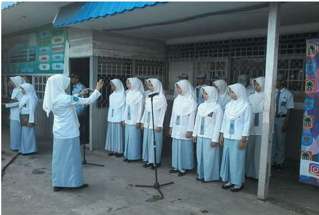
❖ Paduan Suara SMAN 1 Daha Utara