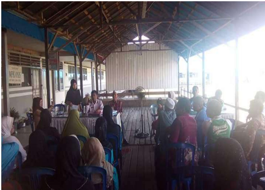
❖ Panitia PPDB memberikan informasi tentang persyaratan dan ketentuan yang berlaku di SMAN 1 Daha Utara kepada Orang Tua Peserta didik Baru