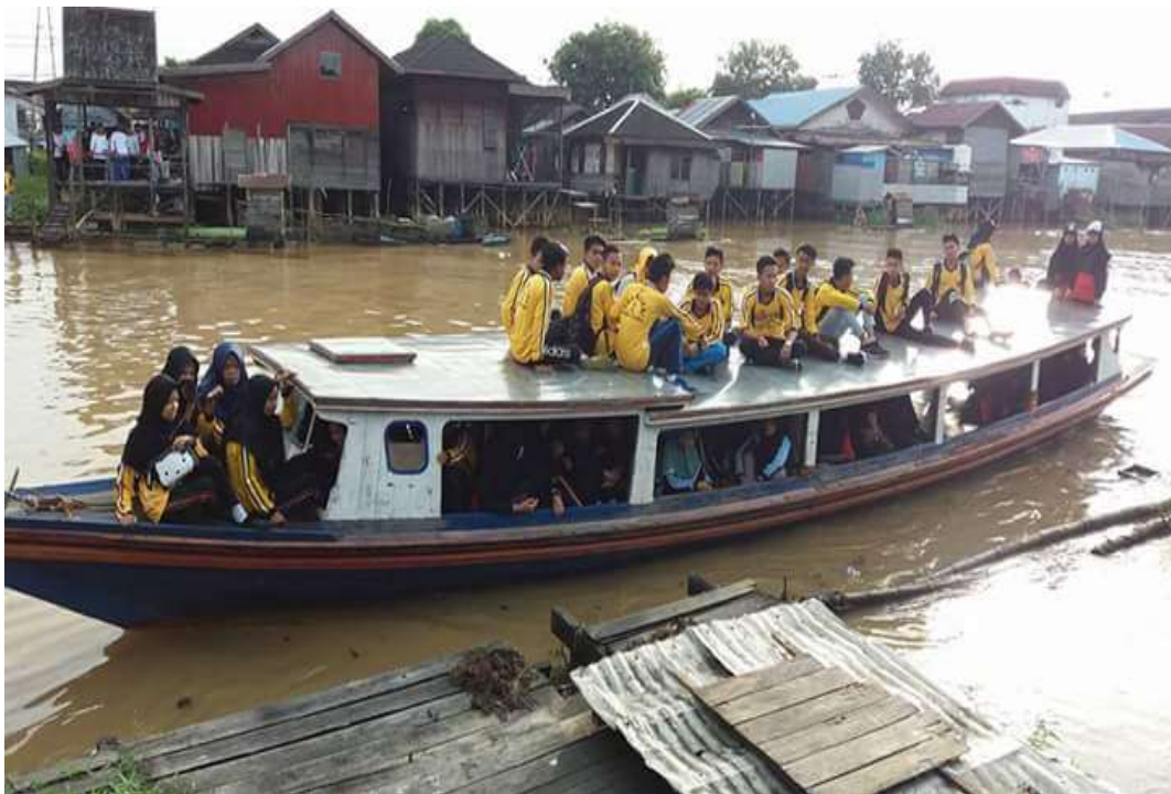
❖ Transportasi Peserta didik SMAN 1 Daha Utara.