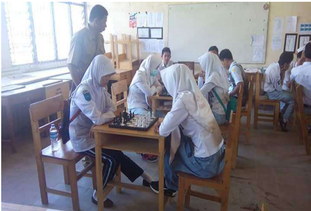
❖ Lomba Catur Peserta Didik SMAN 1 Daha Utara