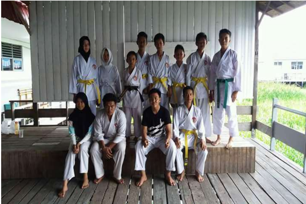
❖ Ekstrakurikuler Karate Lemkari SMAN 1 Daha Utara