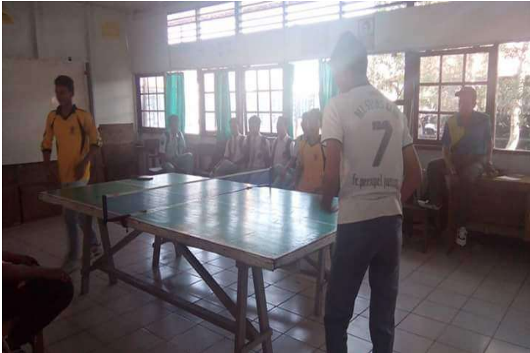
❖ Ekstrakurikuler Tenis Meja SMAN 1 Daha Utara