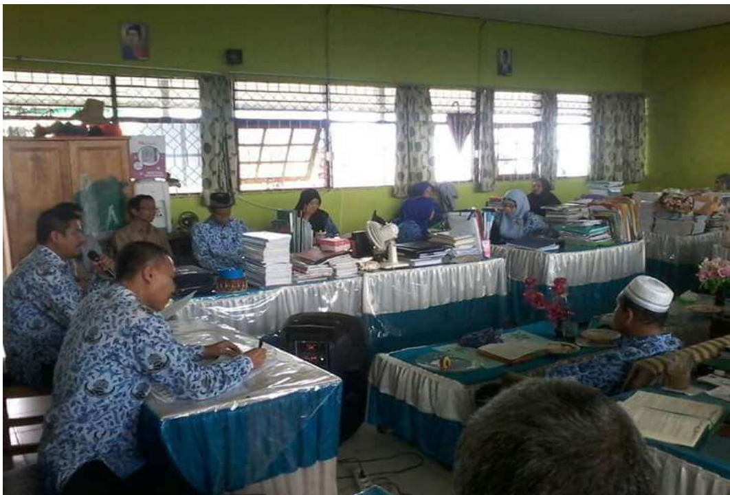
❖ Rapat Panitia PPDB tahun pelajaran 2017/2018