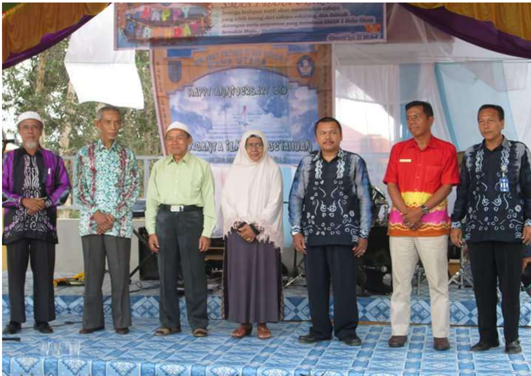
❖ Kepala SMAN 1 Daha Utara sejak tahun 1984