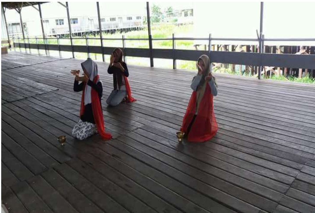
❖ Ekstrakurikuler Kreativitas Seni SMAN 1 Daha Utara