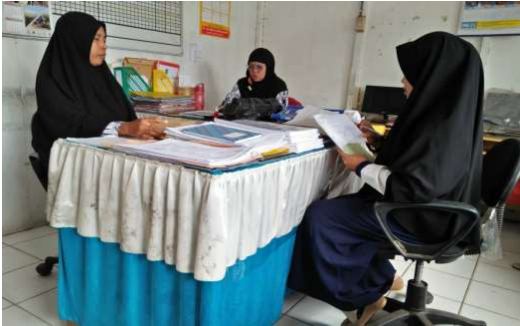
❖ Wawancara dengan Staf Tata Usaha SMAN 1 Daha Utara.