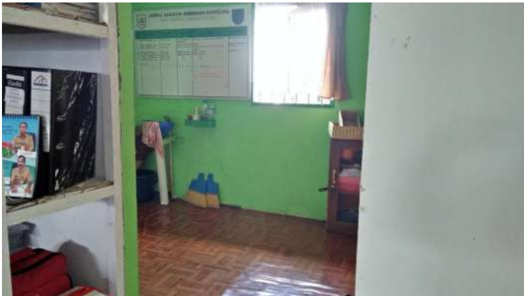
❖ Ruang Konseling Individu