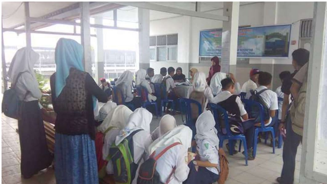
❖ Calon Peserta Didik SMAN 1 daha Utara menyerahkan berkas pendafrtran kepada panitia PPDB