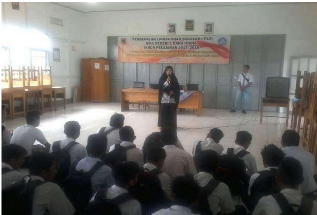
❖ Kegiatan Perkenalan Lingkungan Sekolah (PLS) SMAN 1 Daha Utara tahun pelajaran 2017/2018