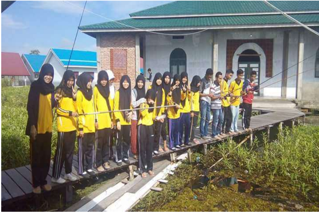
❖ Lomba Memancing Peserta didik SMAN 1 Daha Utara