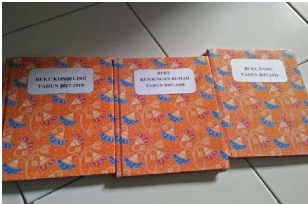
❖ Buku Konseling, Buku Kunjungan Rumah, dan Buku Tamu