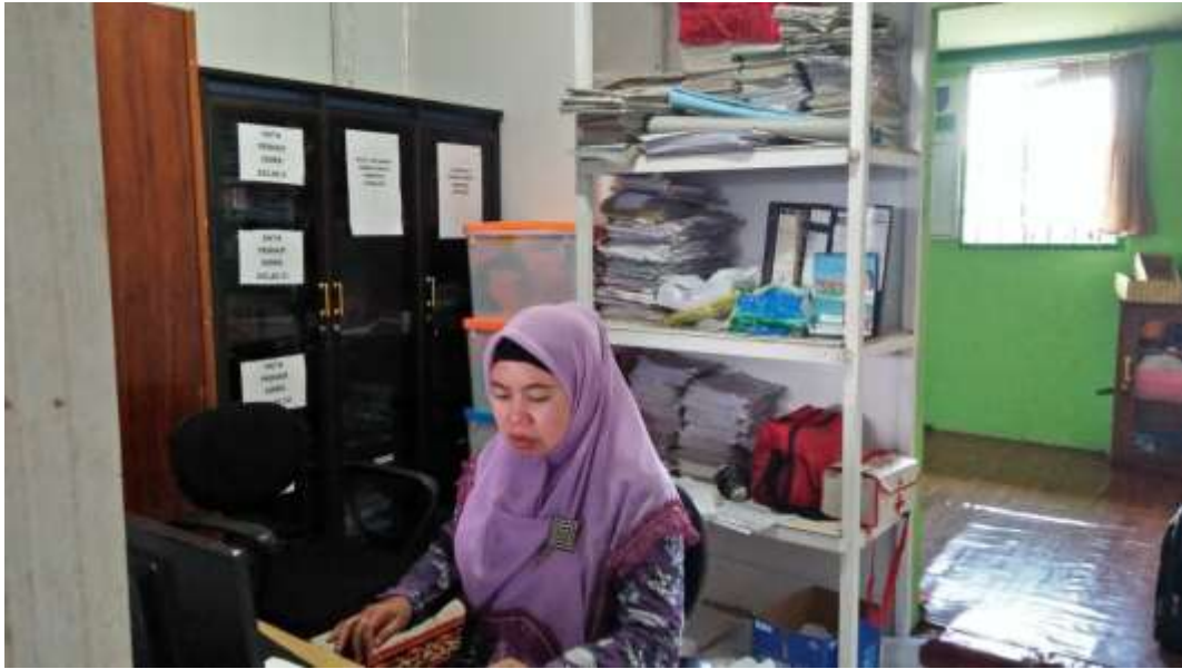
❖ Ruang Kerja Guru BK SMAN 1 Daha Utara