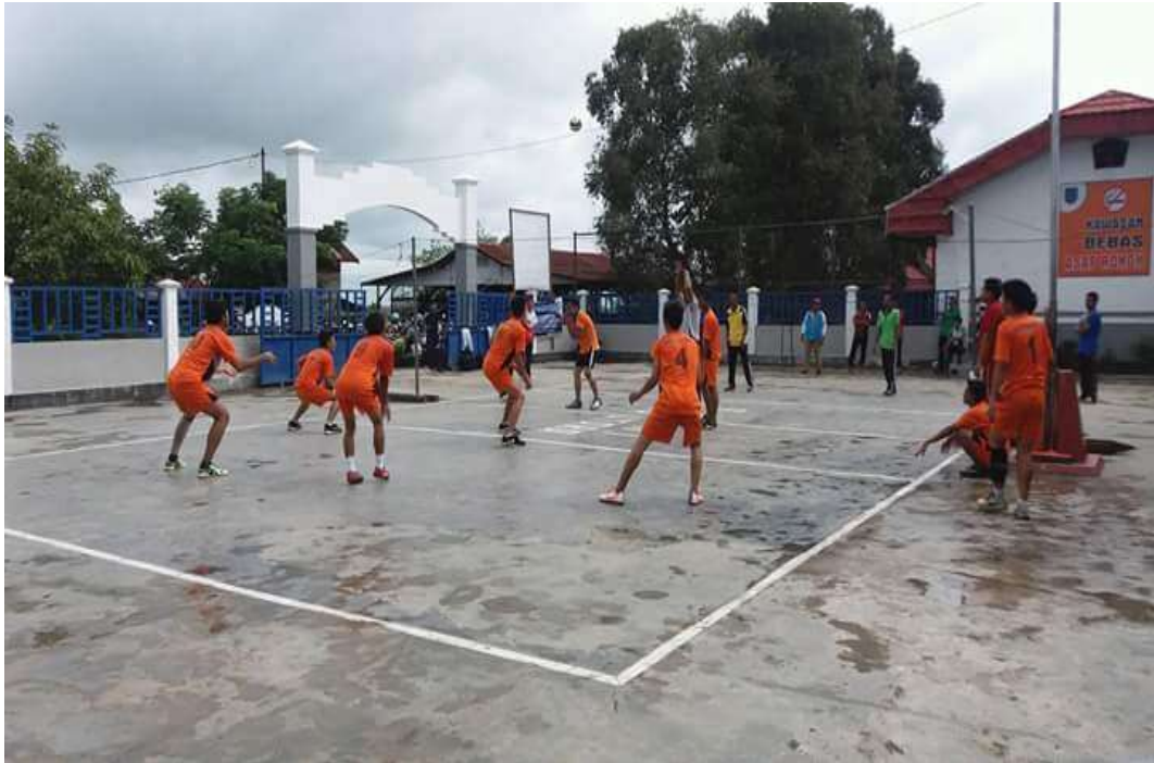
❖ Ekstrakurikuler Futsal SMAN 1 Daha Utara