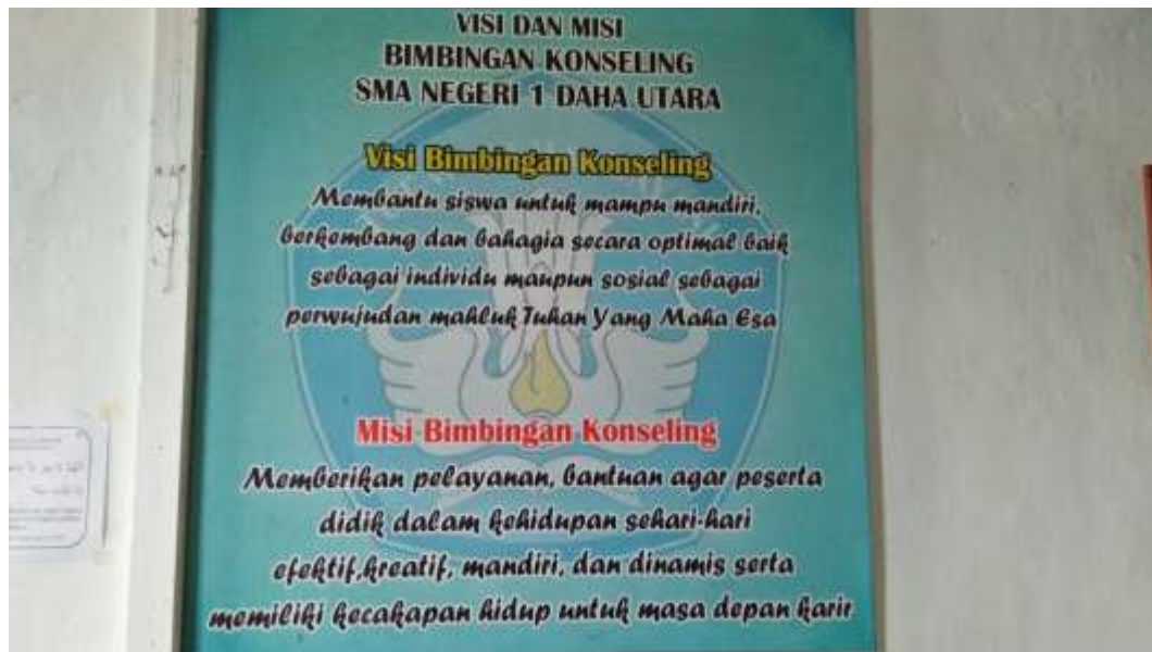
❖ Visi dan Misi Bimbingan dan Konseling SMAN 1 Daha Utara