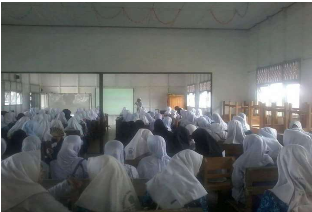
❖ Hari ke-2 Perkenalan Lingkungan Sekolah.