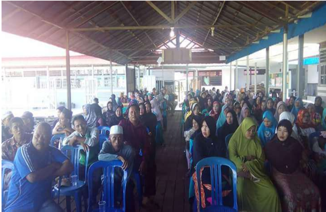
❖ Pelaksanaan Sosialisasi dan silaturahmi Orang Tua Peserta didik SMAN 1 Daha Utara