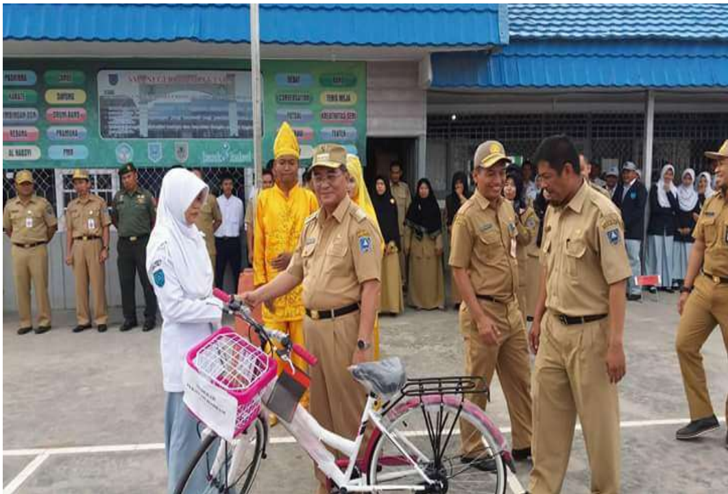
❖ Pemberian Hadiah (Sepeda) dari Bupati HSS untuk Peserta didik yang kurang Mampu.