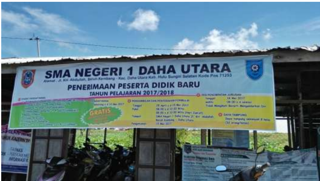
❖ Spanduk Penerimaan Peserta didik Baru SMAN 1 Daha Utara