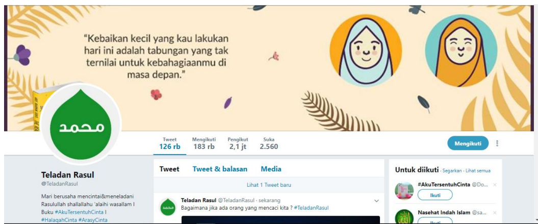
GAMBAR 4.1. PROFIL AKUN TWITTER @TELADANRASUL

Disini akan dipaparkan mengenai gambaran umum akun Twitter @TeladanRasul dan @FaktaAgama. Twitter merupakan salah satu media sosial yang cukup populer saat ini, anak muda hingga pejabat negara pun menggunakan Twitter. Kemudahan menggunakannya bisa membagi tulisan foto dan video kepada khalayak banyak. Akun Twitter @TeladanRasul dan @FaktaAgama termasuk dari perkembangan mensyiarkan dakwah melalui media sosial.