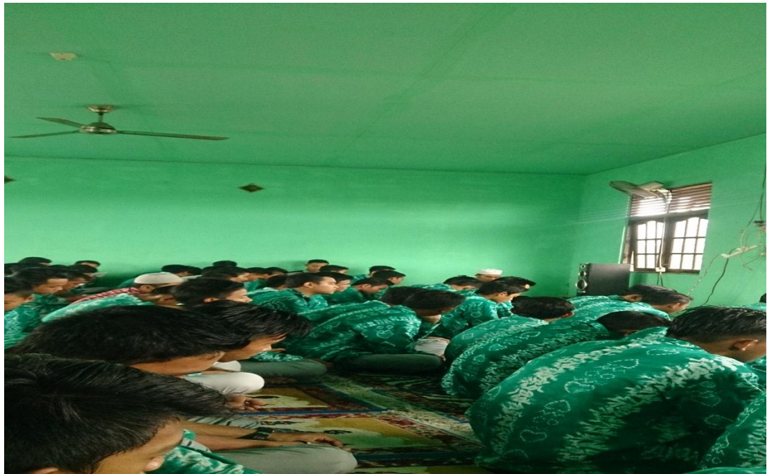
Pemberian Kultum dan Nasihat Setelah Shalat Berjamaah