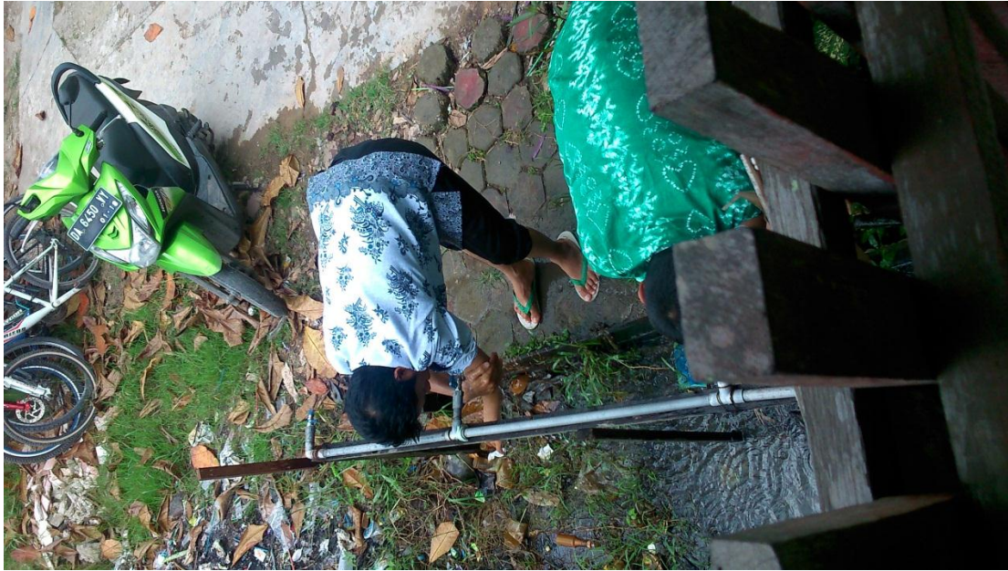
Tempat Wudhu MA SMIP 1946 Banjarmasin