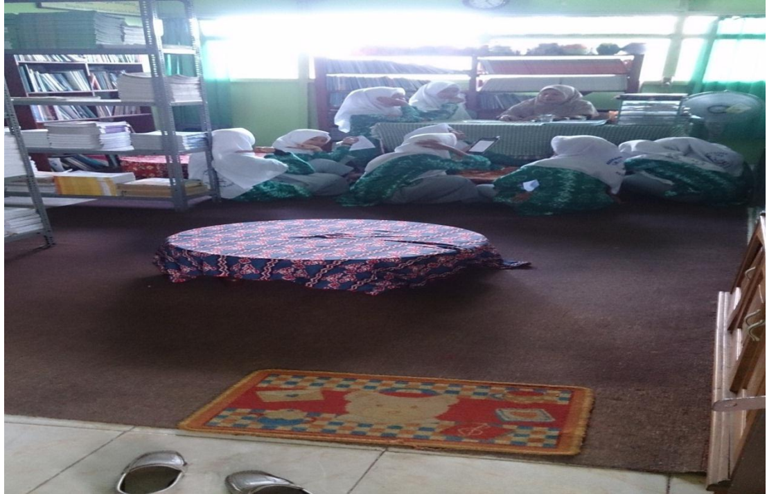
Pemberian bimbingan membaca al-Qur'an