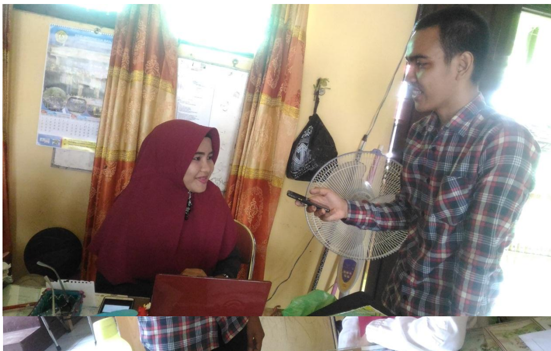
Wawancara dengan guru umum