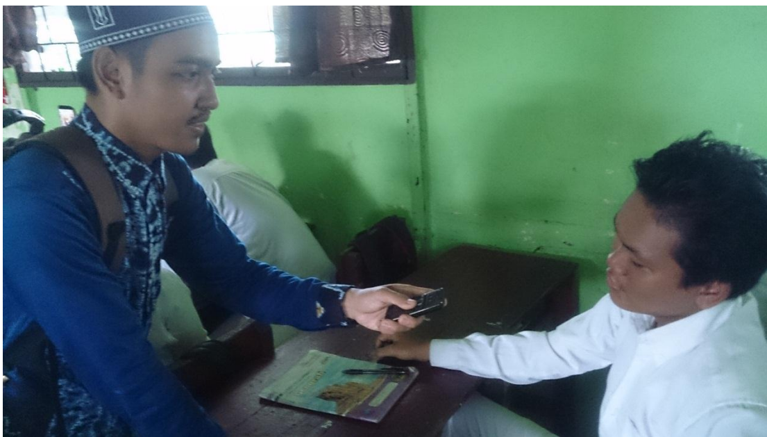
Wawancara dengan peserta didik