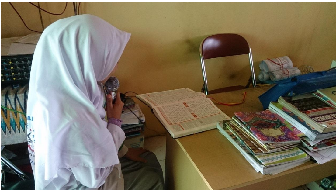
Peserta didik yang memimpin tadarus al- Qur'an dan Asma'ul husna