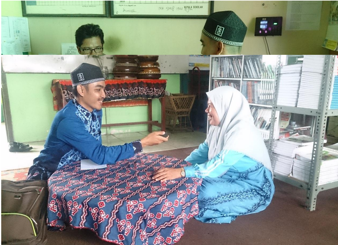
Wawancara dengan guru agama