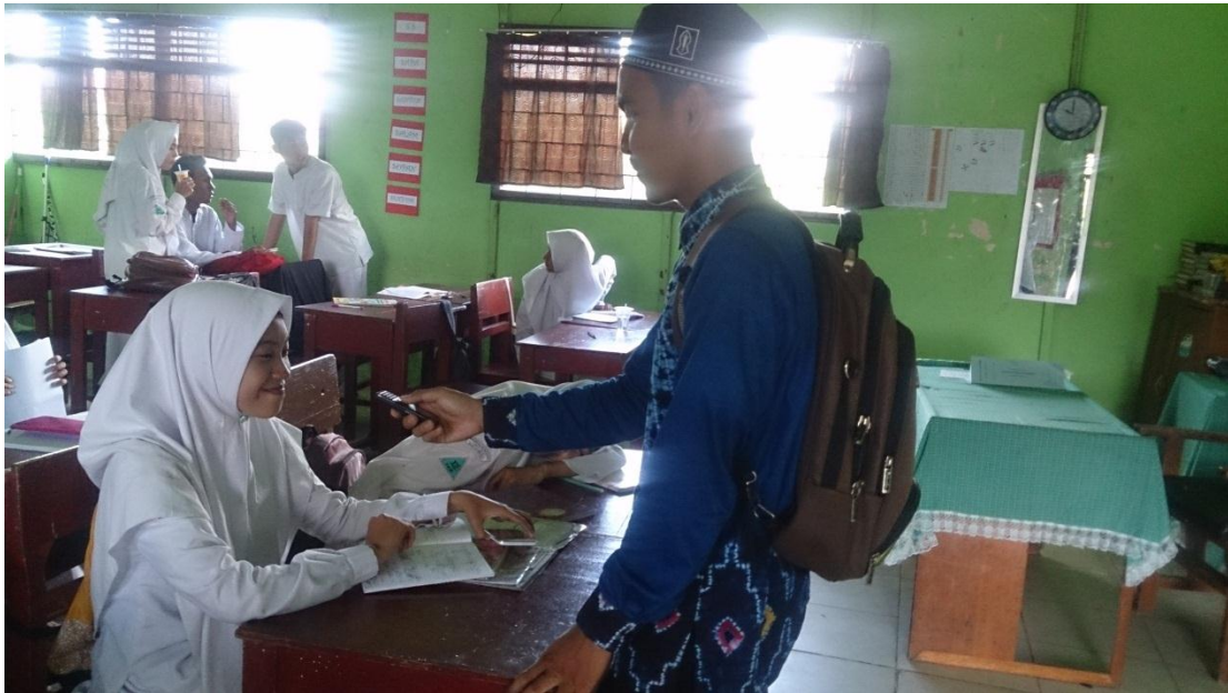
Wawancara dengan peserta didik