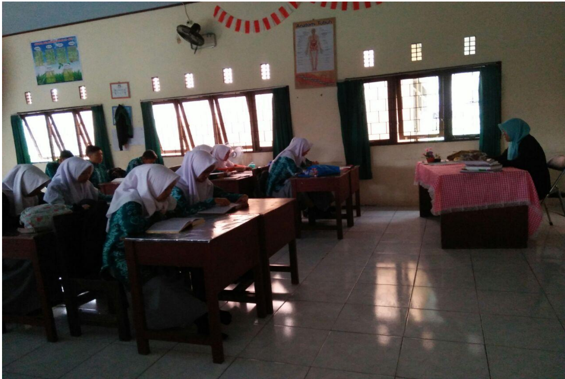
Kegiatan membaca al-qur'an setiap pagi bersama guru