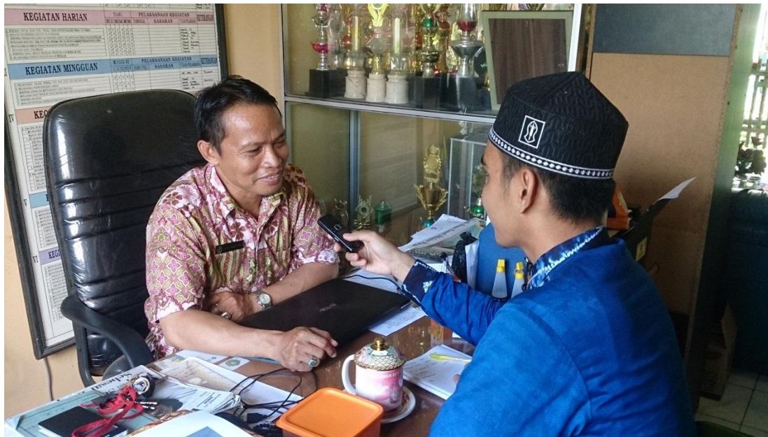
Wawancara dengan kepala madrasah