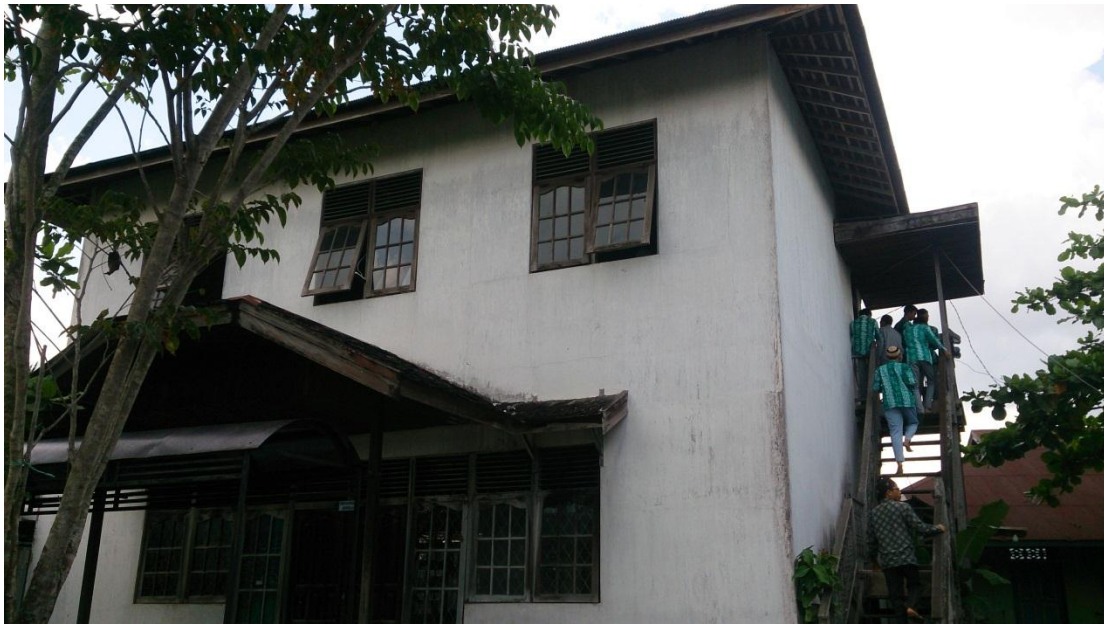
Musholla MA SMIP 1946 Banjarmasin