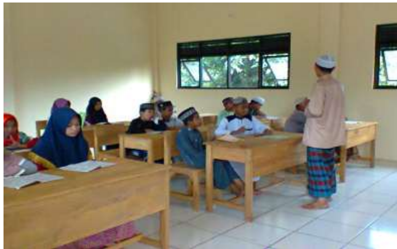
Foto kegiatan belajar Tajwid