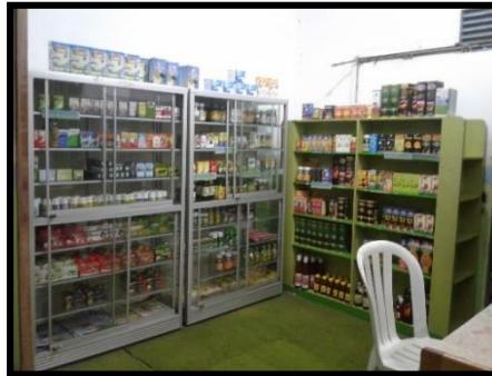
H. Produk Herbal dan Thayyib