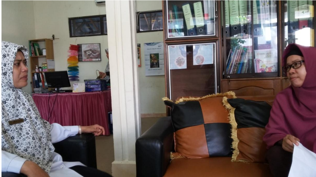
Wawancara peneliti dengan Kepala Sekolah SDIT Ukhuwah Banjarmasin