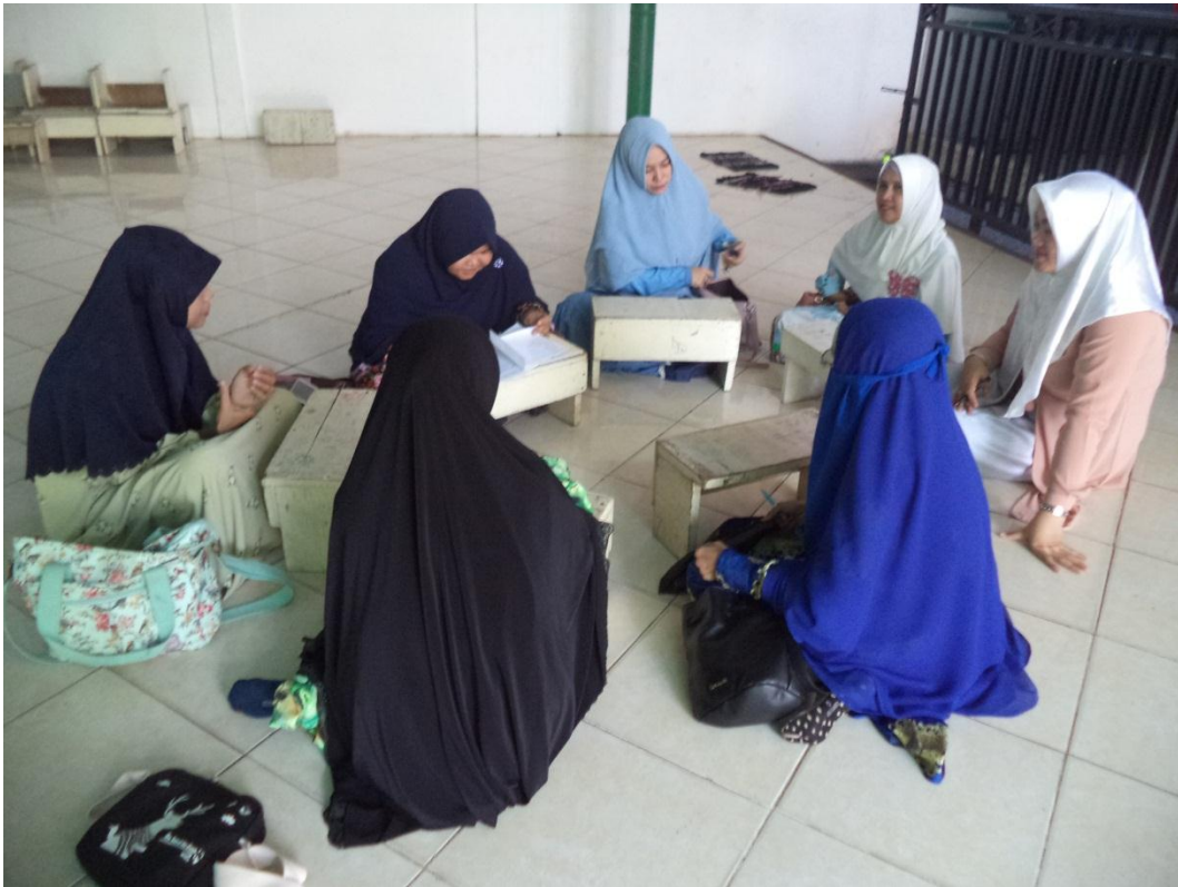
Kegiatan Halaqah Tahsin Orang Tua Siswa SDIT Ukhuwah Banjarmasin