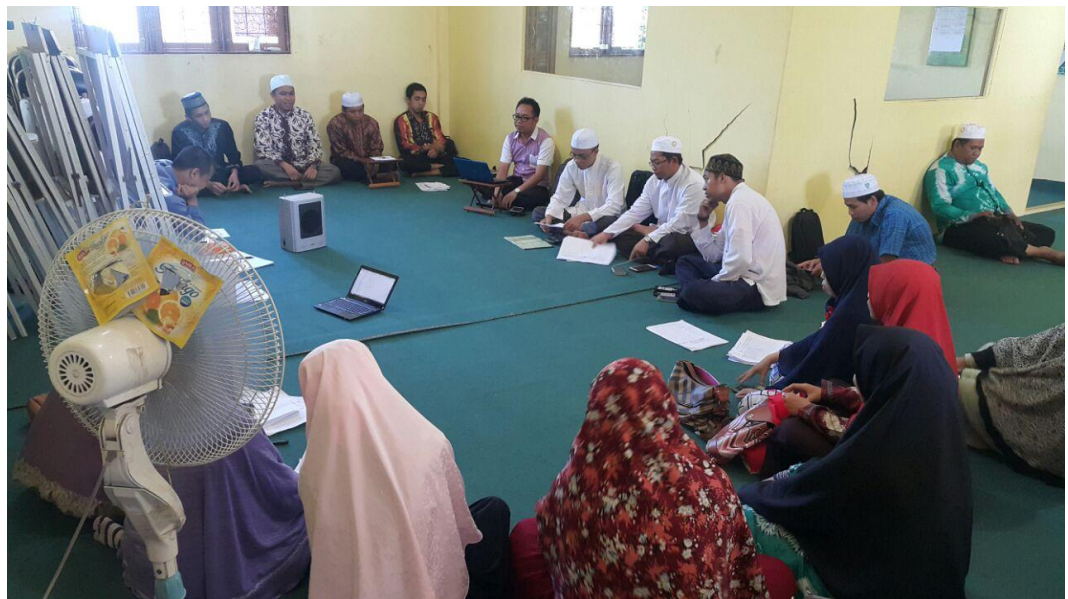
Kegiatan rapat mingguan Para Guru SDIT Ukhuwah Banjarmasin