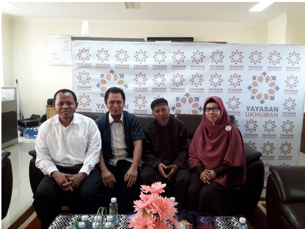
Wawancara peneliti dengan Yayasan SIT Ukhuwah Banjarmasin