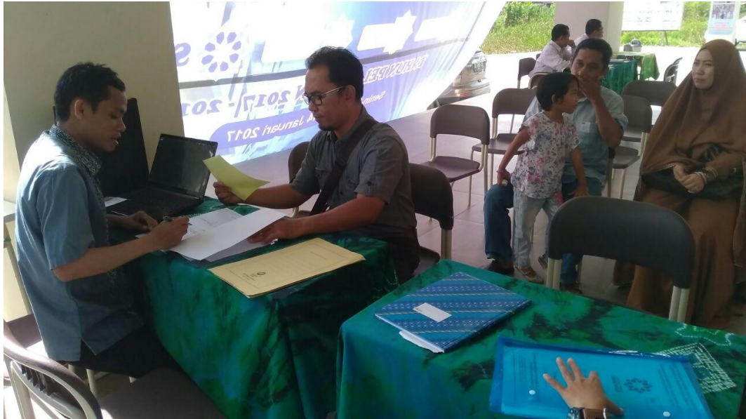
Kegiatan Penerimaan Peserta Didik Baru (PPDB) SIT Ukuwah Banjarmasin